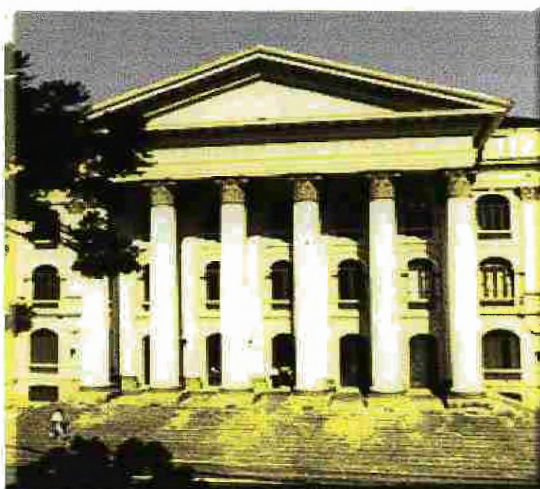
Figura 1 - Praça Santos Andrade