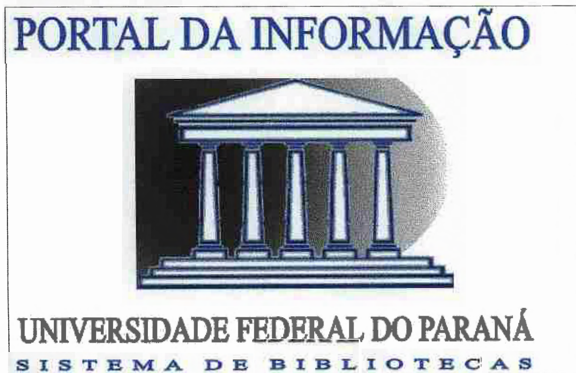
Figura 3 - Entrada do Portal da Informação do SIBI