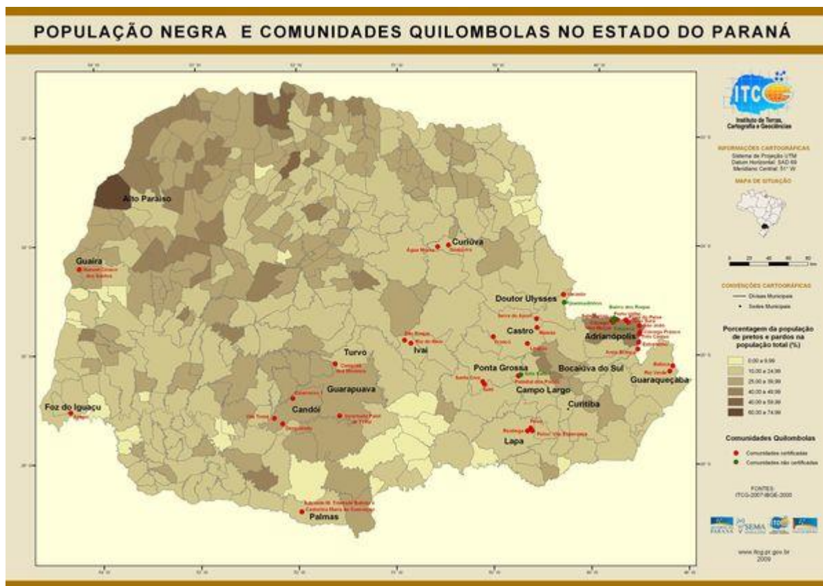
Figura 1 – População negra e comunidade quilombolas no Paraná