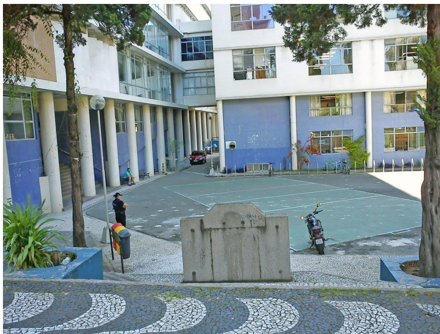
Figura 02 - Universidade Federal do Paraná – Campus Reitoria

A pesquisa teve seu desenvolvimento na universidade federal do Paraná, sito a rua general Carneiro nº 43, no edifício Dom Pedro I campus reitoria. Esta instituição fica localizada no centro da capital do estado do paraná em sua capital Curitiba, fica a 74 e quatro quilômetros da cidade de Paranaguá litoral do Paraná. A pesquisadora utilizou para encontrar as informações a biblioteca, para a pesquisa de análise de conteúdo.