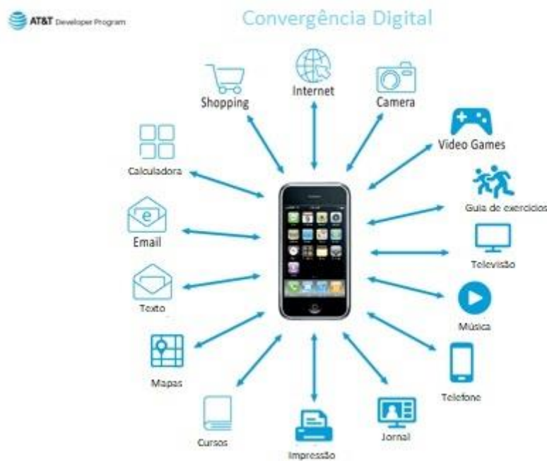
FIGURA 3: CONVERGÊNCIA DIGITAL.

acabam convergindo para um mesmo dispositivo, como podemos perceber na FIGURA 3. Com a convergência, é possível ao usuário: comunicar, fazer transações bancárias, ouvir música, ver vídeo, pedir comida, fazer compras, se comunicar com outros aparelhos, jogar, e até acessar as câmeras da residência. A figura mostra que a internet, câmera, vídeo games, guia de exercício, filmes e televisão, música, telefone, notícias, impressões, cursos, mapas, e-mails, mensagens, calculadora e compras podem estar em um único dispositivo. (FIGURA 3)