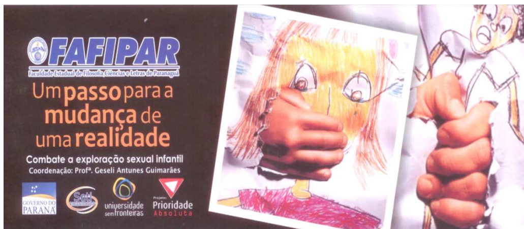
Material de divulgação do projeto.

Inicialmente, quando o projeto se empenhou em criar seus dispositivos de abordagem e divulgação, encontrou algumas dificuldades, mas a união das estagiárias e da coordenação fez com que o material pudesse ser elaborado.