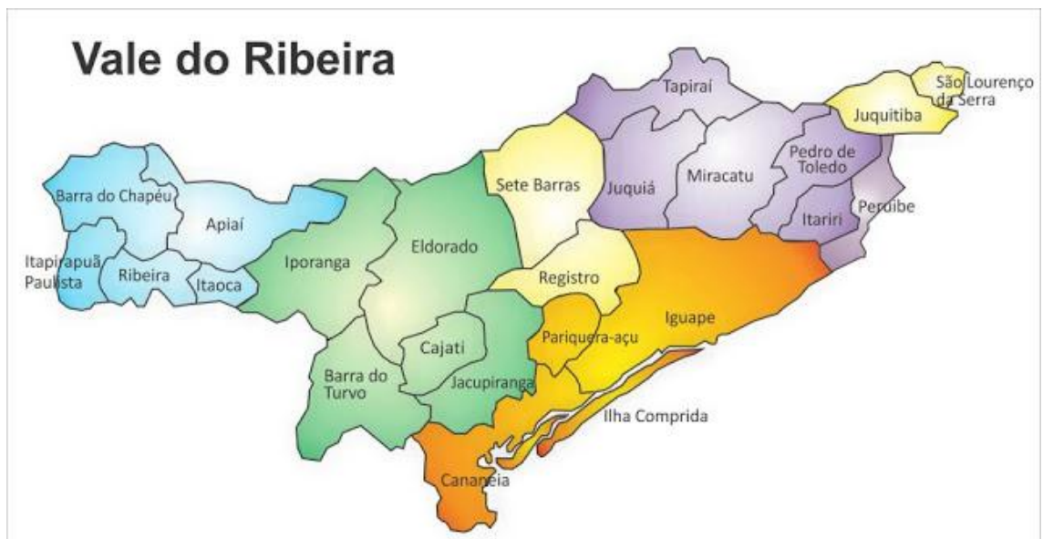
Figura 1 – Região do Vale do Ribeira

A região encontra-se bastante conservada e abriga uma forte característica de comunidades tradicionais e uma biodiversidade rica e conservada. A economia do Vale do Ribeira inicia – se com os ciclos econômicos baseado no ouro, café, arroz, chá e na banana. Estes produtos foram essenciais na transformação do vale da ribeira.