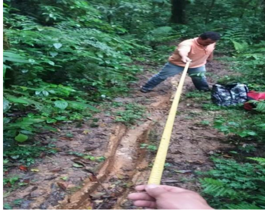
Foto8 - medição da extensão do sulco

Abaixo, tabela com o levantamento das coordenadas em utm inicial, meio e final e dos dados sobre a elevação e plano altimétrico da região objeto da pesquisa.