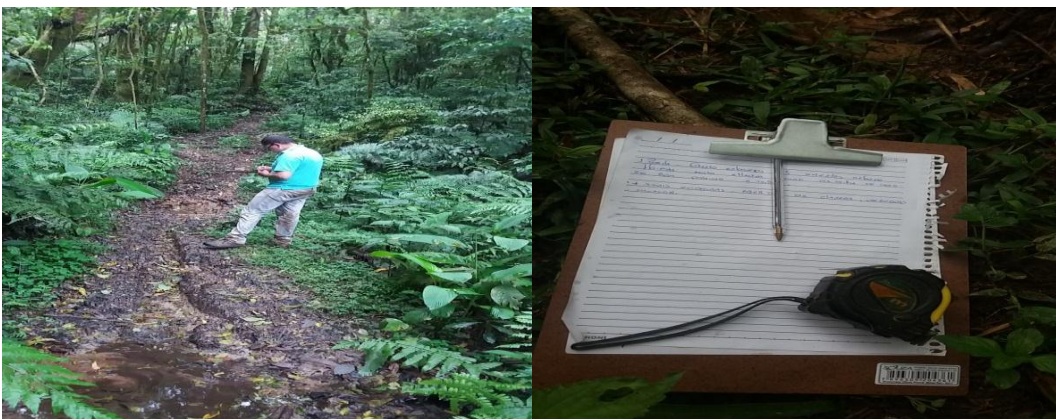
Fotos 6 e 7 - Atividades de medição de campo