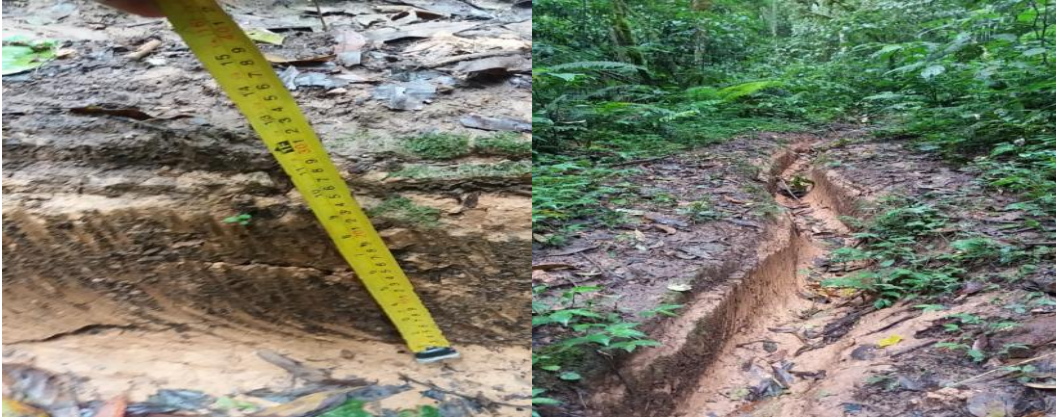
Fotos 2 e 3 - Profundidade do sulco