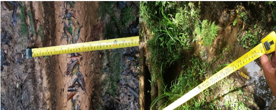
Foto 4 - Largura do sulco Foto 5 - Medição do córrego