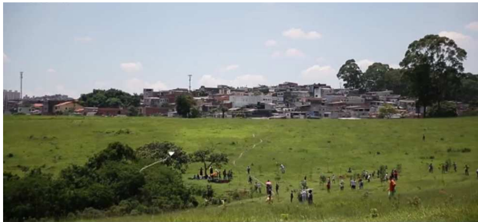
Foto 01 - Área do Parque dos Búfalos, utilizada para o lazer da população, antes do início das obras de construção do Empreendimento denominado Conjunto Residencial "Espanha"