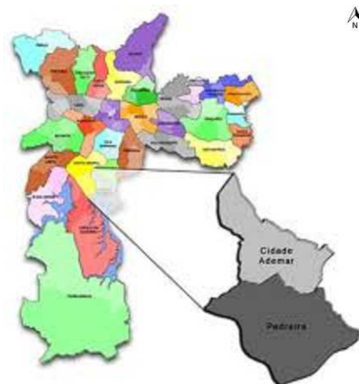
Mapa 03 - Divisão Territorial e Administrativa de São Paulo (sem escala)