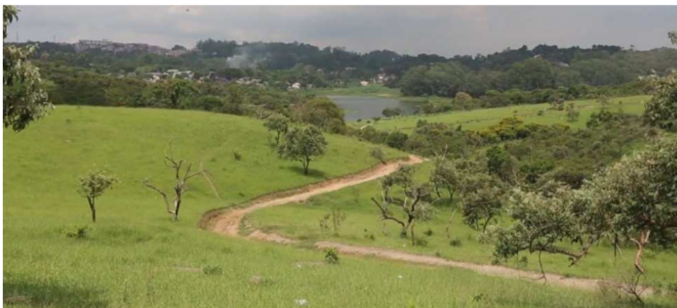
Foto 03 - Área do Parque dos Búfalos antes do início das obras de construção do Empreendimento denominado Conjunto Residencial "Espanha"