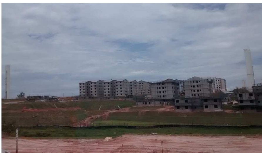
Foto 05 - Conjunto Residencial "Espanha"- Unidades já construídas