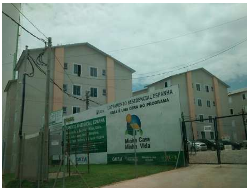
Foto 04 - Conjunto Residencial "Espanha"- Unidades já construídas