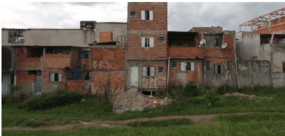
Foto 02 - Padrão construtivo das moradias do entorno do Parque dos Búfalos