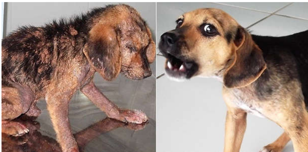
Figura 1- Cachorro enterrado vivo e resgatado

Os casos de maus tratos crescem a cada dia e parecem ser infinitos. A fim de demonstrar o que ocorre na realidade do cotidiano foram selecionados casos que estão demonstrados com as figuras expostas a seguir: