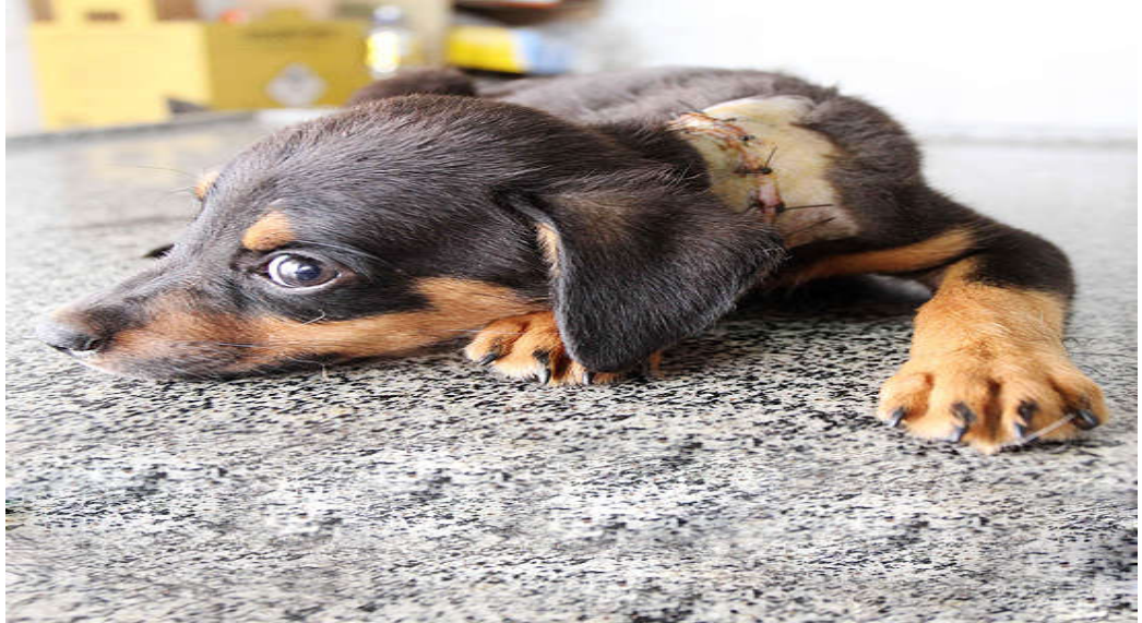
Figura 2- Cachorro com pescoço cortado

Consta que o responsável por tal prática irá responder por maus tratos e pode pegar a pena de até dois anos além de prestação pecuniária razoável.