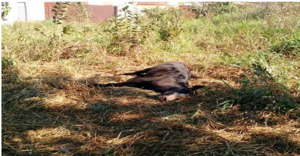
Figura 3- Cavalos mortos em Rondonópolis-MT