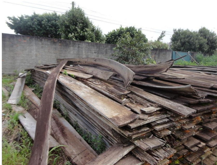
FIGURA 8: MADEIRAS DEPOSITADAS NO PÁTIO DA SECRETARIA DO MEIO AMBIENTE, CIDADE DE VILHENA/RO, INICIANDO O PROCESSO DE DETERIORAÇÃO.