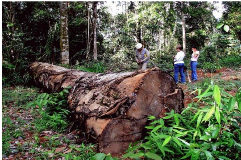
FIGURA 6: FLORESTA AMAZÔNICA: O ECODESENVOLVIMENTO TENTA EVITAR ERROS DO CRESCIMENTO TRADICIONAL, QUE LEVAM À DEGRADAÇÃO AMBIENTAL.