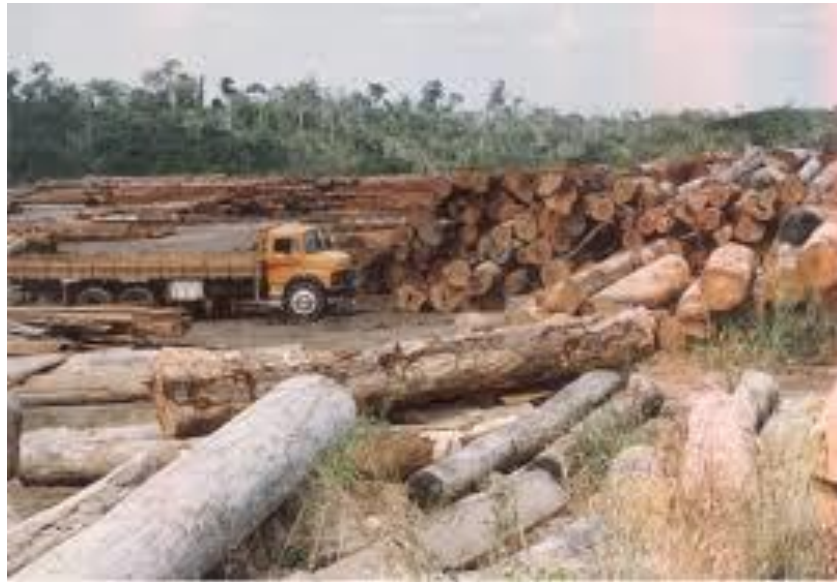
FIGURA 5: DEGRADAÇÃO AMBIENTAL NAS FLORESTAS