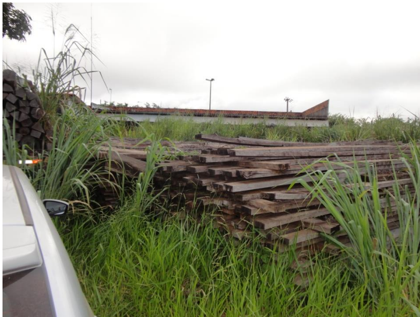
FIGURA 11: MADEIRAS ALOCADAS NO DEPÓSITO PÚBLICO DA CIDADE DE VILHENA/RO.