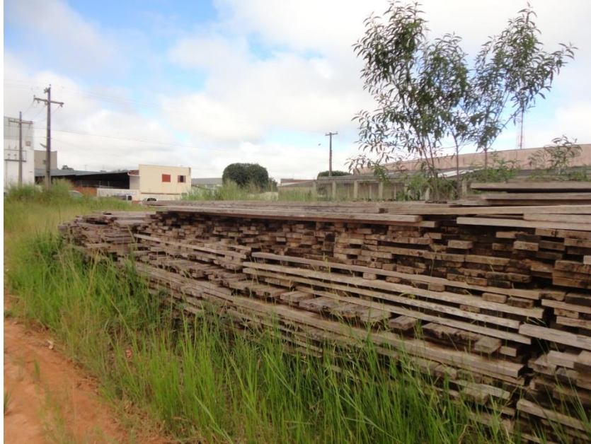
FIGURA 12: MADEIRAS ALOCADAS NO DEPÓSITO PÚBLICO DA CIDADE DE VILHENA/RO.