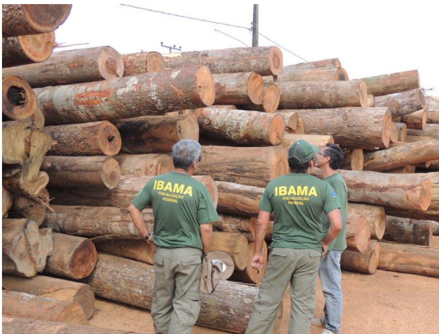
FIGURA 2: MADEIRA APREENDIDA PELO IBAMA