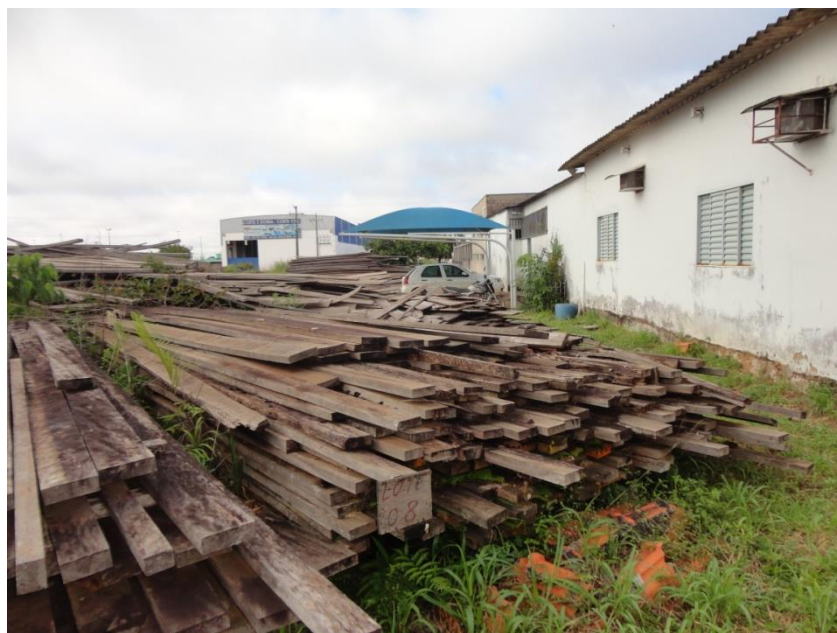
FIGURA 9: MADEIRAS DEPOSITADAS NO PÁTIO DA SECRETARIA DO MEIO AMBIENTE, CIDADE DE VILHENA/RO.