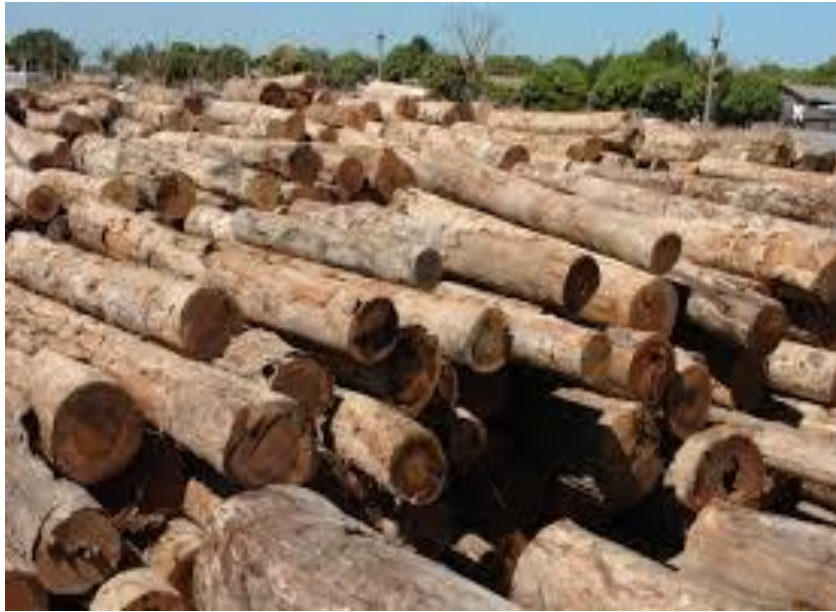
FIGURA 1: MADEIRA APREENDIDA PELO IBAMA

biodiversidade da fauna e da flora, a Região Norte apontou o maior índice de crimes ambientais, seguida pelas Regiões Sudeste e Nordeste (VASCONCELOS, 2013).