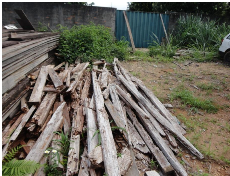
FIGURA 7: MADEIRAS QUE FORAM DEPOSITADAS NO PÁTIO DA SECRETARIA DO MEIO AMBIENTE, CIDADE DE VILHENA/RO E HOJE ESTÃO DETERIORADAS.