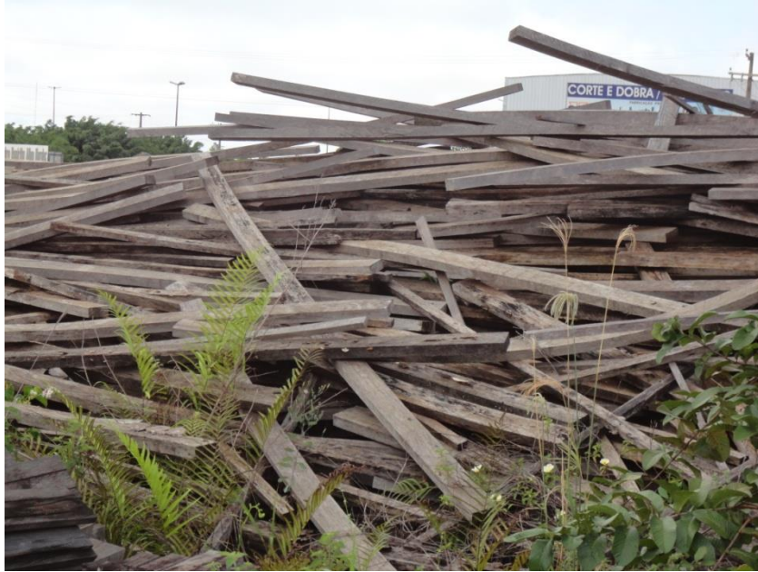
FIGURA 10: MADEIRAS AMONTOADAS NO PÁTIO DA SECRETARIA DO MEIO AMBIENTE, CIDADE DE VILHENA/RO.