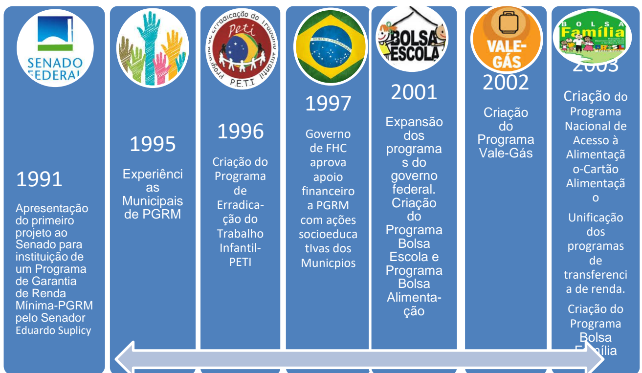
Tabela 1: Linha do tempo dos PTR's no Brasil.

Em suma, podemos inferir que a trajetória dos PTR no Brasil passou por pelo menos sete etapas (conforme tabela abaixo): (1)1991-primeiro projeto apresentado no Senado para instituição de um PGRM; (2)1995- Iniciaram-se as primeiras experiências municipais de PGRM; (3) 1996 -Criação do Programa de Erradicação do Trabalho Infantil; (4) 1997- O Governo de Fernando Henrique Cardoso aprova a Lei que dá apoio financeiro aos Municípios que realizam PGRM aliadas as ações socioeducativas; (5) 2001- Criação do Programa Bolsa Escola e do Programa Bolsa Alimentação; (6)2002- Criação do Vale-Gás; (7) Unificação dos Programas de transferência de renda e a criação do Programa Bolsa Família.