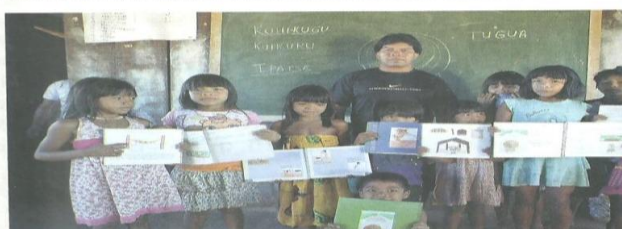
Professor e alunos na escola da aldeia Kulikuro, em Gaúcha do Norte, Mato Grosso, 2012.

A lei garante aos povos indígenas liberdade para lutar por seus direitos, aprender sua língua na escola e manter a posse da terra, na qual tradicionalmente vivem.