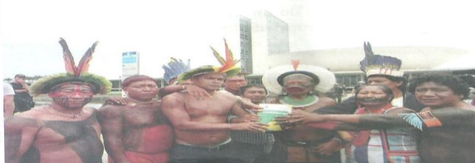
Indígenas em frente ao Congresso Nacional, Brasília, protestando sobre a demarcação de reservas indígenas, 2013. Os conflitos e protestos pela posse das reservas ainda estão presentes no cotidiano do Brasil atual.