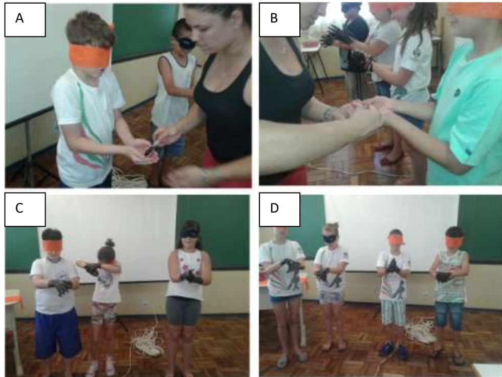
Figura 04: Imagens fotográficas representando a 2º Etapa: Aula Prática – Lavagens das mãos

Nota: Painel A: Professora colocando tinta nas mãos dos alunos com os olhos vendados; Painel B: Professora colocando tinta, como se fosse sabonete líquido, nas mãos dos alunos; Painel C: Alunos desenvolvendo passo a passo da técnica. Painel D: Alunos fazendo corretamente a higienização das mãos.