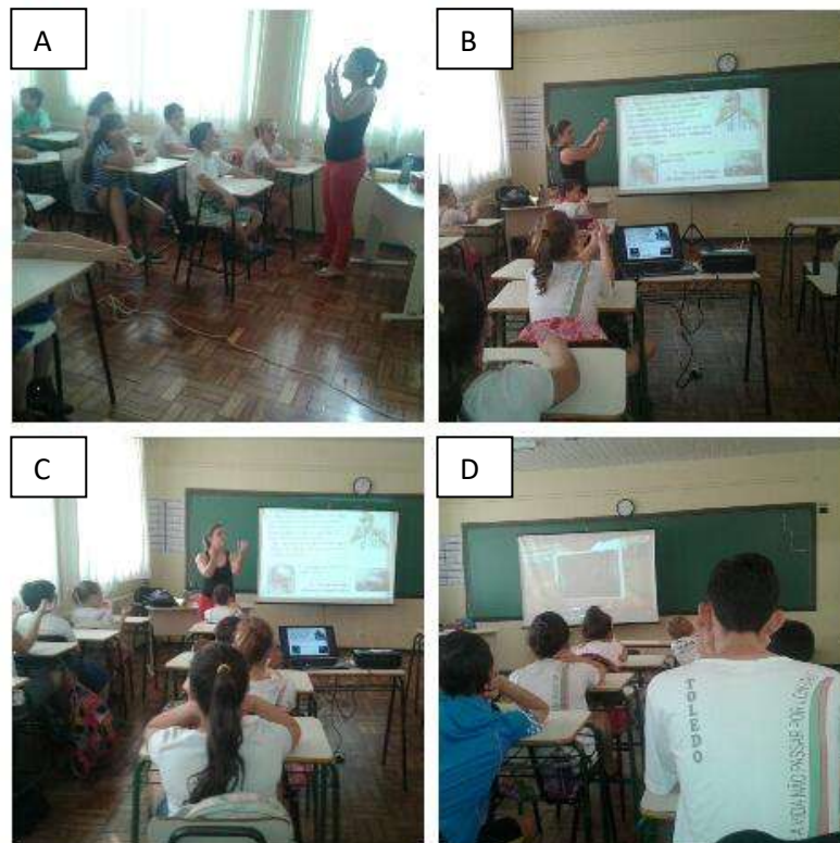
Figura 02: Imagens fotográficas do Projeto de Intervenção Etapa 01

Nota: Aula Teórica: Painel A: A Farmacêutica ministrando palestra para os alunos; Painel B: Professora mostrando imagens de higienização das mãos; Painel C: Professora mostrando a técnica da lavagem das mãos; Painel C: Alunos concentrados na palestra.