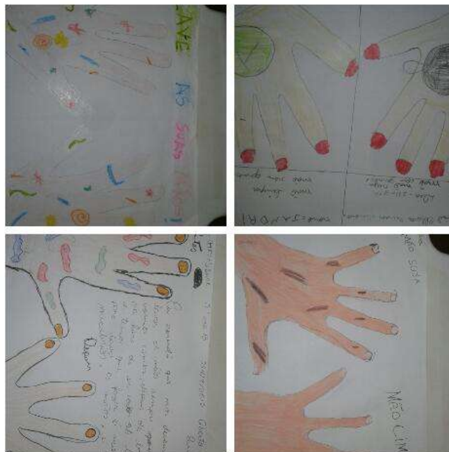
Figura 03: A segunda parte da primeira etapa: Representando desenhos dos alunos, depois de terem escutados a música.

Ao esfregar os dedos e as palmas com sabonete e água corrente, removemos a maioria dos germes que causam infecções. Com menos doenças, sobra mais tempo para a criança brincar, estudar e aprender. O adulto que cuida da saúde falta menos ao trabalho e pode dedicar mais tempo à família. Com as mãos limpas, evitamos transmitir doenças aos outros, uma demonstração de respeito pelas pessoas.