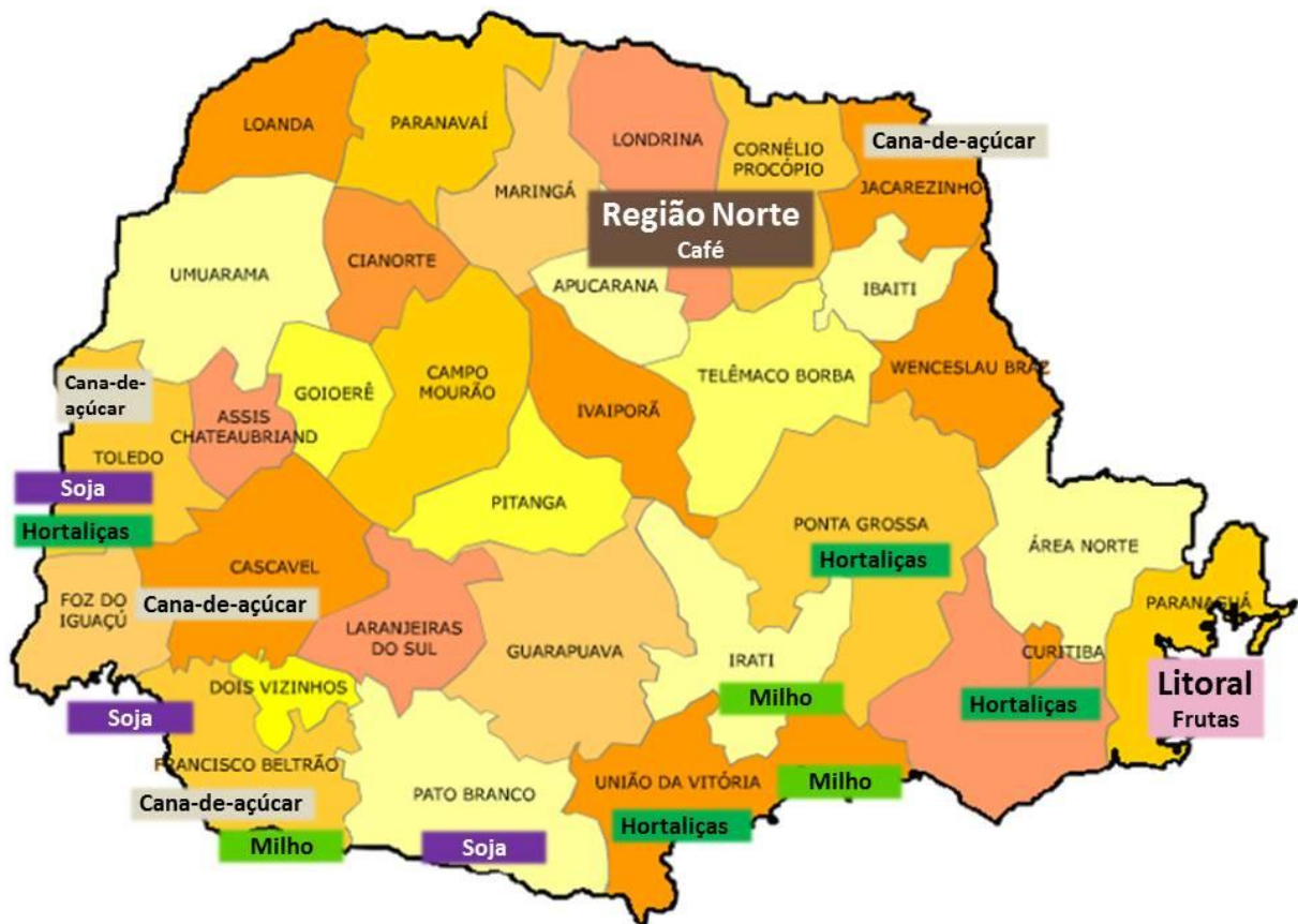
FIGURA 2 – REGIÕES E PRODUÇÃO ORGÂNICA DO PARANÁ