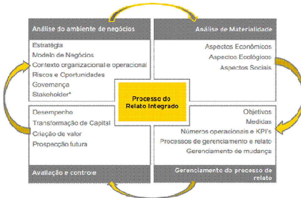
Figura 1: Ciclo do Relato Integrado.