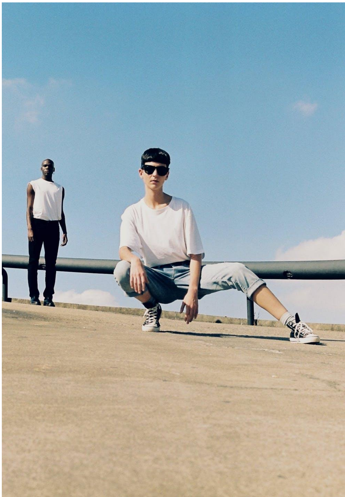
FIGURA 19 – Fotografia presente no layout do site da marca Basico.com