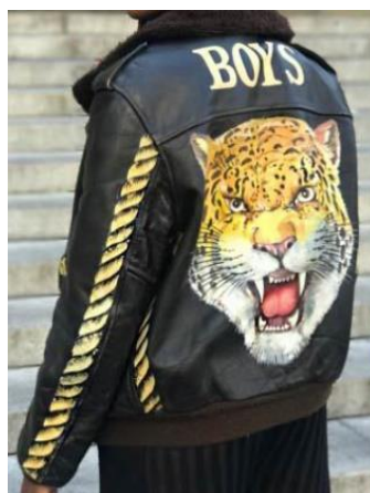
FIGURA 14– Uma das peças À La Garçonne com desenho de corda pintada à mão

Semioticamente, pode-se dizer que, nesta fotografia, estão presentes alguns aspectos icônicos que remetem a uma realidade à qual a marca deseja se associar, como o esporte, associado ao tênis e à bermuda, trajes comuns para o dia a dia; a ocupação dos espaços urbanos; e o jovem, consumidor principal da marca ALG e caráter essencial da marca.