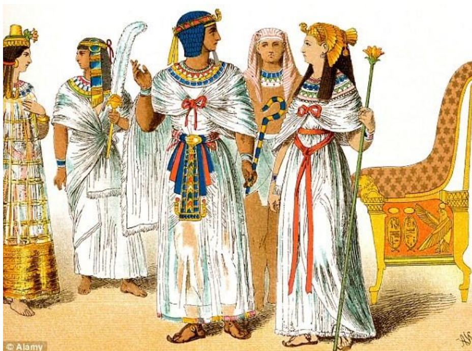
FIGURA 01 – Ilustração representando a indumentária do Egito Antigo FONTE: RHEA Cupta, 2017

Na Europa, com o desenvolvimento do mercantilismo na Idade Média, que se caracterizou por um conjunto de medidas econômicas por parte do Estado a fim de fortalecer os mercados internos, a ascensão das classes comerciantes proporcionou a essa classe burguesa copiar a forma de se vestir dos nobres, que, ao se verem copiados, inventam novas formas de se vestir, que, por sua vez, eram copiadas novamente. Este processo de “cópia e descarte das formas de se vestir” (AMARAL, 2012, p. 01) impacta a definição de moda que temos nos dias de hoje. Amaral classifica este conceito como essencialmente ocidental e capitalista, uma vez que carrega consigo uma conotação de “prazo de validade” (nas sociedades da Roma e da Grécia antigas, por exemplo, a forma de vestir permaneceu inalterada por séculos).