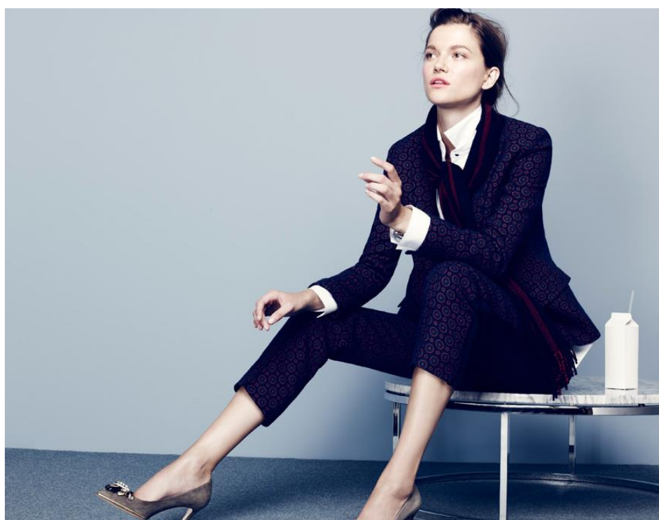
FIGURA 09 – O smoking masculino introduzido no vestuário feminino, influência dos modelos de Chanel, criados nos anos 1920

Segundo Carvalho (2016), quando se reflete sobre o passado da moda, é possível identificar os “ciclos de estilo”: a moda representa o espírito de um determinado tempo. Entretanto, desde o início dos anos 2000, a moda tem se baseado demasiadamente em décadas anteriores, e se limitado a recriar estilos. Um dos papéis inerentes à moda, o de mudar o pensamento social e a sociedade (como quando Gabrielle Chanel introduziu peças masculinas no vestuário feminino) tem se perdido, já que a maioria dos profissionais se dedica hoje a “revisitar o passado” e atender as demandas do mercado.