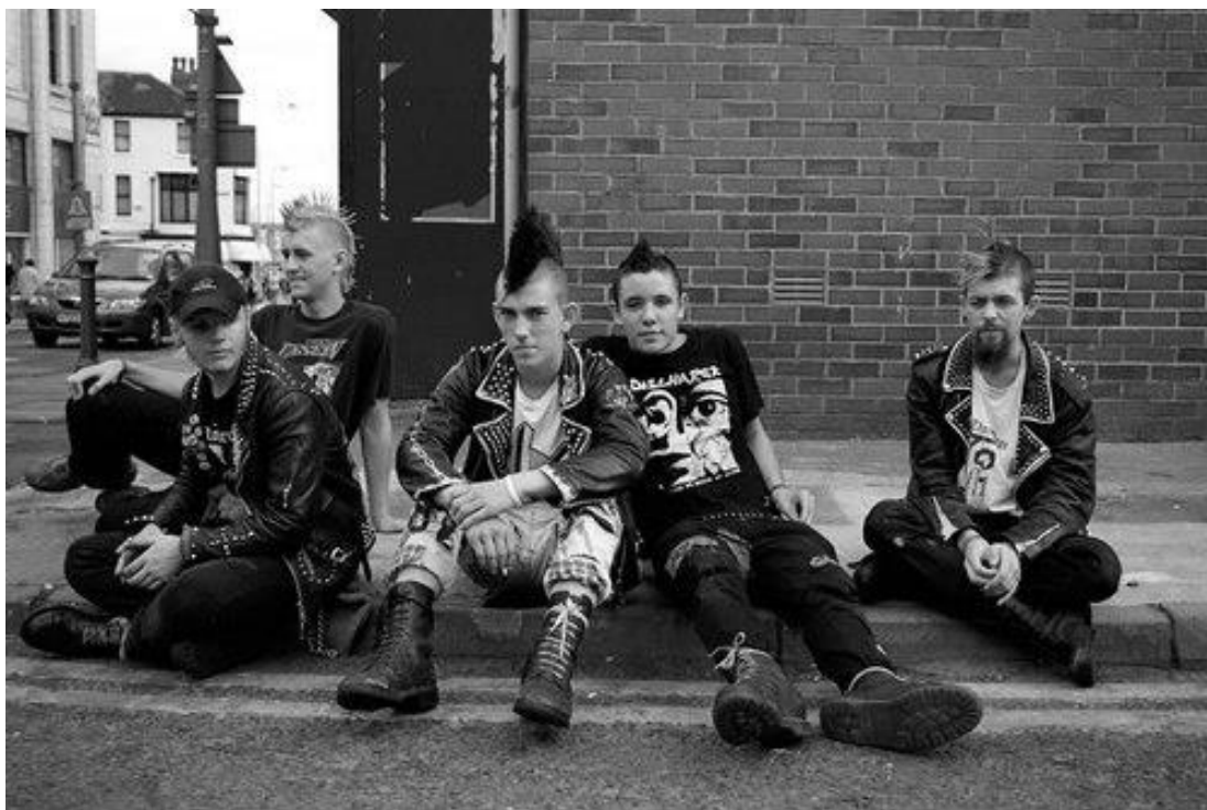
FIGURA 05 – Detalhes da estética punk