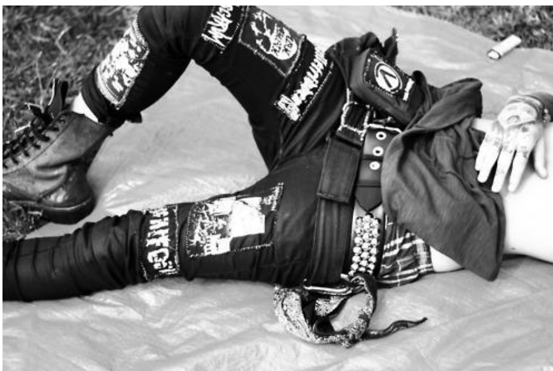
FIGURA 06 – Detalhes da estética punk