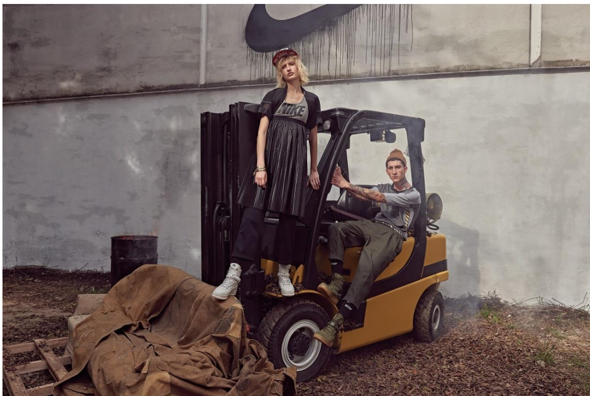
FIGURA 15 - Fotografia do editorial "Special Field Air Force 1", da À La Garçonne

O caráter simbólico é forte nesta campanha da marca. Os elementos da imagem e suas interpretações falam sobre juventude, rebeldia (como no ato de ocupar lugares da cidade), ação e movimento (no pulo do atleta para realizar a cesta), adaptação, liberdade para fazer escolhas e implementar soluções criativas (no espaço improvisado e na cesta reciclada), consciência e preocupação ambiental (no fato de que a cesta é feita com materiais reutilizados), além do aspecto contemporâneo e único da moda, sugerido pela composição da imagem e pelo caráter estético da cesta de basquete.