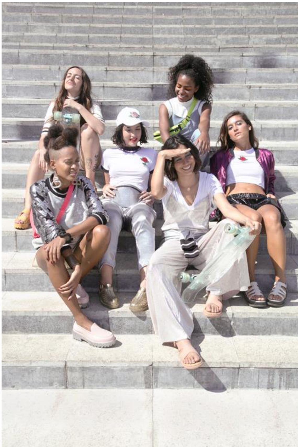
FIGURA 16 – Fotografia da coleção SK8, da Melissa