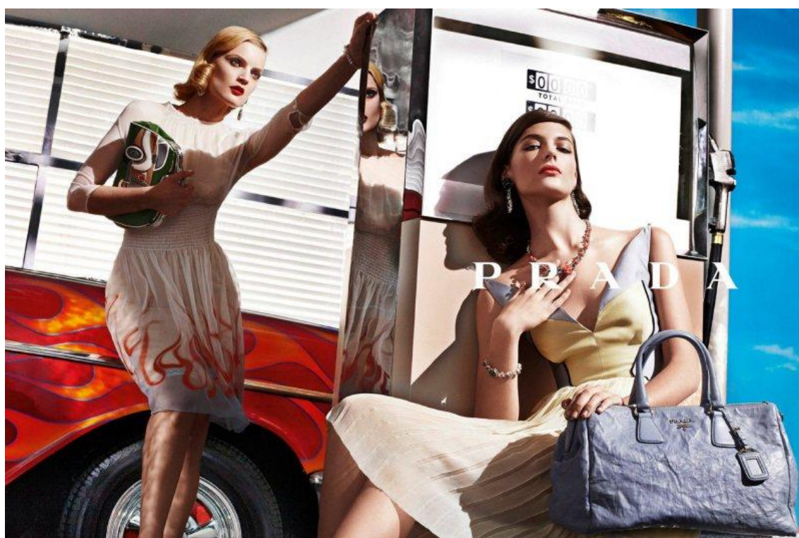
FIGURA 11 – Fotografia da coleção Primavera 2012, da marca Prada, que demonstra como as imagens auxiliam na criação dos conceitos das coleções

No mercado da moda, as imagens sempre foram essenciais e diretamente relacionadas aos sistemas que o regem, tais quais as coleções e os desfiles. Tanto por se tratar de um negócio mundial, quanto pela exclusividade inerente aos desfiles, por exemplo, a produção seriada de imagens auxilia este mercado na divulgação dos produtos e na criação dos conceitos relacionados a eles, inserindo as roupas em uma atmosfera que tanto a fotografia quanto o filme ajudam a criar (FIG. 11).