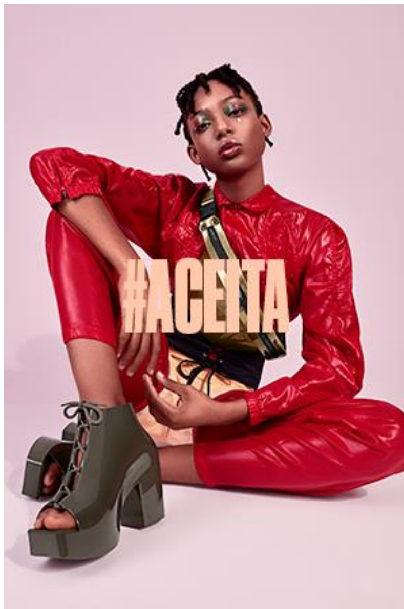
Figura 17 – Fotografia da coleção Flygrl, da Melissa

jovialidade, ação, ousadia, aventura e liberdade, contidas na prática do skate e da exploração dos espaços urbanos.