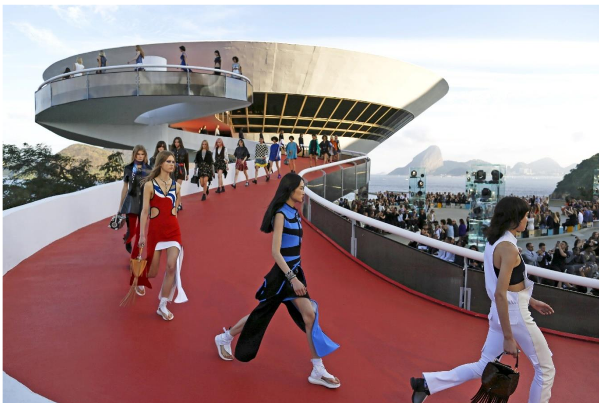
FIGURA 08 – Desfile da coleção cruise 2017, da marca Louis Vuitton, realizado no Museu de Arte Contemporânea de Niterói

O desfile de moda serve como um suporte do sistema de coleções e age enquanto facilitador dos códigos visuais e temáticos implícitos na coleção (RYBALOWSKI, 2011). Um desfile geralmente possui aspecto espetaculoso ou exagerado, que acaba por constituir uma narrativa e relatar a coleção de moda, além de demonstrar as maneiras e combinações de roupas imaginadas pelo estilista (FIG 08).