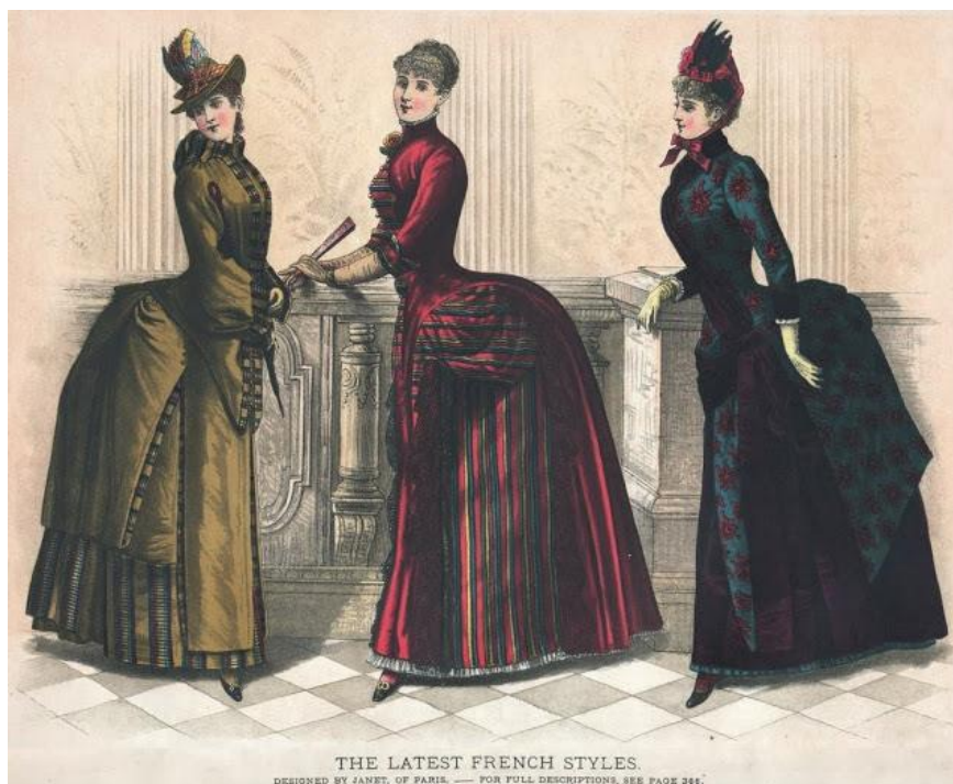
FIGURA 02 – Representação da moda feminina nos anos 1900

a criação das primeiras fábricas têxteis na Europa, que atendiam a algumas lojas de departamento (FIG. 02).