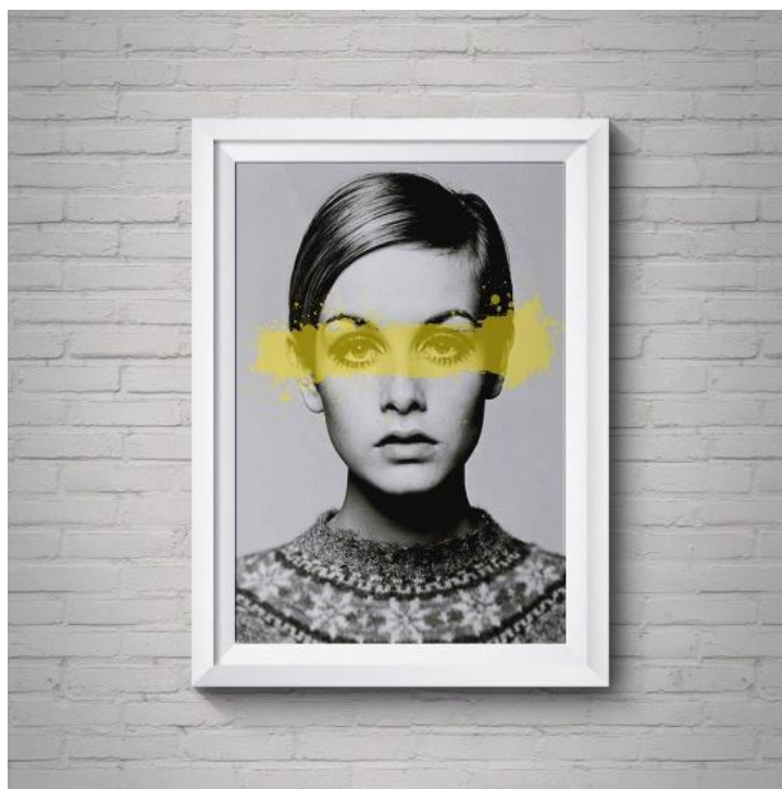
FIGURA 4 – Representação de Twiggy na arte pop atual