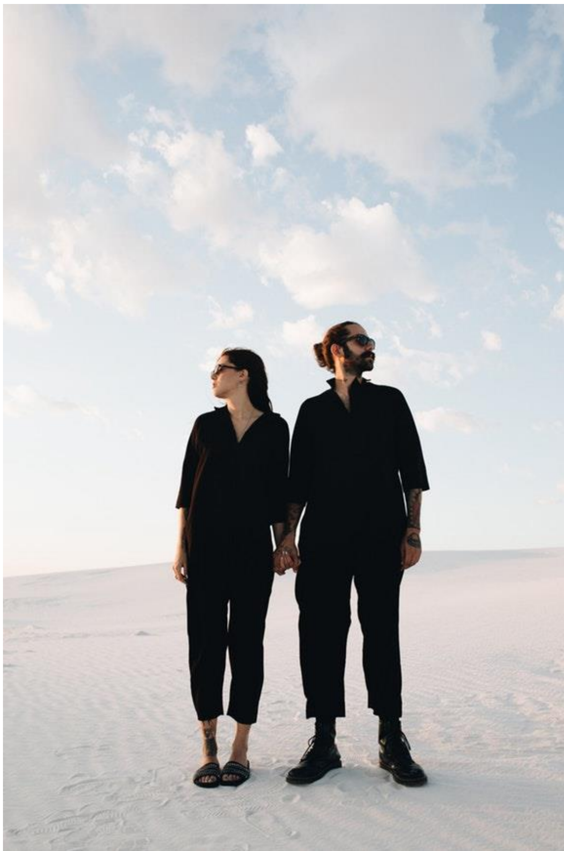
FIGURA 18 – Fotografia da sessão “básico na estrada”, do site da marca Basico.com