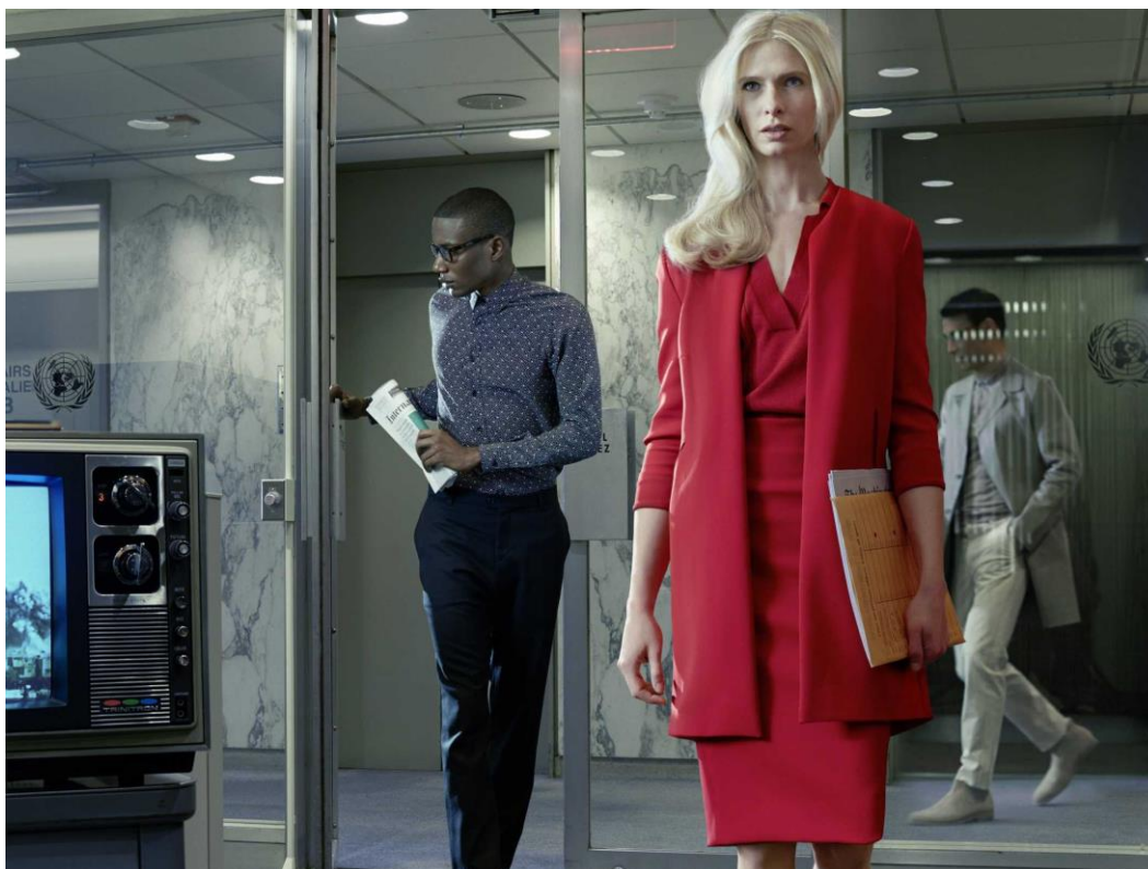
FIGURA 07 – Representação da vestimenta dos funcionários de um escritório

Para além dos códigos específicos de cada grupo, mas como fenômeno cultural, a moda é um determinado costume em vigor durante uma época. Ela é, sobretudo, um fator para se acompanhar as transformações das coletividades no tempo e no espaço (PALOMINO, 2002 4 apud STEFANI, 2005).