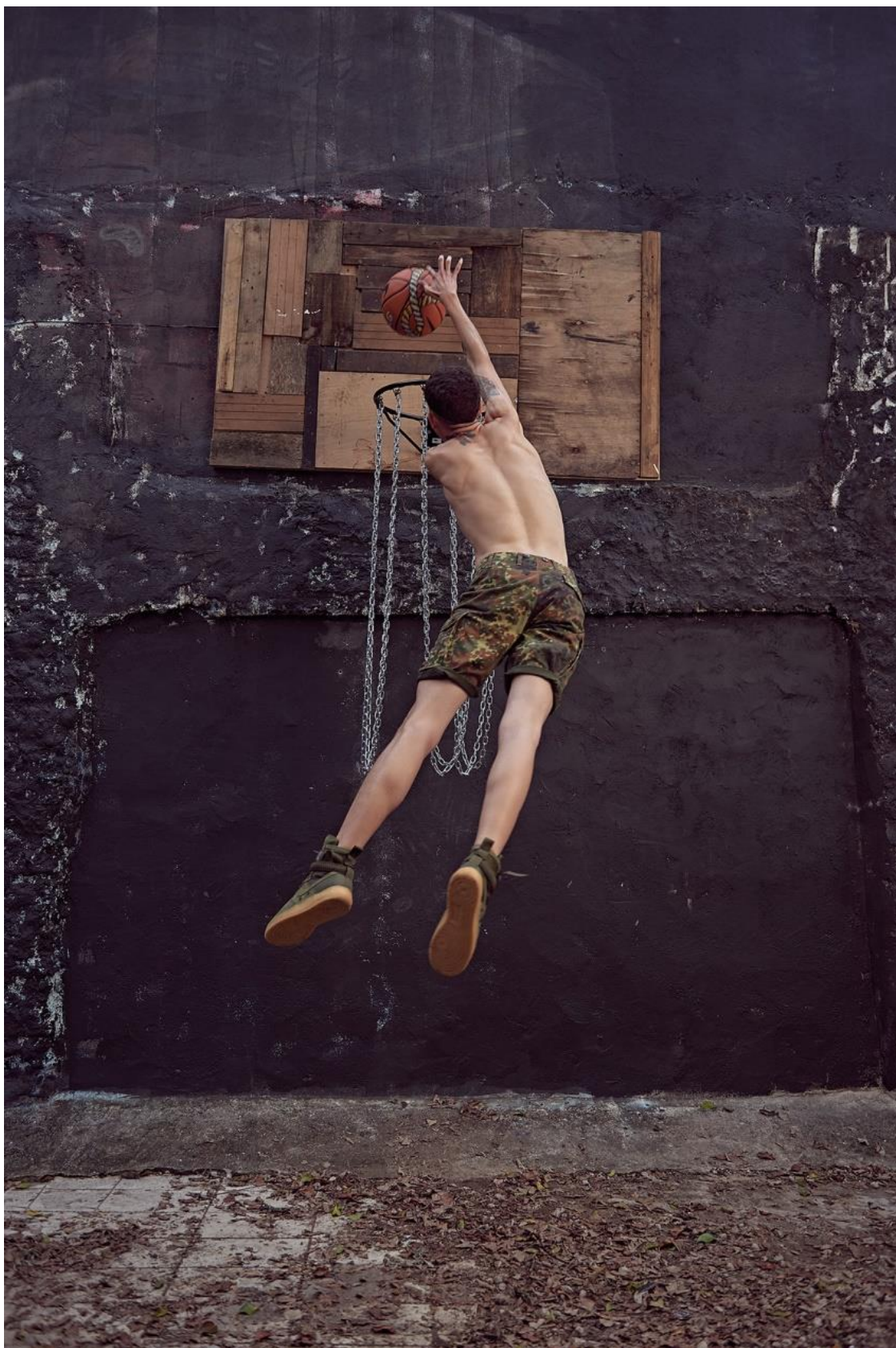
FIGURA 12 – Fotografia do editorial “Special Field Air Force 1”, da À La Garçonne