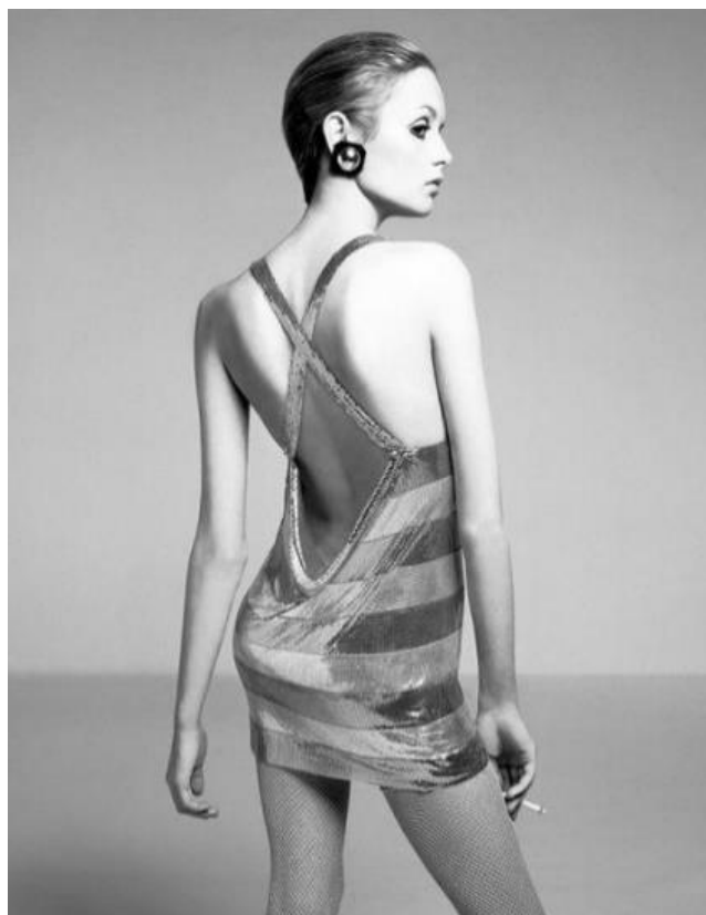
FIGURA 03 – Twiggy em um ensaio fotográfico na década de 1960