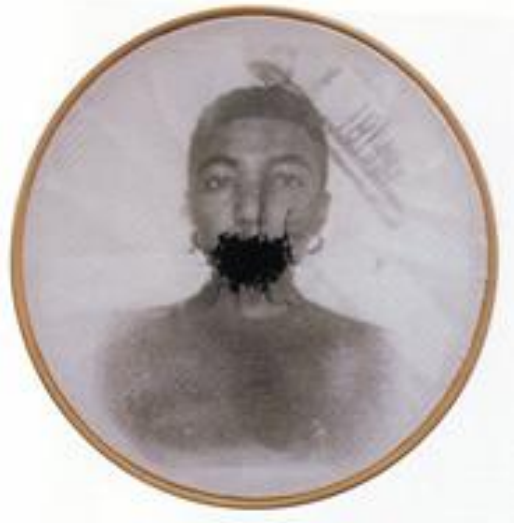
Figura 1 - PAULINO, R. Série Bastidores. 1997. Xerox transferido sobre tecido, com bordados. 31,3 cm x 31 x 1,1cm.

A imagem acima é a reprodução de uma obra da artista Rosana Paulino, onde esta procura denunciar a condição de muitas mulheres negras no Brasil, ou seja, a condição de submissão a uma sociedade que por vezes se apresenta como machista e racista. Na imagem, podemos ver o retrato de uma mulher negra com a boca costurada, indicando-a a ser levada ao silenciamento.