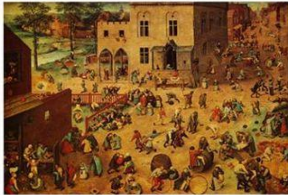
Figura 3 – Jogos Infantis, Pieter Bruegel, 1560.

Pensando-se que crianças brincam e sempre brincaram, buscamos por registros escritos que narram tal situação, como também registros visuais, como podemos ver na reprodução da obra “Jogos Infantis” de Pieter Bruegel, 1560. Nesta imagem do século XVI, podemos observar as crianças e adultos divertindo-se em espaço aberto através de várias brincadeiras, como rolar arcos, andar sobre tambores, dando cambalhotas e outras mais.