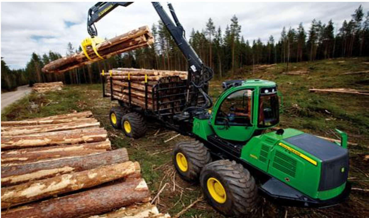
Figura 02: Forwarder John deere 1910E 8x8

De acordo com Machado (2008), originalmente fabricados no Canadá e aprimorados na Escandinávia, os forwarders , são máquinas, em sua maioria, articuladas, com suspensão da plataforma de carga sobre o chassi traseiro e capacidade de carga variando de 5.000 a 22.000 kg e potência que varia de 95 kW a 205 kW, além de uma grua hidráulica usada no carregamento e descarregamento da própria máquina, conforme mostra a Figura 02 a seguir. Projetados para serem utilizadas no sistema de toras curtas ( cut-to-length ), executam a extração de madeira da área de corte para a margem da estrada ou pátio intermediário. Para Forests and Rangelands (2011), estas máquinas podem trabalhar em terrenos acidentados até uma inclinação máxima ao redor de 30% a 40% desde que se movimente no sentido do declive. De acordo com Thees, Frutig e Fenner (2011) para reduzir os danos ao solo os forwarders passaram também a ser equipados com o guincho de tração auxiliar (GTA) que é acoplado ao chassi da máquina. O GTA permite a extração com forwarder em áreas declivosas onde a utilização de teleféricos resultaria em custos mais elevados, causando o mínimo de danos ao solo.