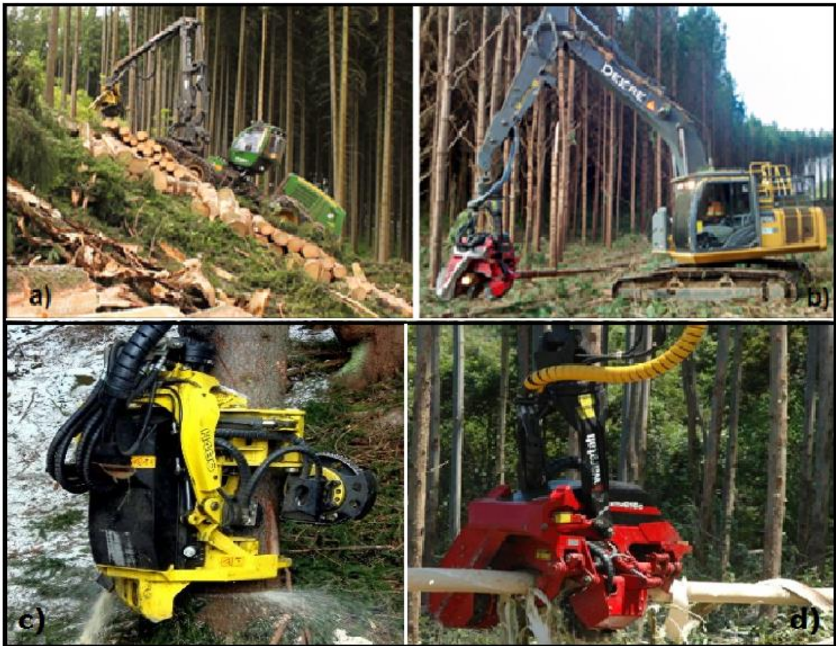
Figura 01: Os modelos de harvesters : (a) de rodas (b) de esteiras (c) cabeçote Waratah 480C (d) cabeçote Waratah 616C.

árvores de grande porte. Sua operação limita-se pela topografia em muitos casos. harvesters de esteiras podem trabalhar em terrenos com até 16° de declividade. Alguns modelos com chassi articulado de pneus, como exemplo o John Deere 1270E, pode operar em terrenos com até 30° de declividade, podendo utilizar acessórios (esteiras removíveis ou correntes) para recobrir os pneus. A seguir a Figura 01, ilustra os dois modelos mais comuns de harvester utilizados atualmente, o modelo sobre rodas e sobre esteiras, e ainda vemos em destaque os modelos de cabeçotes utilizados em cada máquina: