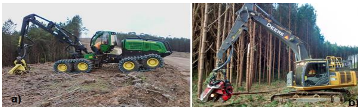
FIGURA 04 – a) Harvester com pneus 1270E e cabeçote Waratah 480C, b) Harvester Esteiras 210Ge cabeçote Waratah 616C