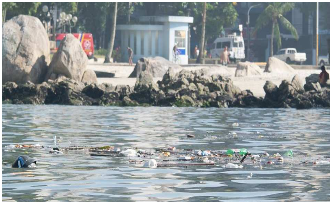
FIGURA 2 – Região costeira da Praia de Santos - SP em abril de 2016, na foto observa-se a incidência de resíduos sólidos.

A proporção de plásticos para outros tipos de resíduos no mar é maior devido a sua facilidade de transporte quando comparados a outros materiais mais densos como vidro e metal, e também pela sua maior durabilidade no ambiente, quando comparado a outros materiais menos densos como o papel.