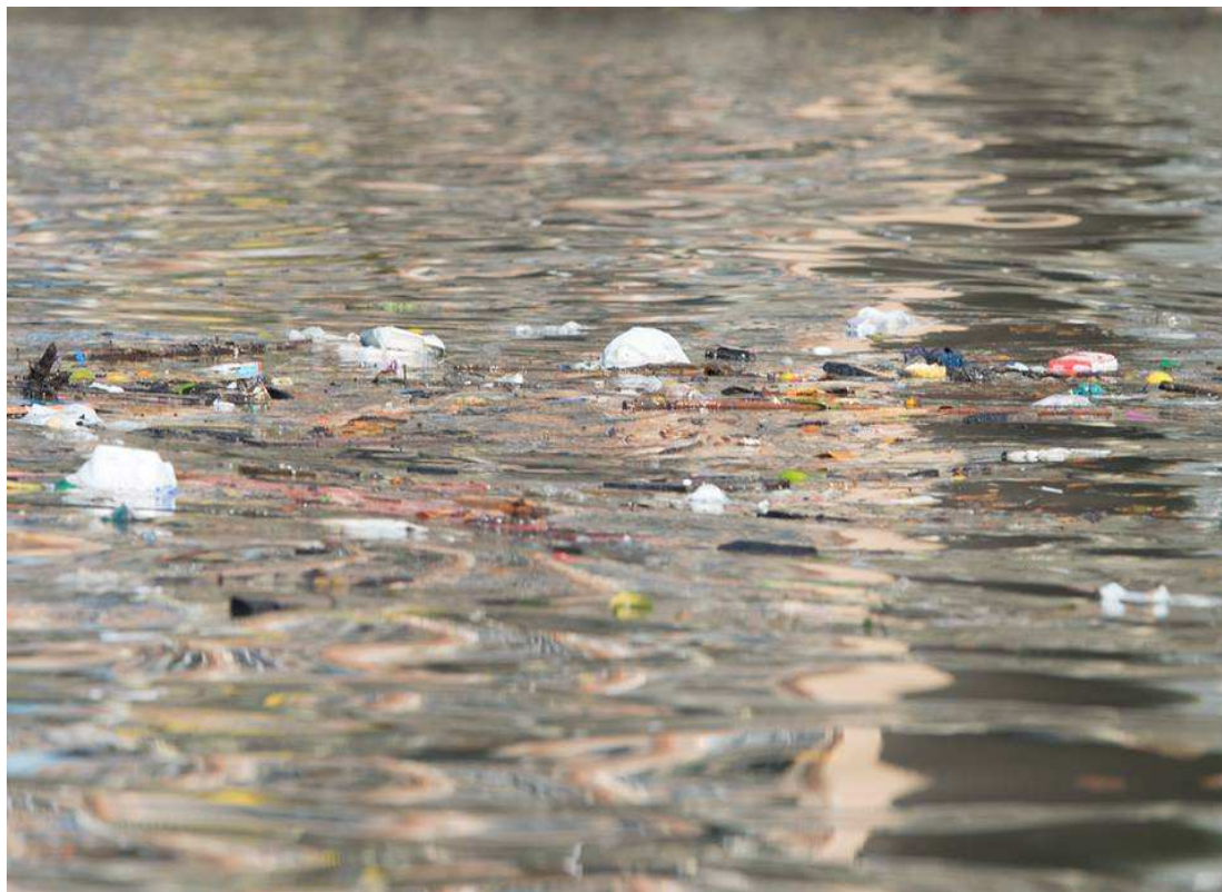
FIGURA 1 – Região costeira da Praia de Santos - SP em abril de 2016 com resíduos sólidos na superfície da água.

problema nas questões: ambiental, econômica, de saúde e estético ao redor do mundo. Itens de lixo marinho viajam livremente pelos oceanos (Figura 1).