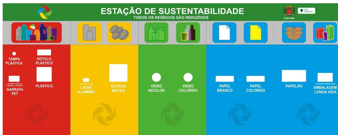
FIGURA - 1 FRENTE DA ESTAÇÃO DA SUSTENTABILIDADE TIPO I