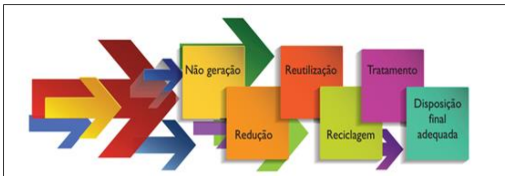
FIGURA 2 - HIERARQUIA DAS AÇÕES DE MANEJO DE RESÍDUOS SÓLIDOS