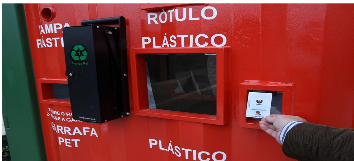
FIGURA 4 - LEITOR DE CARTÃO TRANSPORTE DA ESTAÇÃO DA SUSTENTABILIDADE BAIRRO GUABIROTUBA