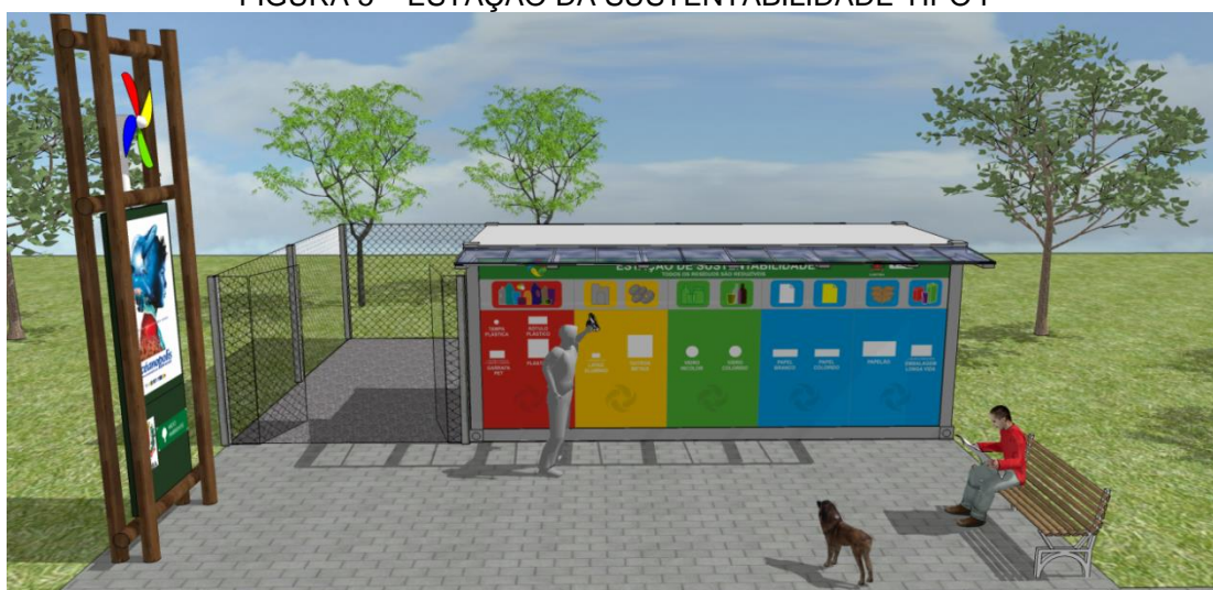
FIGURA 5 – ESTAÇÃO DA SUSTENTABILIDADE TIPO I