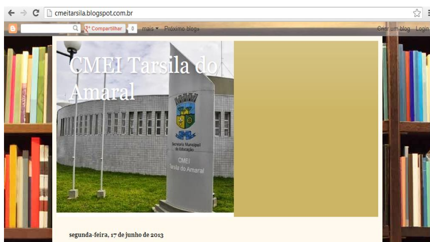
Figura 1: Visualização do blog

endereços eletrônicos em pesquisas realizadas no decorrer do presente estudo. A saber, o endereço do blog é: cmeitarsila.blogspot.com.br .