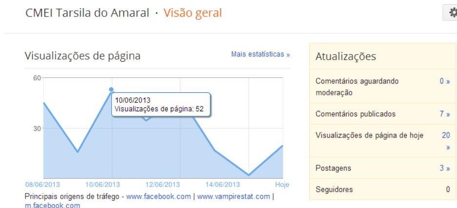
Figura 3: Imagem dos acessos ao Blog 01

Na semana que compreendeu os dias entre dez de junho até quatorze de junho de 2013, houve 153 visualizações no blog, contudo, apenas 07 publicações. Na data de dez de junho, o blog chegou ao ápice de visualizações, contado com 52, conforme demonstra a figura a seguir: