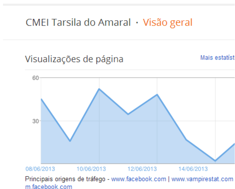
Figura 4: Imagem dos acessos ao Blog 02

Na imagem a seguir, é possível observar o panorama de visualizações do blog durante seis dias.