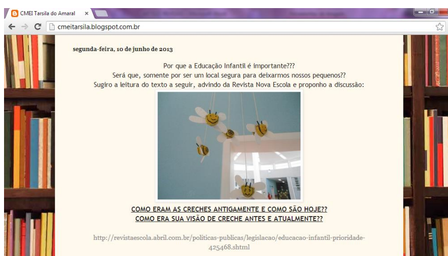
Figura 2: Visualização de postagem no Blog

O primeiro post do blog já levantou discussão, mesmo que de forma involuntária. Na postagem houve uma apresentação da unidade escolar, contando detalhes no que tange a quantidade de profissionais que ali atuam, número de crianças atendidas e faixa etária dos atendidos.