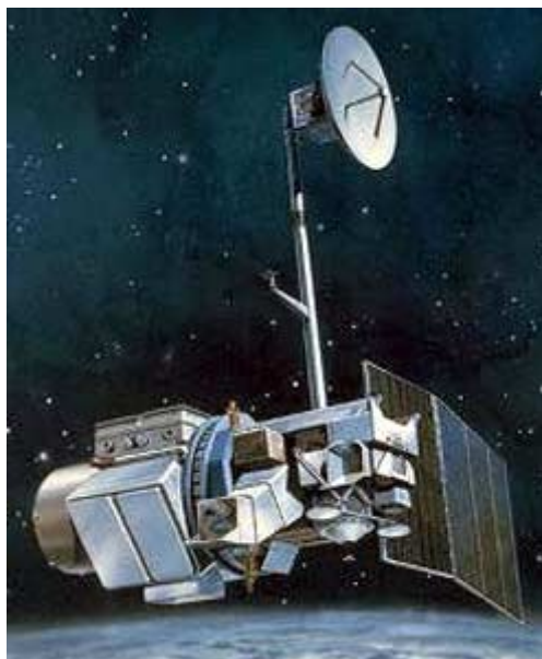
FIGURA 1 – SATÉLITE LANDSAT 5