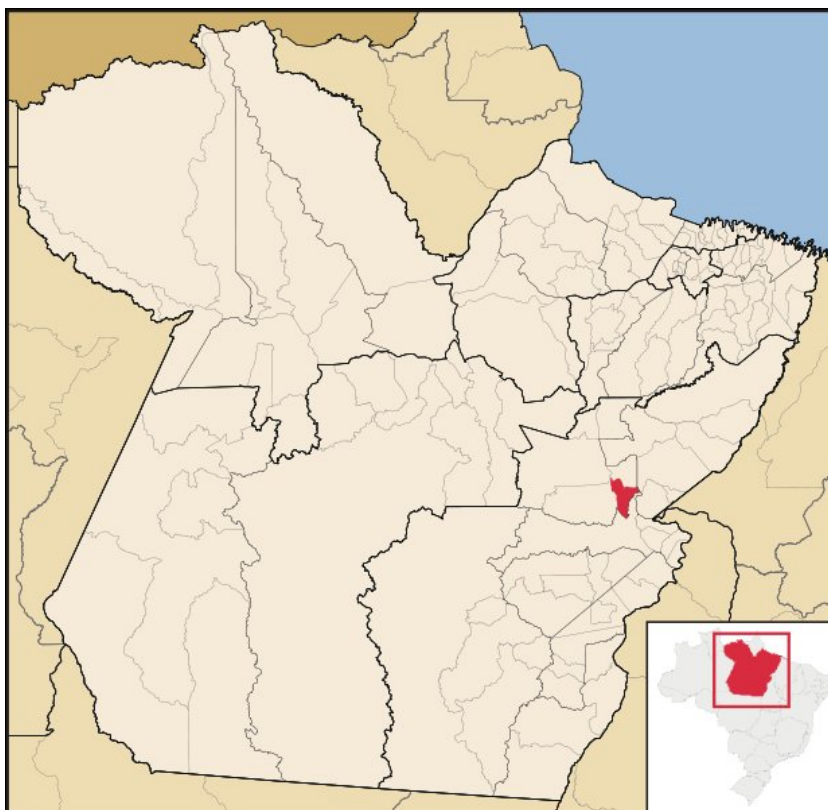
FIGURA 2 – LOCALIZAÇÃO DO MUNICÍPIO DE NOVA IPIXUNA NO ESTADO DO PARÁ.

A área estudada é uma propriedade rural denominada de Fazenda Fortaleza, com área de 918,48 ha, situada no Município de Nova Ipixuna - PA (Figura 2), Estado do Pará.