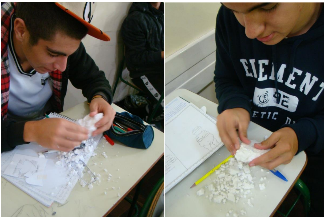
FIGURA: ALUNOS ESCULPINDO A VÊNUS DE WILLENDORF NO ISOPOR