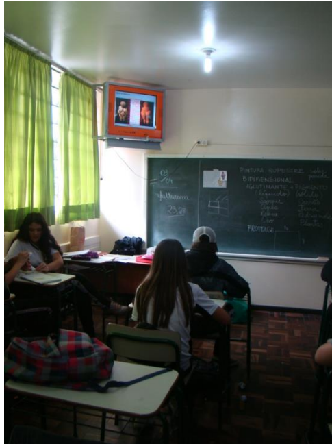
FIGURA:ALUNOS OBSERVANDO A OBRA DE ÂNGULOS DIFERENTES

Num segundo momento foi realizada uma leitura interpretativa (durante esta leitura foi possível a cada aluno colocar o que pensava sobre a obra que estava vendo, pois cada ser humano percebe, vê e sente uma obra de Arte de acordo com sua história de vida, com o que já sabe e conhece sobre arte).