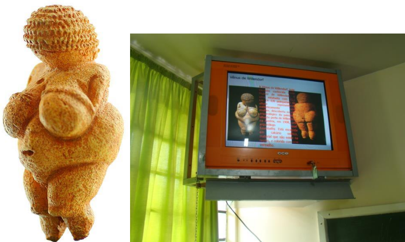
FIGURA 2 : VÊNUS DE WILLENDORF NA TV PEN-DRIVE

Este estudo foi aplicado em 15 alunos do 1º ano do Ensino Médio (“D”) por meio de uma leitura da obra pré-histórica Vênus de Willendorf, na qual observou-se os elementos que a compõem, formam a obra, ou seja, os elementos expressivos, como a linha, a cor, o volume e a perspectiva.