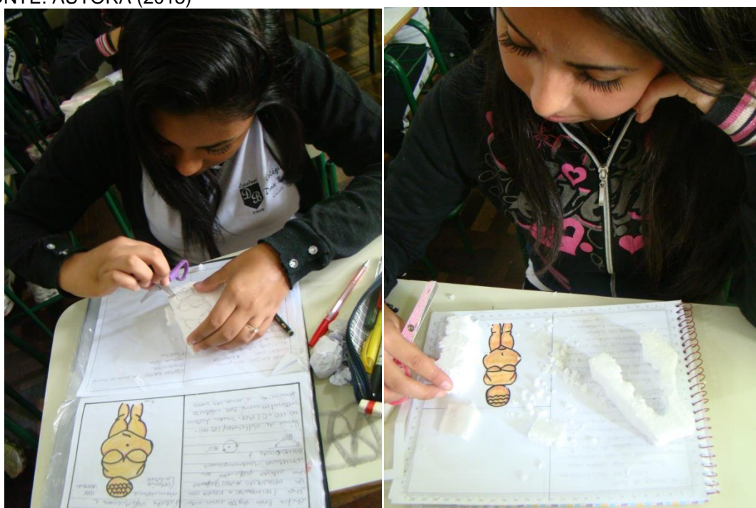
FIGURA: ALUNOS ESCULPINDO A VÊNUS DE WILLENDORF NO ISOPOR

O desenvolvimento da metodologia deste trabalho baseia-se no planejar e projetar. Este projeto de pesquisa tem como característica a observação, entendimento, contextualização de uma obra de arte específica da história da arte.