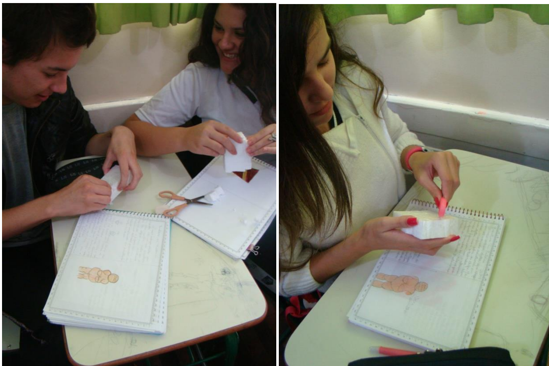
FIGURA: ALUNOS ESCULPINDO A VÊNUS DE WILLENDORF NO ISOPOR