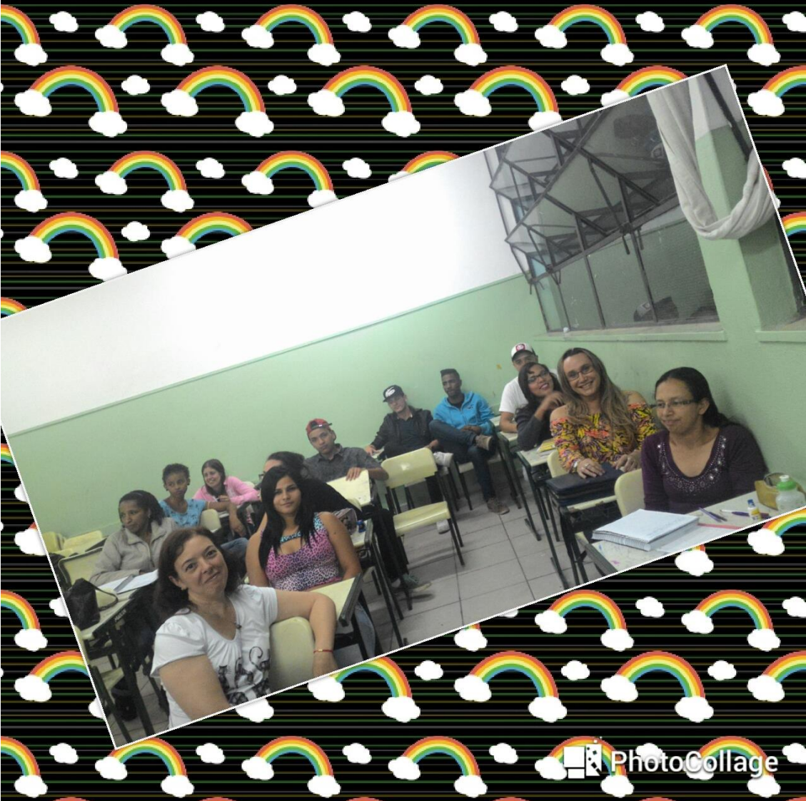
Anexo 3: Foto