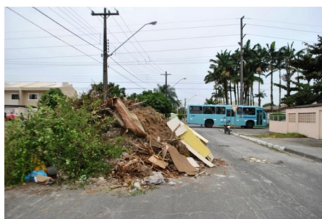
Figura 1 Lixo depositado em via pública

Em 2014 a Secretaria do Meio Ambiente (SEMMA) começou um trabalho de notificação dos proprietários de terrenos que servem como área de descarte e armazenamento de lixo ou que jogam lixo em via pública, sob pena de multa aos que não resolverem o problema, conforme matéria publicada em 06 de maio de 2014 no site da Prefeitura Municipal. Mesmo com essas ações os resultados são insipientes. Conforme a matéria, moradores alegam que assim agem porque veem outros moradores agindo da mesma forma. Atitude que aponta a necessidade de campanhas de sensibilização. (FIGURA 1)