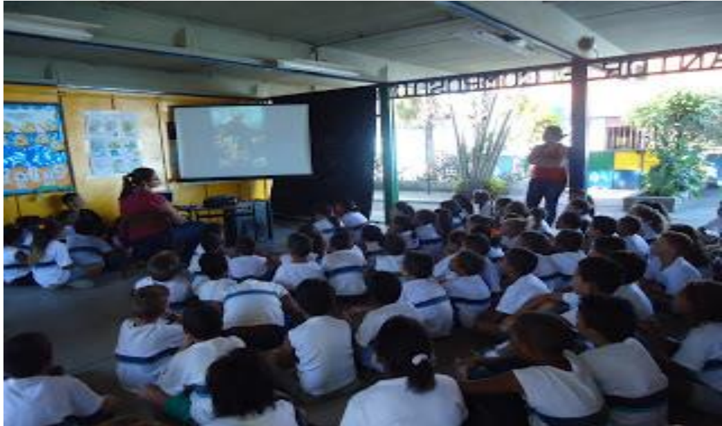
Figura 2: Vídeos sobre Valores

Alguns resultados dessa prática foram que tantos professores que acompanharam a turma na atividade, como estudantes ficam sensibilizados e brota o sentimento da compaixão e a discussão é muito rica e há uma construção coletiva dos valores. Esta é uma dinâmica que os professores gostaram muito e sugeriram que a equipe pedagógica continue aprimorando e repetindo sempre.