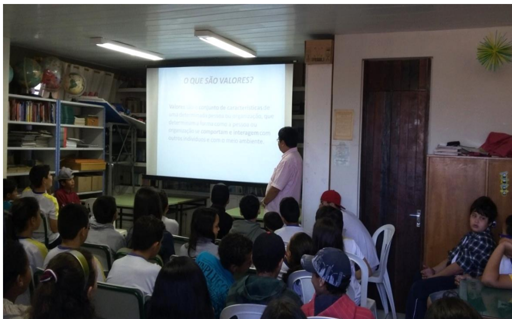
Figura 1: Palestra sobre Valores

É sempre interessante quando lideranças da comunidade se dispõem a fazer esse tipo de trabalho com os alunos. Eles demonstram o devido respeito na medida em que o palestrante passa credibilidade aos alunos que conseguem ouvir com atenção e interagir, dessa forma, pouco a pouco vai-se contribuindo para a formação do caráter dos alunos.