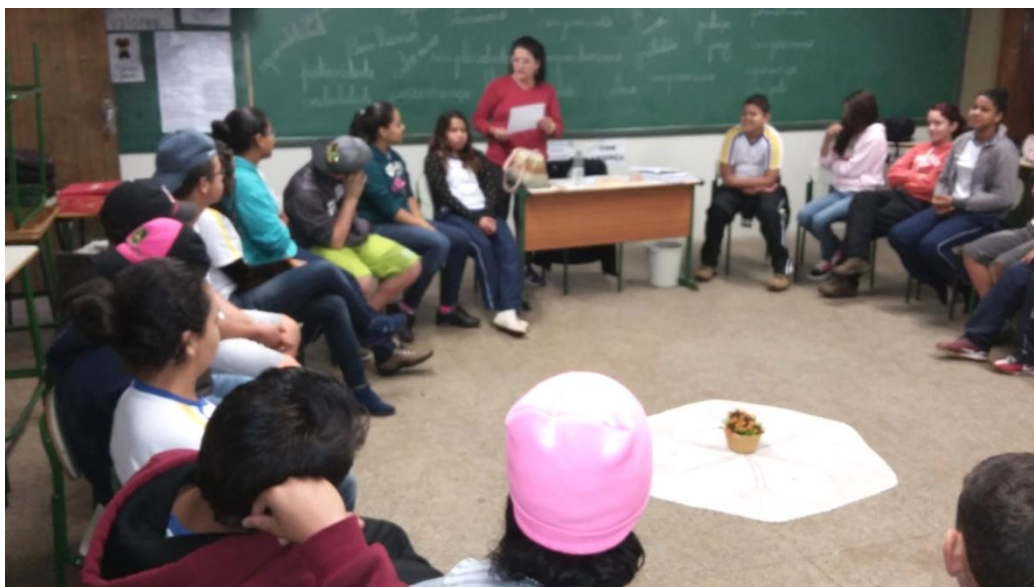
Figura 4: Círculo de construção de paz

palavra, escolhido pelo mediador passa de mão em mão e só fala naquele momento quem estiver com o objeto da palavra em mãos, de forma que os alunos já vão exercitando o valor do saber ouvir. O aluno que segura o objeto da palavra tem o empoderamento, pois naquele momento ninguém fala, somente ouve o que ele tem a dizer. Caso não queira falar, passa o objeto da palavra ao aluno seguinte. Ao final faz-se uma rodada denominada check-in na qual cada aluno pode dizer como está se sentindo, depois o professor facilitador faz o encerramento (Figura 4).