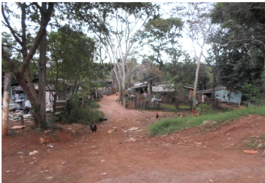
FIGURA 3 – FOTO BAIRRO PORTO MEIRA – BUBAS

O critério para a seleção das famílias são os vínculos fragilizados em vias de perder o cuidado parental em vista de acolhimento institucional. O comprometimento com a promoção e defesa de direitos da criança e do adolescente em situação de vulnerabilidade pessoal e social.