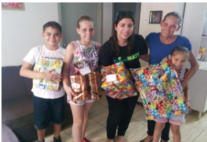
FOTO 2 – FAMILIAS PARTICIPANTES DO PROJETO