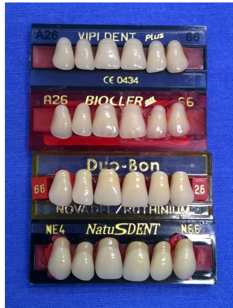
Fig. 1 - Dentes artificiais

Para a realização desta pesquisa foram selecionados 4 marcas comerciais de dentes artificiais de resina acrílica, Duo Bom, NatuSdent, Vipi dent plus e Biocler G II (figura 1). As leituras foram realizadas em tempo inicial t_0=10h30 minutos , T_1=14:30 minutos e T_2=18:30 minutos . As leituras foram feitas uma vez em cada corpo-de-prova no fundo branco ,mensurada com o aparelho espectrofotômetro (VITA Easyshade - figura 2).