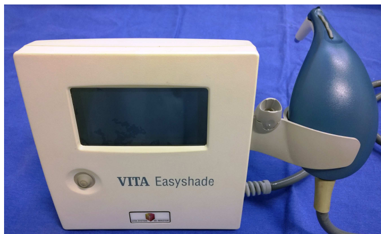
Fig. 2. Aparelho espectrofotômetro - Vita Easyshade

Em seguida foi realizada uma nova leitura em cada corpo-de-prova no fundo branco com a Lâmpada de LED. (SHADE MATCHING LIGHT) e o aparelho espectrofotômetro (figura 3). De cada marca comercial , foram utilizados um incisivo central superior esquerdo (cor 66) ,cuja face vestibular foram avaliadas quanto à cor. Esses dentes foram selecionados por apresentarem maior superfície vestibular em