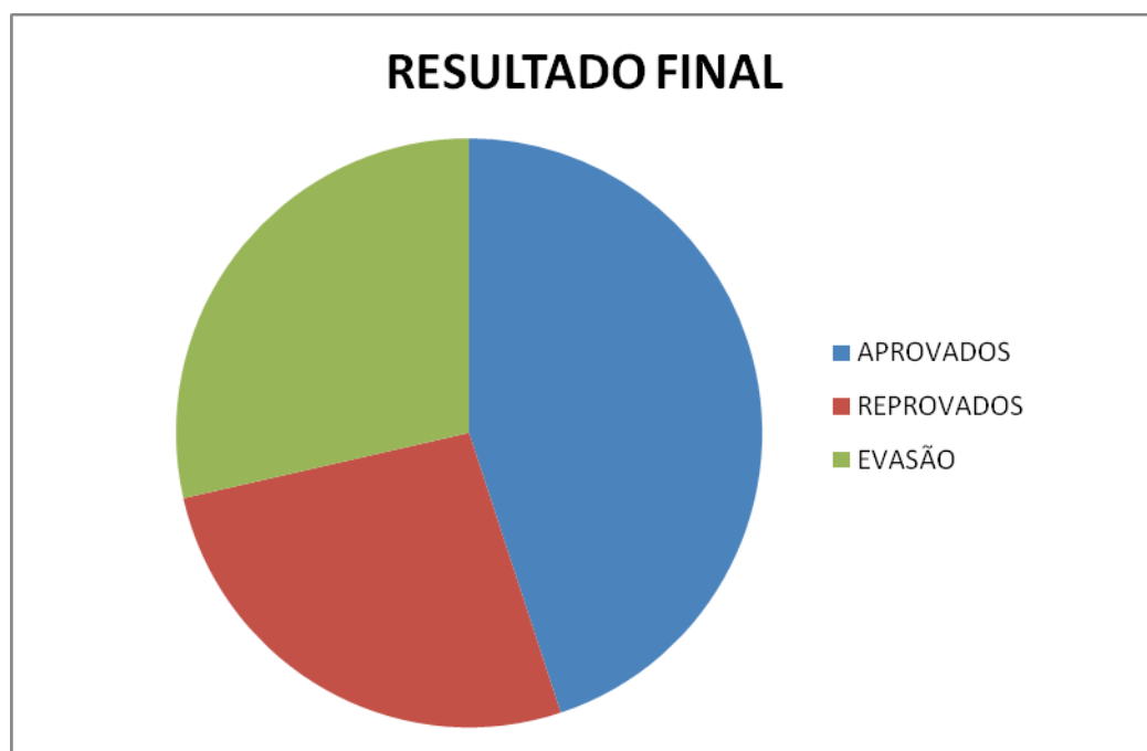
GRÁFICO 2: RESULTADO FINAL

registrados todos os dados dos alunos, desde o endereço até sobre sua condição sócia econômica, se constatou o grande índice de reprovação, principalmente nas séries do 4º e 5º ano. Em uma determinada turma, com um total de 36 alunos matriculados, somente 17 obtiveram aprovação e o restante ou são alunos reprovados ou desistentes (GRÁFICO 2). Para melhor compreensão, a situação está demonstrada pelo gráfico a seguir: