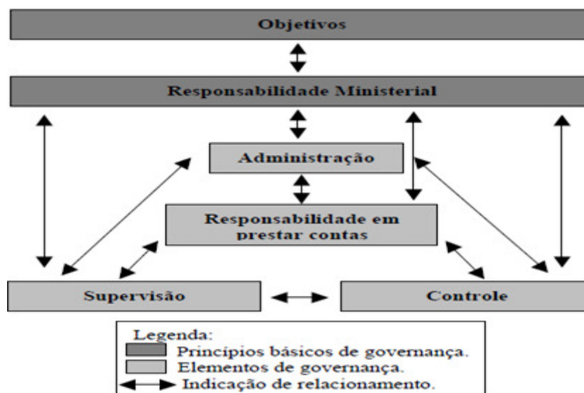
Figura 2 - Estrutura de Governança Governamental