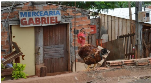
FIGURA 4 UNIÃO DA VITÓRIA I FONTE:O AUTOR, 2014

O Bairro localiza-se na região sul de Londrina e é marcado pelo baixo prestígio social em comparação ao restante da cidade, abriga boa parte da população negra da cidade, não há infraestrutura adequada, não há facilidades para que ocorram o acesso pertinentes a utilização dos bens e serviços que a cidade possa oferecer por conta ainda da distancia que este bairro está do centro da cidade. O Bairro ainda conta com um alto índice de criminalidade o que foi necessário implantar a primeira UPS (Unidade Paraná Seguro) da cidade (SOUZA, 2014, p 61).