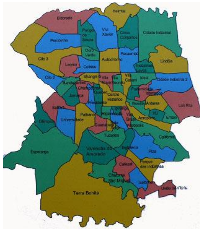
FIGURA 2 MAPA DE ORGANIZAÇÃO DOS BAIRROS DE LONDRINA