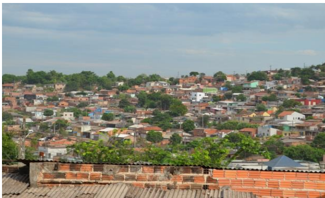
FIGURA 3 UNIÃO DA VITÓRIA I FONTE:O AUTOR, 2014

Trata se de uma localidade onde as pessoas vivem de forma precária em um território íngreme, onde em alguns trechos tem ruas de terra, outros apenas caminhos improvisados em meio a matagais, moradias precárias, esgotos cruzam ruas e animais soltos dão um toque único ao lugar.