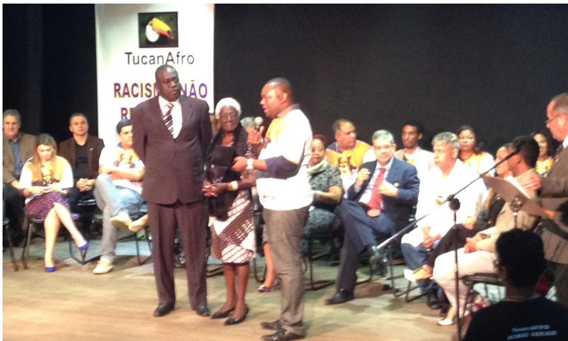
FIGURA 06 - Recebendo o Prêmio Zumbi dos Palmares em Belo Horizonte, EM 2013 (ao centro).