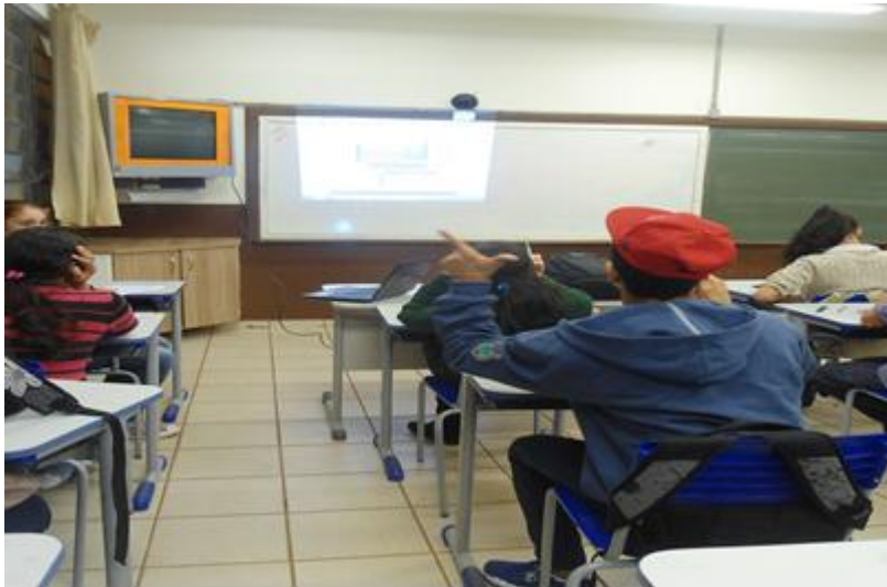
Figura 02 Alunos observando e discutindo a Tabela Periódica projetada no quadro.

A imagem inserida abaixo permite evidenciar a ocorrência da aula e o interesse despertado nos educandos pela aprendizagem e análise da tabela periódica a partir da utilização dos recursos audiovisuais: