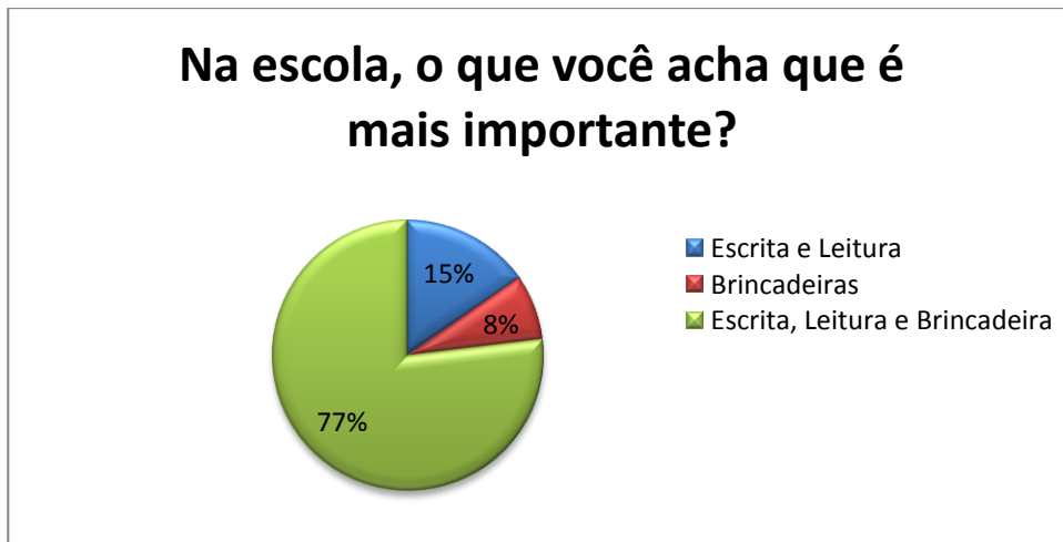
Gráfico 3 – Importância dada aos saberes escolares na escola

No terceiro gráfico sintetizamos o conteúdo das respostas obtidas, observando que 77% acreditam que tanto a escrita e leitura quanto as brincadeiras são importantes na escola. Já 15% consideram a escrita e a leitura, e aparece na última posição com 8% a importância que é dada pelos pais e/ou responsáveis para as brincadeiras.