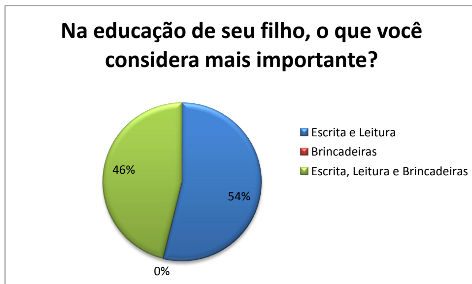
Gráfico 2 - Importância dada pela família entre os saberes escolares

De acordo com o segundo questionamento verifica-se que 54% consideram que a escrita e a leitura são mais importantes na educação, analisa-se também que