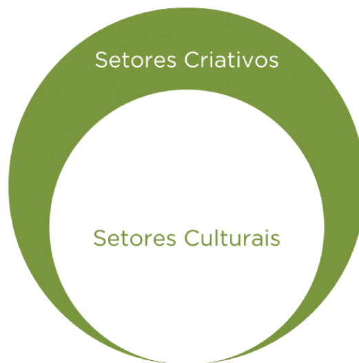
Figura1. Setores Criativos – a ampliação dos setores culturais

A Secretaria de Economia Criativa apresentou um Plano com políticas, diretrizes e ações que serão desenvolvidas entre o período de 2011 a 2014. O primeiro passo foi ampliar o entendimento de quais setores estarão contidos neste Plano, conforme figura abaixo: