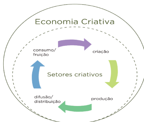
FIGURA 2: A Economia Criativa e a dinâmica de funcionamento dos seus elos

distribuição e consumo de bens oriundos dos setores classificados como criativos, conforme exemplificado na Figura 2.