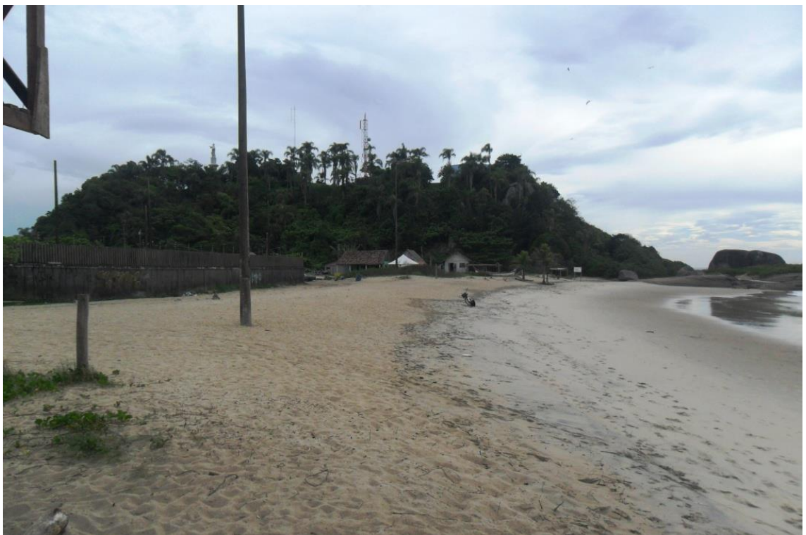
Figura 09: Praia Brejatuba, Guaratuba, 2014