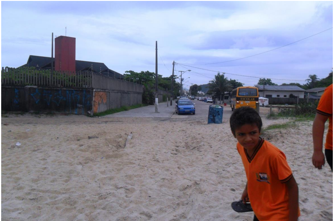
Figura 16: Imóveis construídos invadindo a praia Brava, Guaratuba, 2014