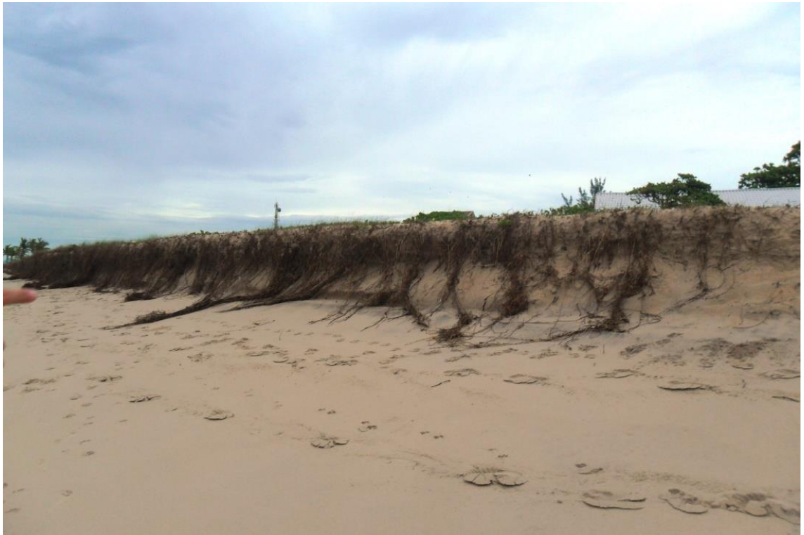
Figura 12: Erosão e Restingas da Praia Brava, Guaratuba, 2014