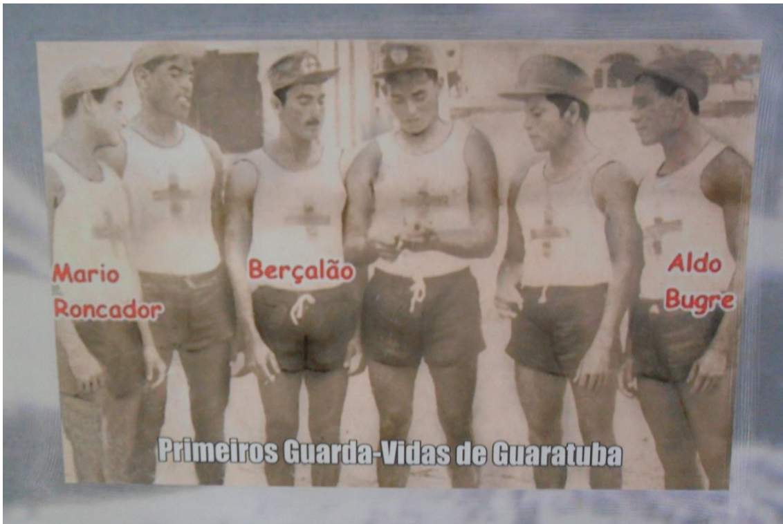
Figura 01 - Avô da Camila, Bersalão- Praia Central de Guaratuba, 1957