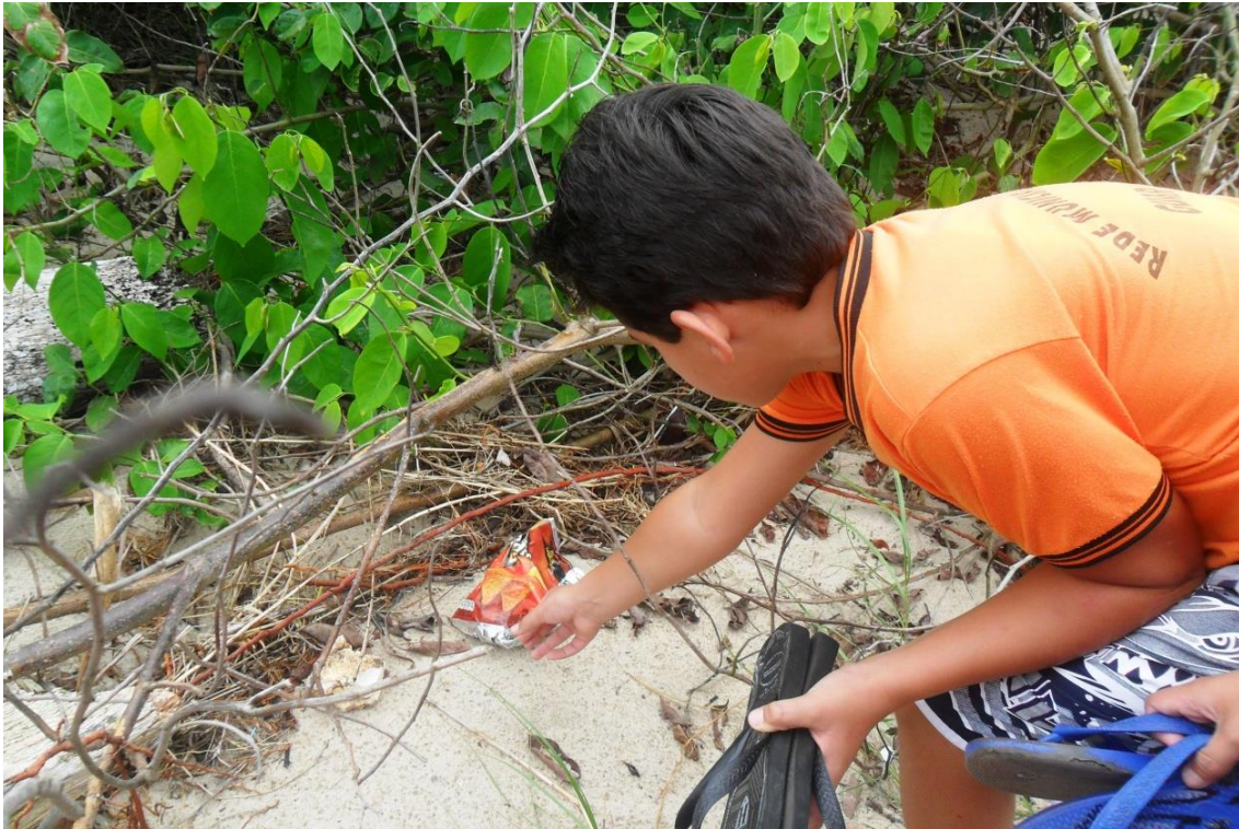
Figura 07: Praia Brejatuba, Guaratuba, retirada de lixo das restingas, 2014

No passeio foram realizadas as explicações e os alunos cada vez mais interessados iam fazendo perguntas e assim percebi que a intervenção estava sendo profícua e que estava dando resultados.