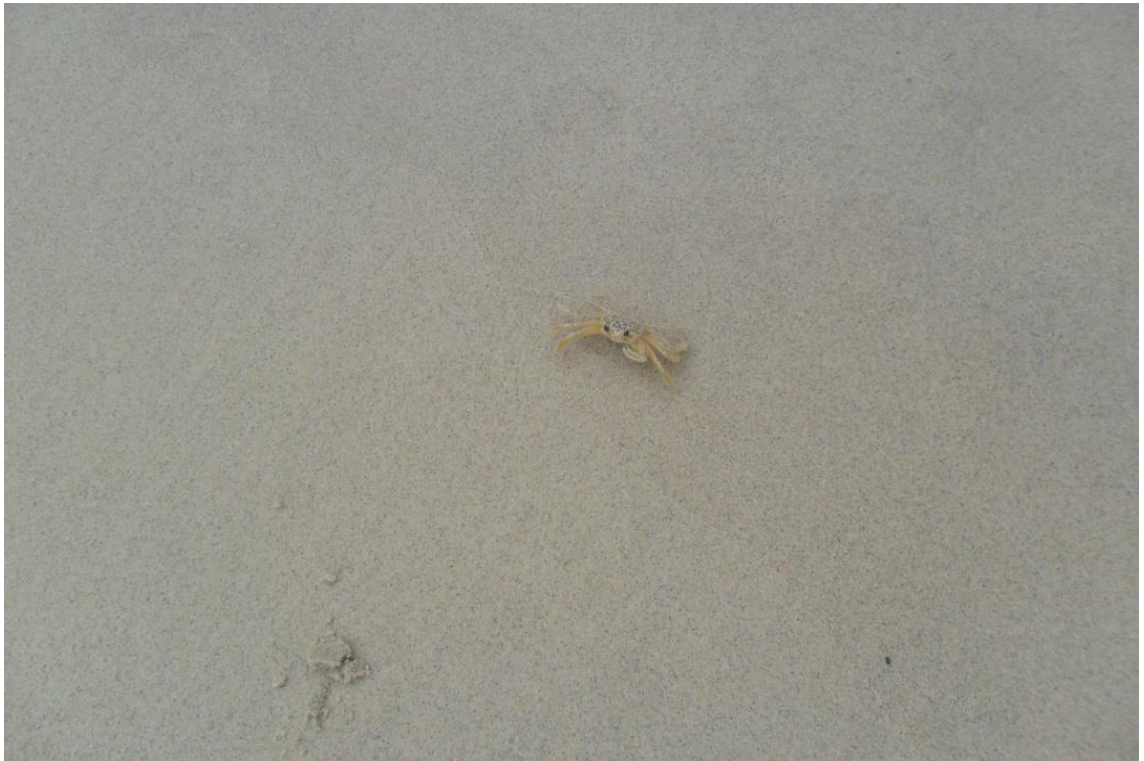
Figura 14: Garuçá ( em extinção) Guaratuba, 2014