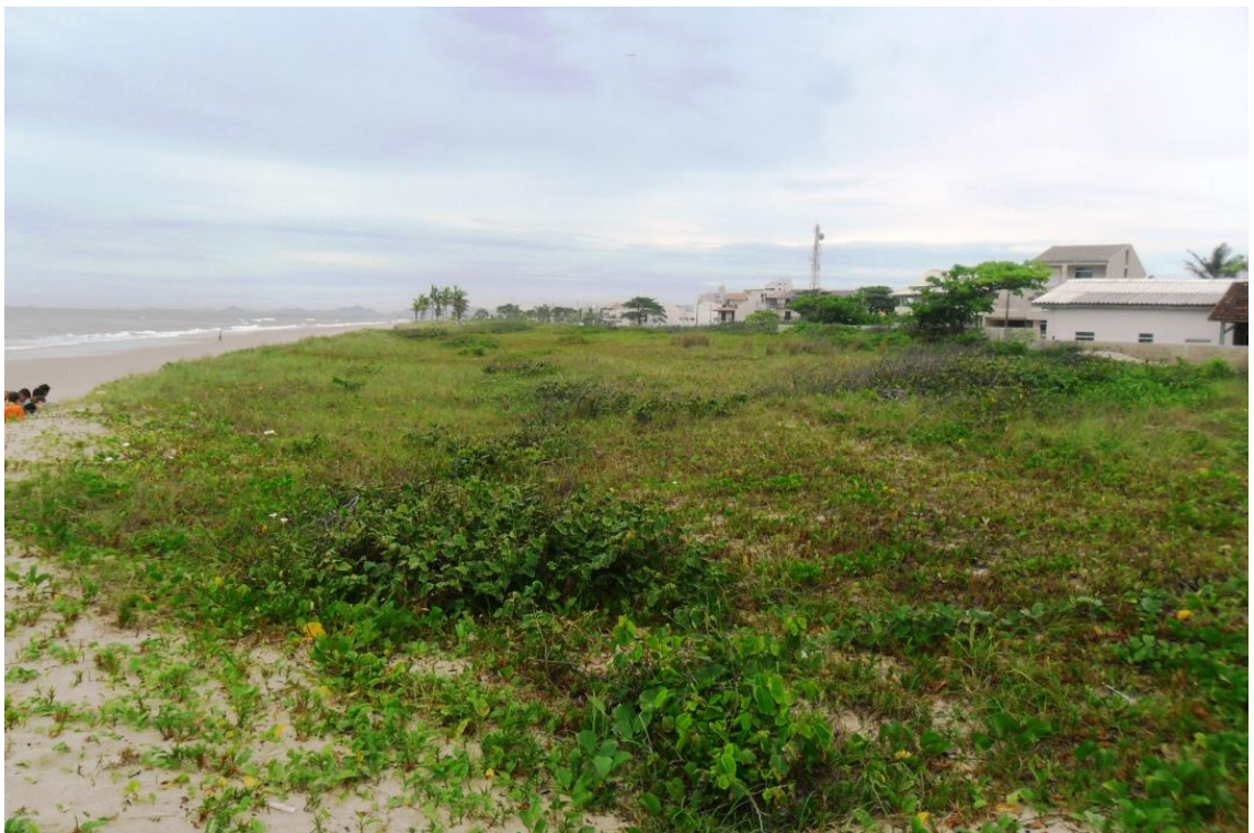
Figura 11: Restingas a Praia Brava, Guaratuba, 2014