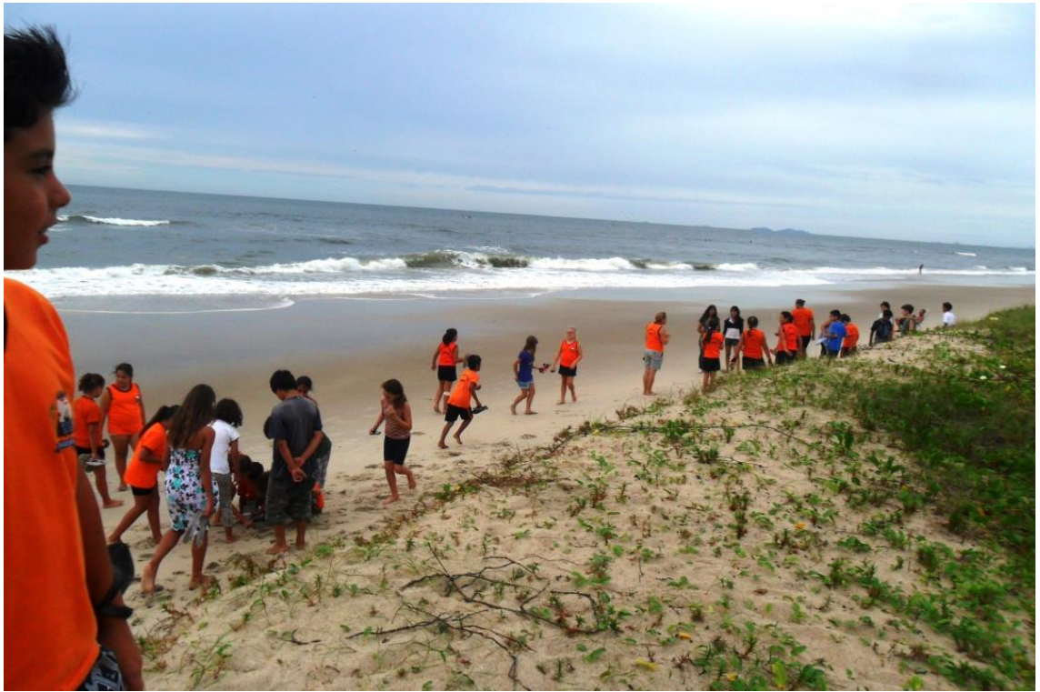
Figura 10: Alunos na Praia Brava, Guaratuba, 2014