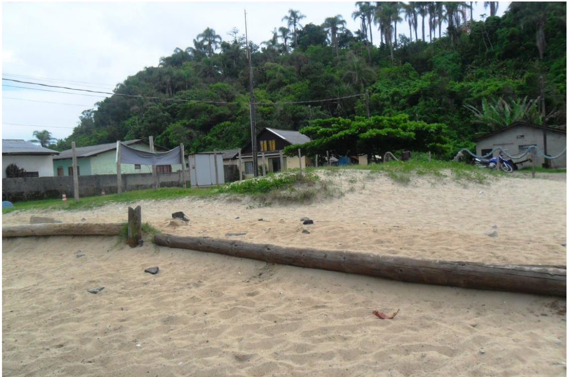
Figura 08: Praia Brejatuba, Guaratuba, casa de moradores nativos, 2014