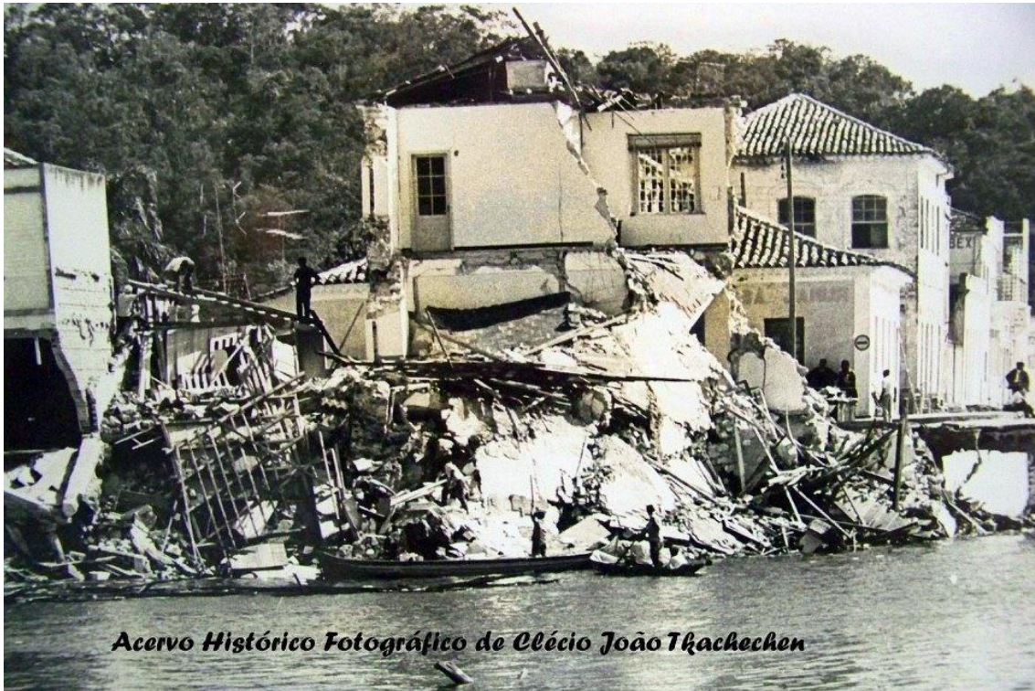
Figura 06: Desastre da queda da baía de Guaratuba, 1968