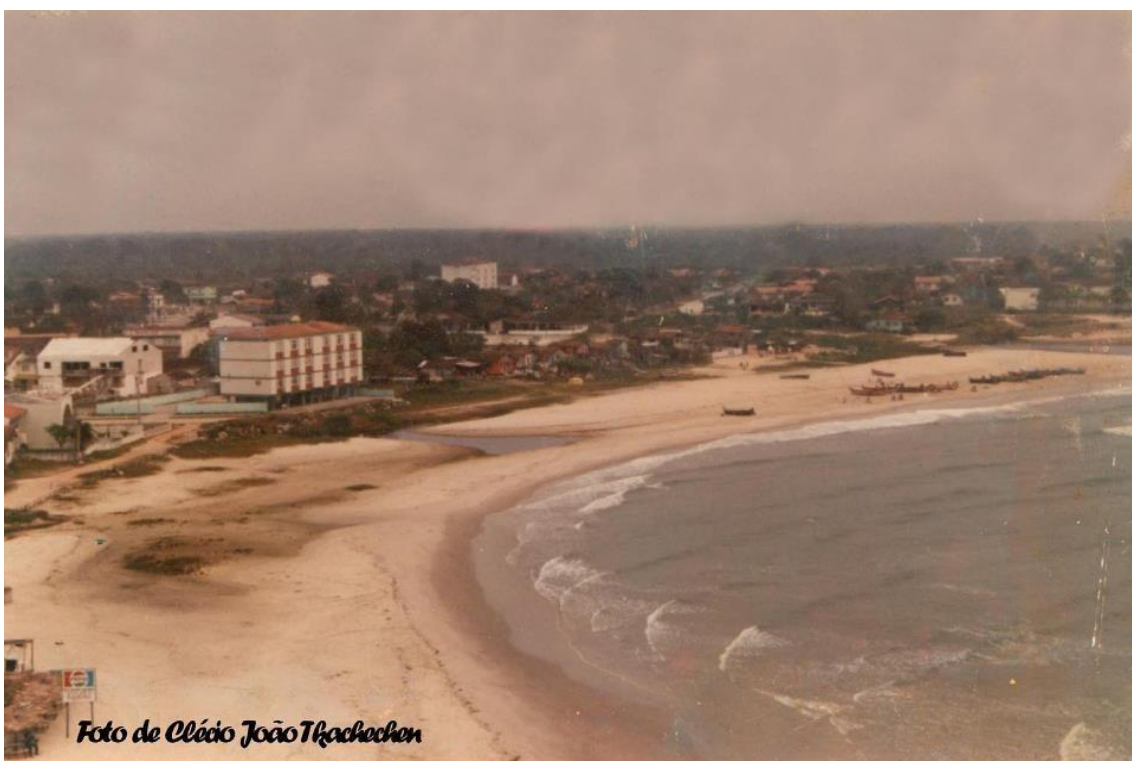
Figura 05: Praia Central de Guaratuba, 1982