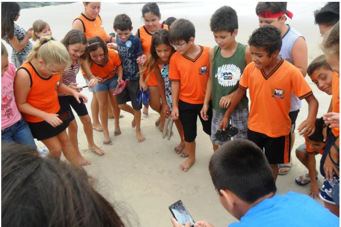
Figura 13: Restingas a Praia Brava, alunos observando Garuçá ( em extinção) Guaratuba, 2014