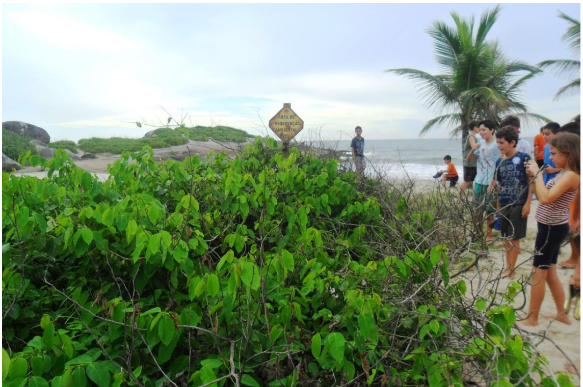
Figura 15: Restingas da Praia Brava, Guaratuba, 2014