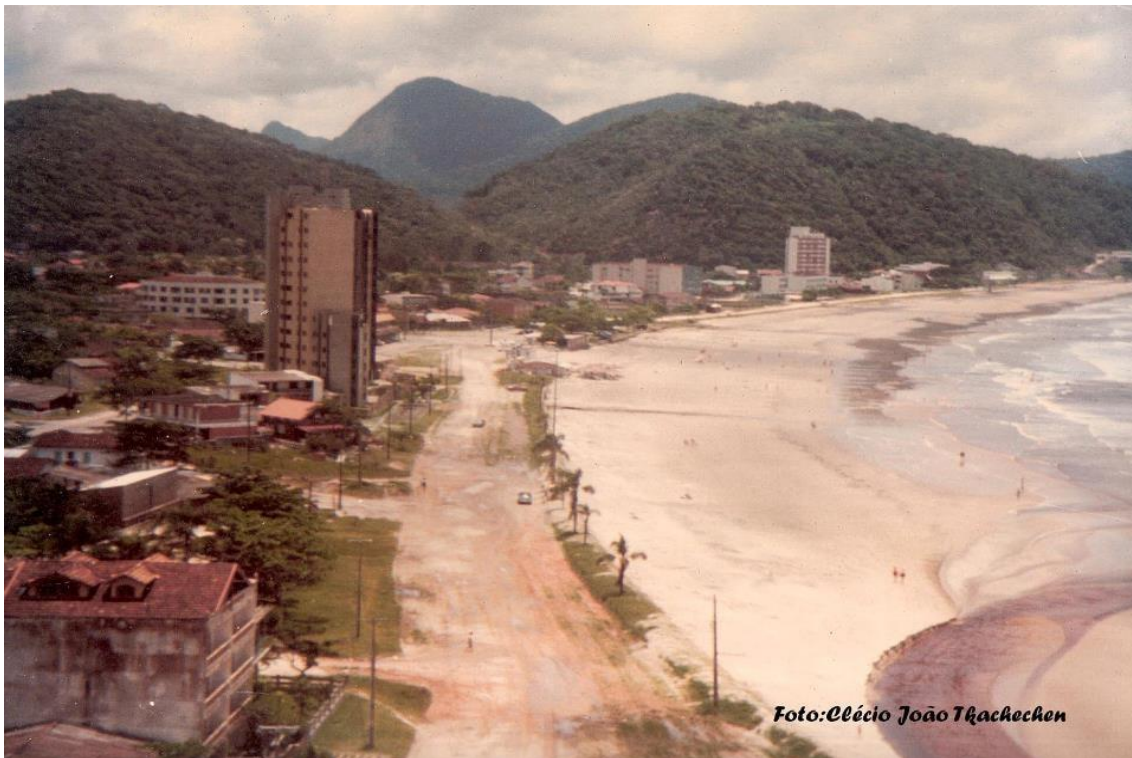
Figura 04: Praia Central de Guaratuba, 1982