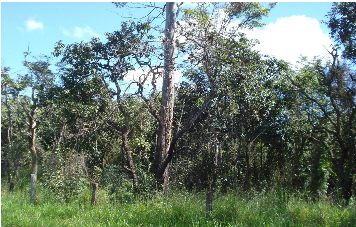
Figura 1. Cerrado na área do Bairro Laranja Azeda, em Pirassununga/SP FONTE: Dados de pesquisa in loco , 2012.