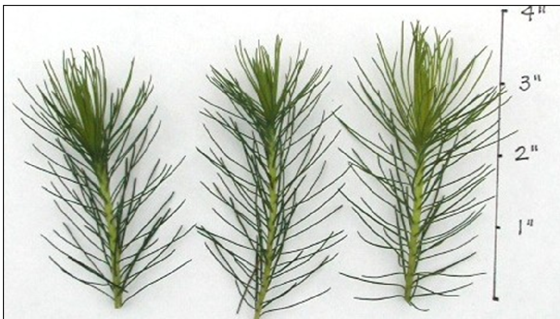
FIGURA 1: PADRÃO DE ESTACAS SELECIONADAS PARA COLETA

As cepas produziram, em média, dois ramos plantáveis por coleta. Sendo assim, foram coletados ao final das quatro colheitas um total de 480 estacas (60 cepas x 4 coletas x 2 estacas juvenis por coleta). As estacas coletadas foram plantadas em tubetes contendo substrato com a seguinte composição: 58,0% de turfa de sphagno, 40,0% de vermiculita, 1,5% de calcário dolomítico e 0,5% de gesso agrícola. Não foi utilizado qualquer tipo de hormônio durante a coleta ou estaqueamento.