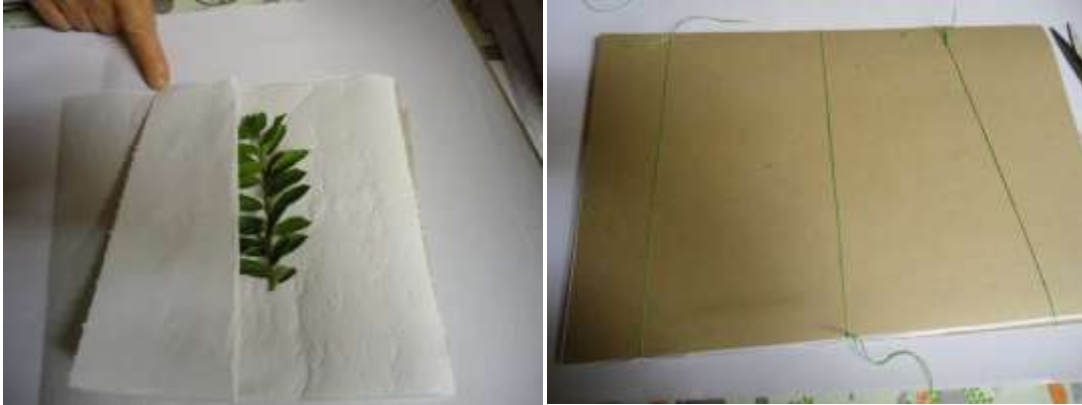
Figura 2- Processo de secagem de plantas feita pelos educandos do 7º ano durante o minicurso do Colégio Estadual do Campo Bom Jesus do Monte, Palmeira, Palmeira.

Após a secagem, as plantas foram afixadas em cartolinas e receberam uma etiqueta informativa sobre o local da coleta e os aspectos da amostra, como seu hábito (árvore, arbusto ou erva), seu odor e cor das flores e frutos, já que alteram com a secagem. Todo material montado foi acondicionado em sacos plásticos para evitar ataque de insetos e organizado em ordem alfabética das espécies.