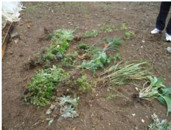
Figura 1-Amostras de plantas medicinais trazidas pelos educandos do 7º ano do Colégio Estadual do Campo Bom Jesus do Monte, Palmeira, Paraná.

Após a etapa de identificação do uso de plantas medicinais, iniciou-se a intervenção com a família e a comunidade escolar através da aplicação de questionário e entrevistas realizadas pelos educandos envolvidos nessa pesquisa. O objetivo da aplicação de questionários foi para mapear quais eram as plantas medicinais utilizadas na região e de que maneira as mesmas eram preparadas para o consumo.