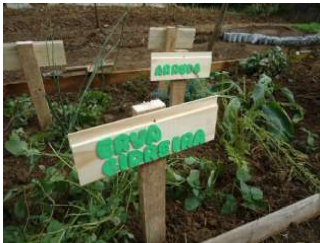
Figura 4- Horta experimental de cultivo de plantas medicinais, realizada pelos educandos do 7º ano do Colégio Estadual do Campo Bom Jesus do Monte, Palmeira, Palmeira.

distribuição de uma cartilha informativa distribuída para todos os participantes do projeto (educandos, professores, equipe pedagógica, comunidade escolar). Logo, é perceptível que a cartilha configurou-se como um meio de apropriação, sistematização e socialização dos saberes construídos coletivamente através da problematização do uso de plantas medicinais e possibilitou a divulgação do uso de uma das formas mais populares das artes de curar, os chás caseiros.