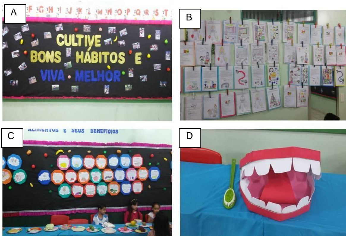
Figura 7: Imagens fotográficas representando o encerramento do Projeto - Atividade de encerramento: Feira Cultural . Painel A: demonstra um mural produzido com uma frase e as fotos dos alunos em todas as fases deste projeto. Painel B: representa os trabalhos de registro realizados pelos alunos com o que aprenderam no projeto; Painel C: Mural de curiosidades sobre os alimentos e alunos explicando sobre a importância de certos alimentos para a saúde; Painel D: Bocão produzido em sala de aula com os alunos para ensinar os participantes da feira como devemos escovar os dentes corretamente.