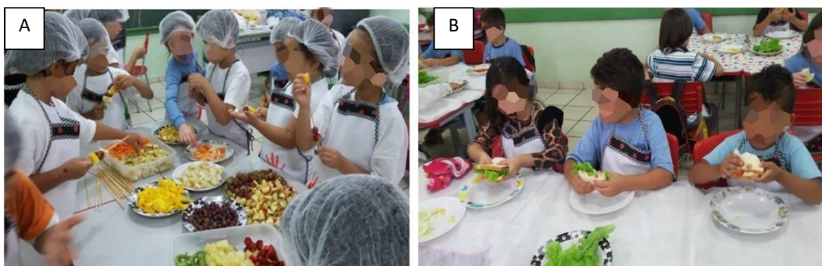
Figura 4 - Imagem Fotográfica da Fase 3 – Alimentação saudável . O Painel A representa o momento em que as crianças preparavam espetinhos de frutas. O Painel B representa a preparação de sanduiche natural.

A fase 3 - Alimentação saudável - que teve como objetivo de incentivar a adoção da alimentação saudável, realizamos diversas atividades como a apresentação de vídeos explicativos, pintura, jogos, música e atividades práticas realizando lanches saudáveis. No dia anterior a preparação dos espetinhos de frutas, estudamos sobre os nutrientes e benefícios do consumo de frutas, cada criança ganhou um avental e pintou sua mão nele. No dia da preparação retomamos a conversa sobre higiene e lavamos corretamente as mãos e fomos para a preparação dos espetinhos, a Figura 4 painel A representa este momento, em que as crianças estavam preparando seus espetinhos de frutas. Já a figura 4 painel B representa o momento da preparação de sanduiche natural. Depois de explicar sobre a importância do consumo de legumes e vegetais para a saúde do corpo, com os ingredientes disponíveis cada aluno fez seu próprio sanduiche.