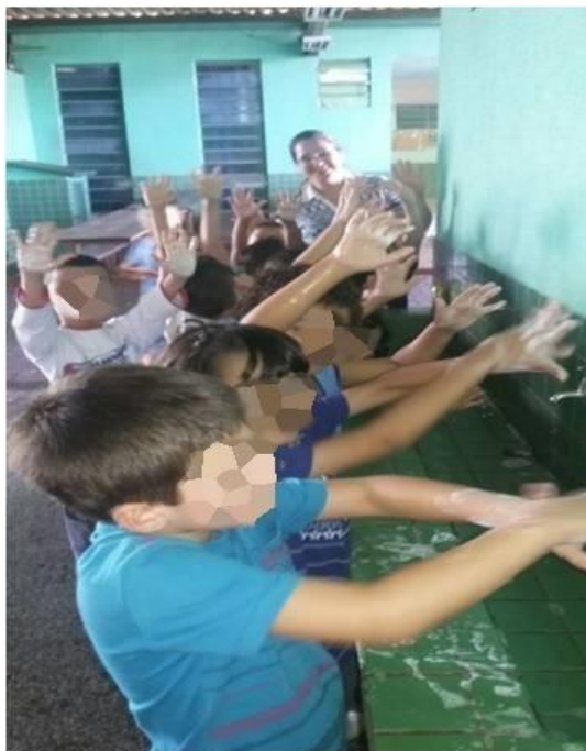
Figura 1 – Imagem Fotográfica da Fase 1 - Higiene – História, roda de conversa, atividades práticas, pintura, música e confecção de cartaz . Alunos durante a aula prática para aprender como devemos lavar corretamente as mãos

Na realização da primeira fase - Higiene – História, roda de conversa, atividades práticas, pintura, música e confecção de cartaz - as crianças ficaram atentas a todos os detalhes da história “O vestido Azul”, que conta a história de uma menina chamada Talita e uma comunidade que passou por importantes transformações graças a pequenas atitudes, higiene e cuidado com o meio ambiente. Nos debates demonstraram interesse sobre o tema, realizando vários questionamentos, assim como nas atividades práticas, na qual, todos participaram aprendendo a forma correta de lavar as mãos, como podemos observar na figura 1.