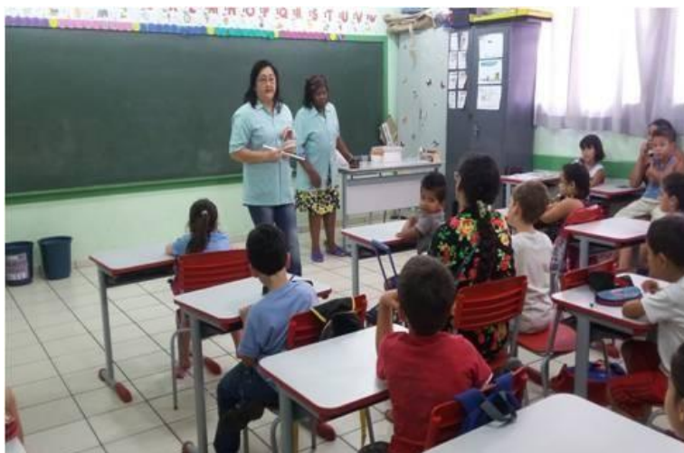
Figura 2 -. Imagem Fotográfica da Fase 2 - Cuidado com os dentes – Leitura de livro, palestra e atividade prática . – Dentista realizando palestra para pais e alunos.

A fase 2 - Cuidado com os dentes – Leitura de livro, palestra e atividade prática - teve como objetivo incentivar os alunos a adotarem o hábito de cuidar bem dos dentes, para mais qualidade de vida e elevar a sua autoestima. A figura 2 representa a palestra realizada pela dentista em sala de aula para os pais e alunos, a palestra foi muito importante pois além de tirar dúvidas sobre a formação e cuidados com os dentes da criança, os pais puderam perceber que o empenho com a saúde bucal em casa também deve permanecer, entendendo que cabe aos pais ensinar e cobrar dos filhos os cuidados com os dentes durante a infância.