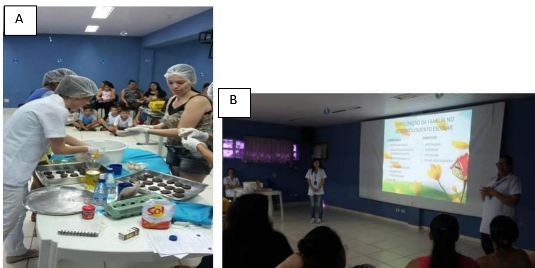
Figura 6 – Imagem fotográfica da fase 5 – Palestras e momento do café saudável para os pais . Painei A representa as mães ajudando na preparação de receita com a nutricionista; Painei B representa a palestra realizada com a assistente social e psicóloga.

para novas receitas e continuação dos cuidados que aprenderam durante as palestras.