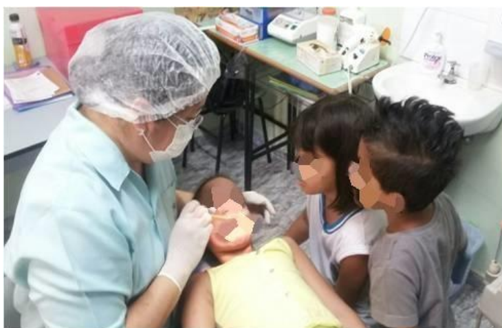
Figura 3 - Imagem Fotográfica da Fase 2 - Cuidado com os dentes – Leitura de livro, palestra e atividade prática. – Dentista realizando avaliação odontológica nas crianças que os pais não puderam estar presentes.

As crianças mostraram-se mais conscientes da importância da escovação, percebendo-se responsáveis pela própria saúde bucal.