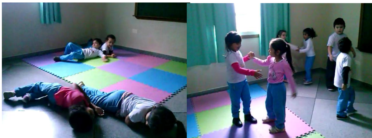
Arquivo pessoal da autora Aula 5- Movimentos explorando o chão Aula 4- Exploração de movimentos em dupla

Por isto, apesar das atividades as incentivarem e desafiarem a dançar com seus colegas, respeitou-se o desejo de algumas crianças em dançarem sozinhas em alguns momentos.