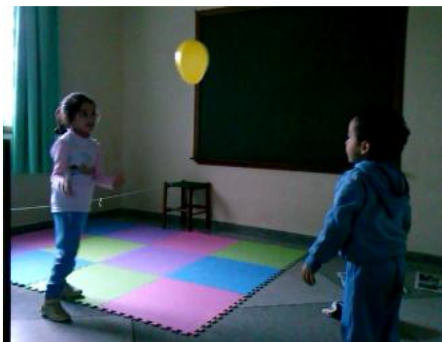
Aula 3- Exploração de movimentos em dupla: movimentos no chão, saltos, e etc.

Durante a maioria das aulas, ao dançarem em dupla dentro de círculos as crianças compartilharam o espaço sem choques ou esbarrões, até mesmo nos momentos em que as duplas realizaram movimentos de expansão em espaços restritos. Nesta situação, foi observado que os movimentos não foram tão expansivos como no momento em que dançaram sozinhos. Talvez isso tenha ocorrido porque as crianças estavam cuidadosas em não esbarrar em seu colega e perceberam que quanto mais expansivo o movimento, mais chances teriam de se esbarrarem.