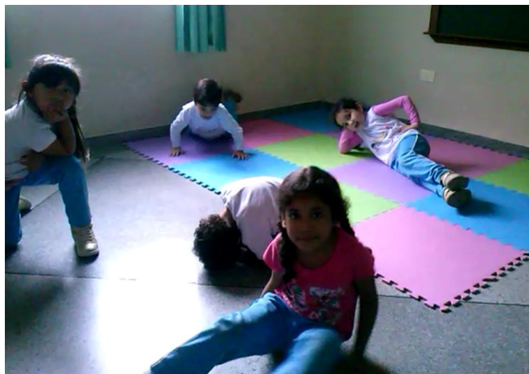
Aula 5- Poses utilizando o chão

Quanto à compreensão do elemento Tempo durante os encontros, já na primeira aula, as crianças perceberam as mudanças de velocidade na música, sem que fossem avisadas. Algumas crianças perceberam-na e passaram a dançar num ritmo mais rápido, relacionando a velocidade da música com a velocidade de seus movimentos. Esta atividade foi realizada também na última aula, e a compreensão das mudanças no elemento tempo e a influência da música sobre suas criações foi perceptível enquanto dançavam.