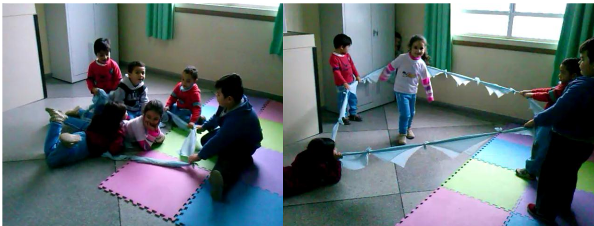
Aula 8- Contração e expansão

Um momento interessante ocorreu na terceira aula, durante a atividade em dupla com bambolês, as crianças K e W que possuem diferenças acentuadas de dimensões entre seus corpos, demonstraram compreensão sobre o espaço que seu corpo ocupa e o espaço do outro, e conseguiram realizar todo o trajeto entre os bambolês, sem choques ou esbarrões.