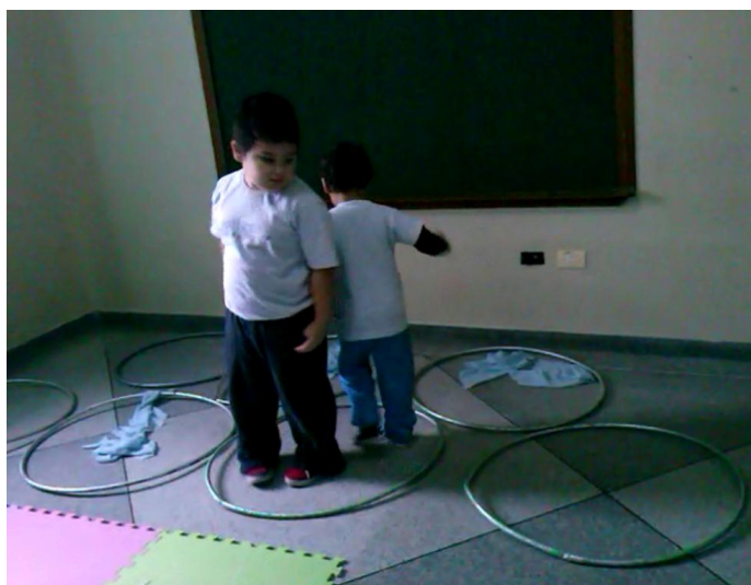
Aula 4- Noções de espaço.

Um momento interessante ocorreu na terceira aula, durante a atividade em dupla com bambolês, as crianças K e W que possuem diferenças acentuadas de dimensões entre seus corpos, demonstraram compreensão sobre o espaço que seu corpo ocupa e o espaço do outro, e conseguiram realizar todo o trajeto entre os bambolês, sem choques ou esbarrões.