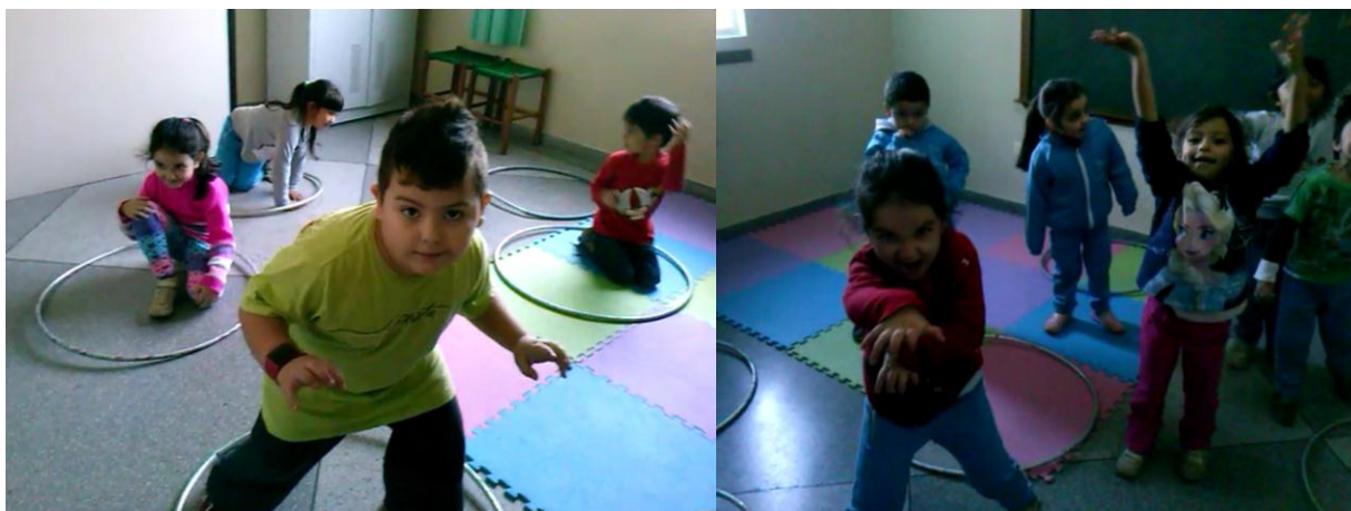
Aula 6 e aula 7- Contração e expansão

E, como afirma Fusaro (2010, p.74-75): “Se o aluno desenvolver o seu vocabulário de percepção e movimentos, estará recíproca e simultaneamente, desenvolvendo seu vocabulário intelectual”. Isto reafirma a importância no ensino da dança voltado ao repertório corporal na educação infantil, numa visão de desenvolvimento integral do aluno.