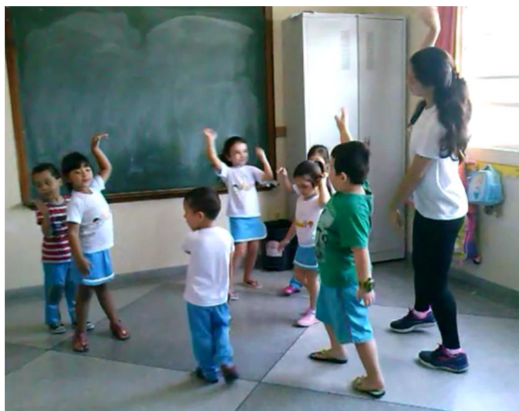
Aula 1- Elemento tempo

A apropriação e compreensão do fator tempo e da música por parte das crianças, apresentava-se aliada a uma boa distribuição espacial das mesmas que mesmo durante a velocidade do “rato” (rápida), não se trombaram ou se esbarraram.