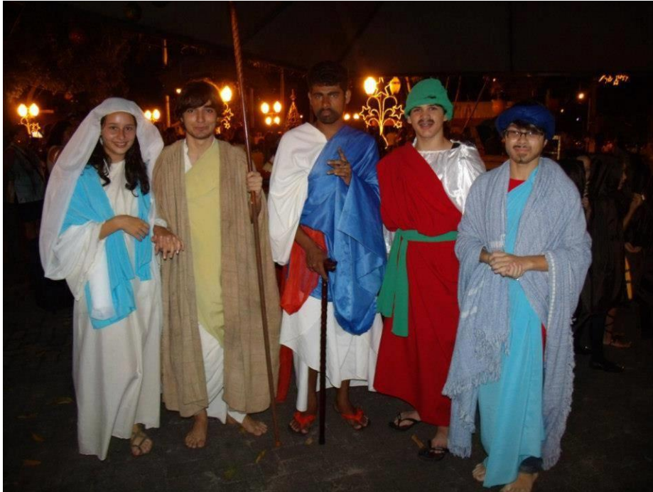
FIGURA 8 – Auto de Natal em Matinhos – 2011