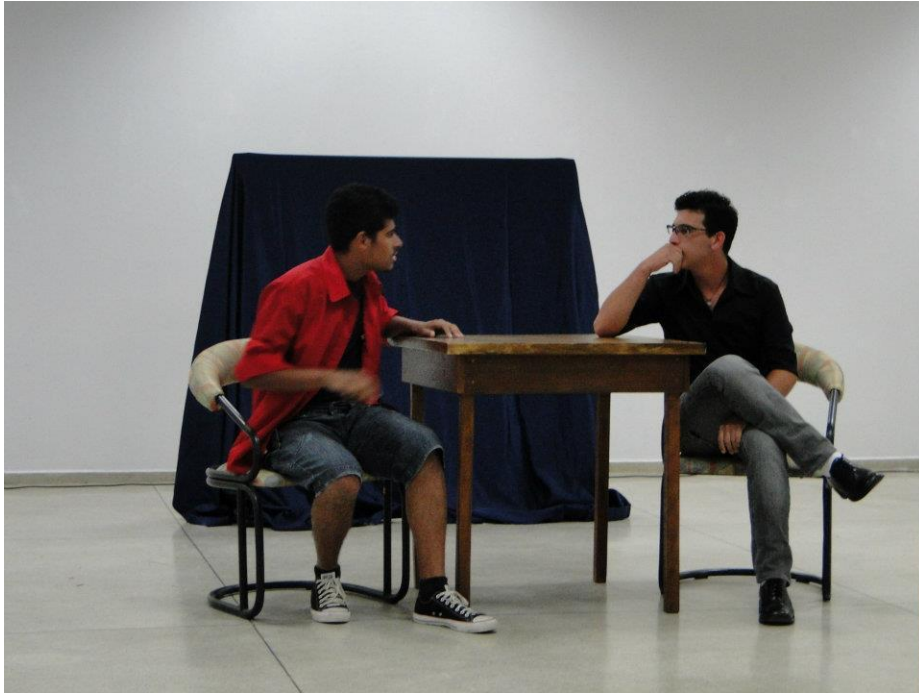
FIGURA 2 - Banca Profissionalizante SINATED 2011 – Comédia – O Diálogo dos Pênis