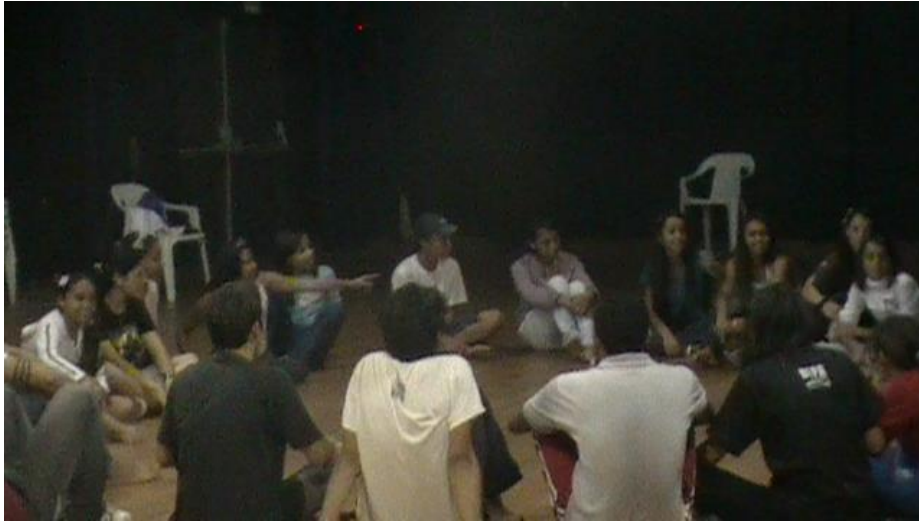
FIGURA 16 – Oficina de Teatro Projeto de Extensão PIBID Ciências e Cia de Teatro da UFPR Litoral