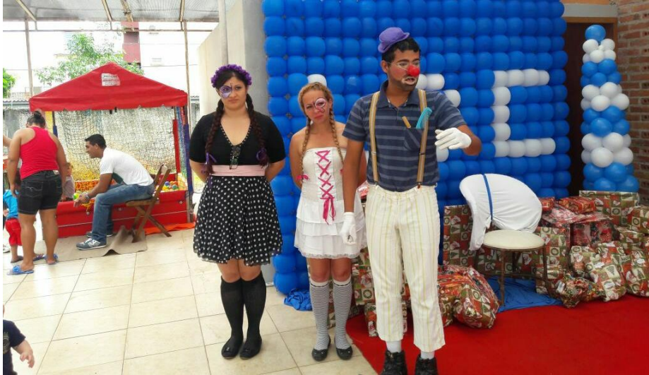
FIGURA 87 – Animação de evento – Paranaguá – PR 2017