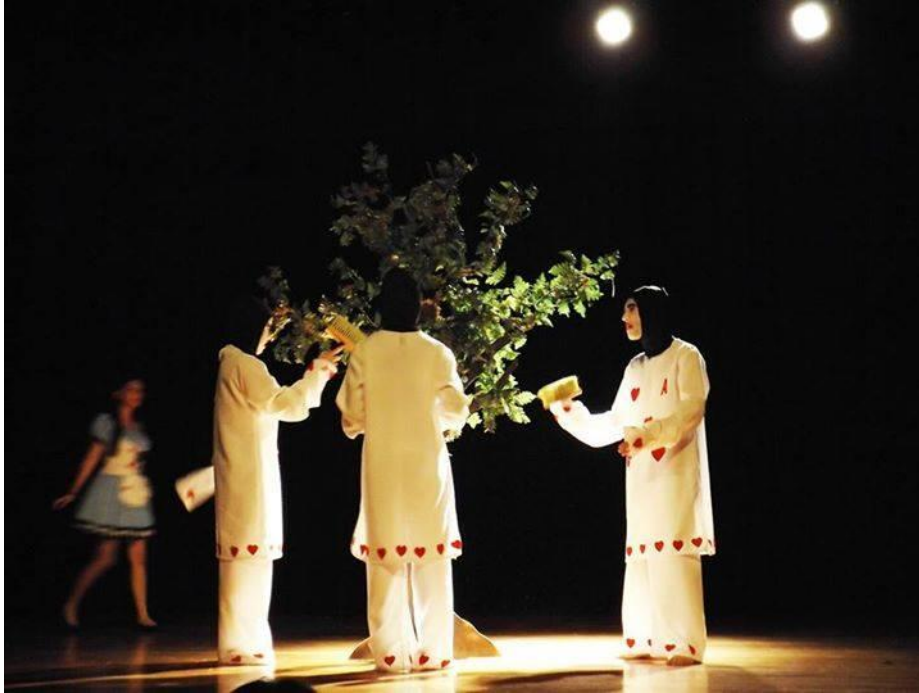
FIGURA 50 – Peça “Alice no País das Maravilhas” Projeto de Extensão da Cia de Teatro da UFPR Litoral – Juvenil (Paranaguá-PR 2014)