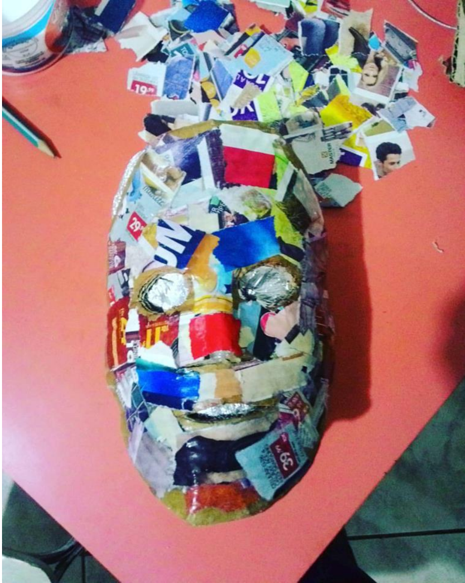
FIGURA 71 – Confeção de Máscaras/Cia Cultural Rainha Maçã - 2016