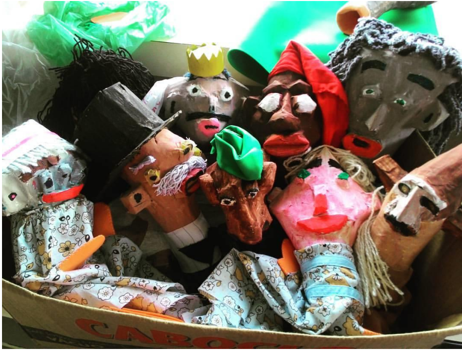
FIGURA 72 – Confecção de Bonecos Mamulengos no SCFV no CRAS Canoas - 2016