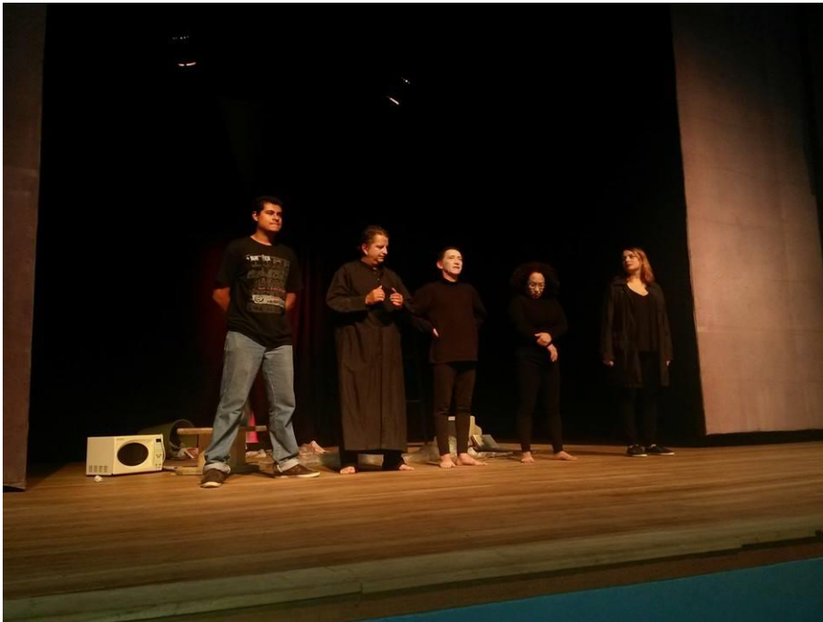
FIGURA 46 – Litoral em Cenas Breves 2014