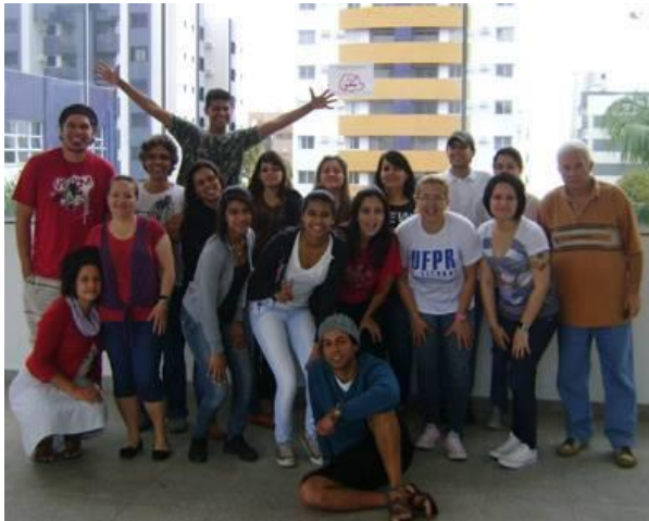
FIGURA 7 – Turma de Licenciatura em Artes 2011