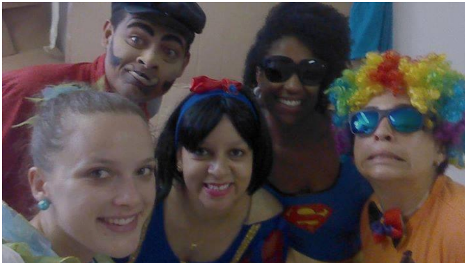
FIGURA 37 – Animação Infantil no Projeto Futuro Integral no SESC Caiobá – 2014