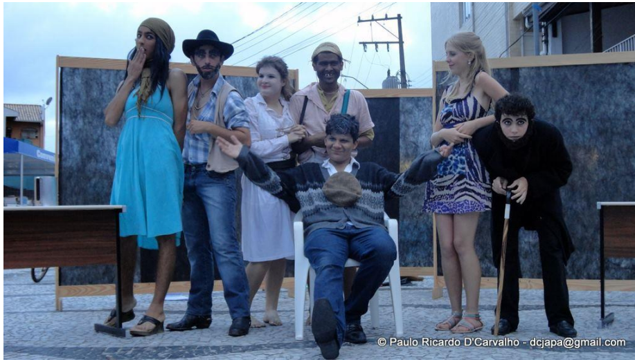
FIGURA 4 – O Santo e a Porca, apresentação no calçadão de Matinhos 2011