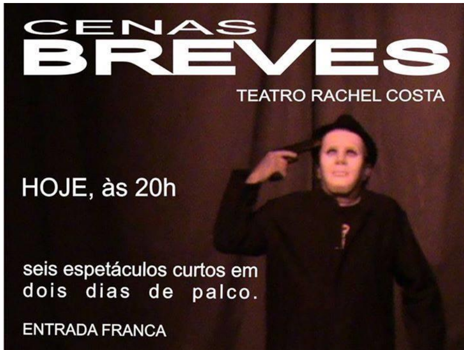
FIGURA 41 – Litoral em Cenas breves – Cartaz 1 - 2014