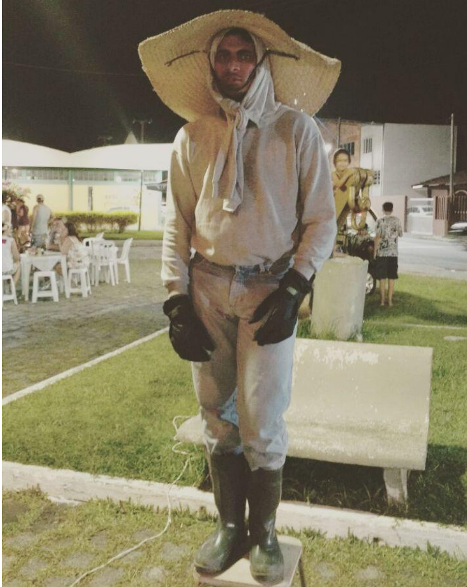
FIGURA 84 – Estátua viva nas feiras do Litoral – Personagem “Bóia Fria” - 2017