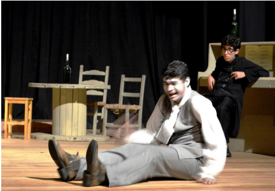
FIGURA 20 – Peça "Tribobó Litoral City" da Cia de Teatro da UFPR Litoral