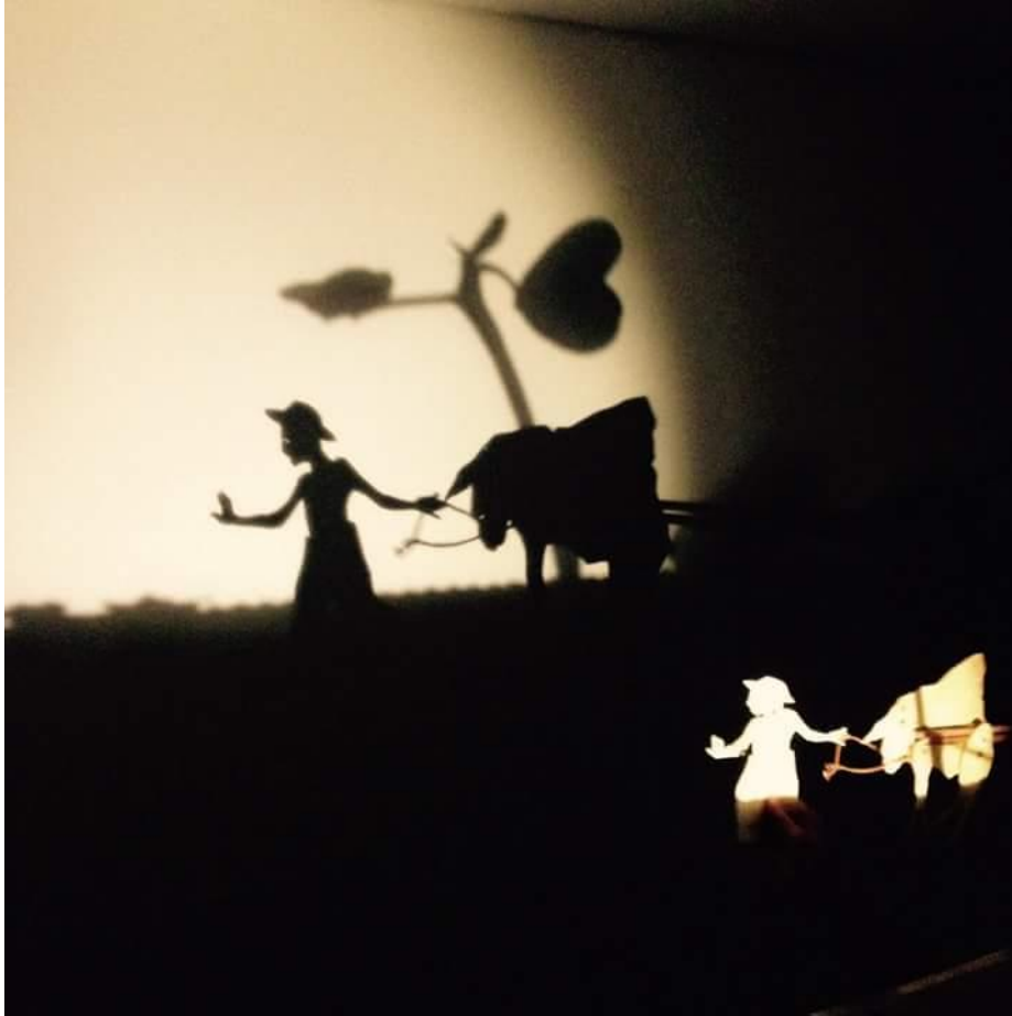
FIGURA 61 – Oficina de Teatro de Sombras no SESC Caiobá - 2015