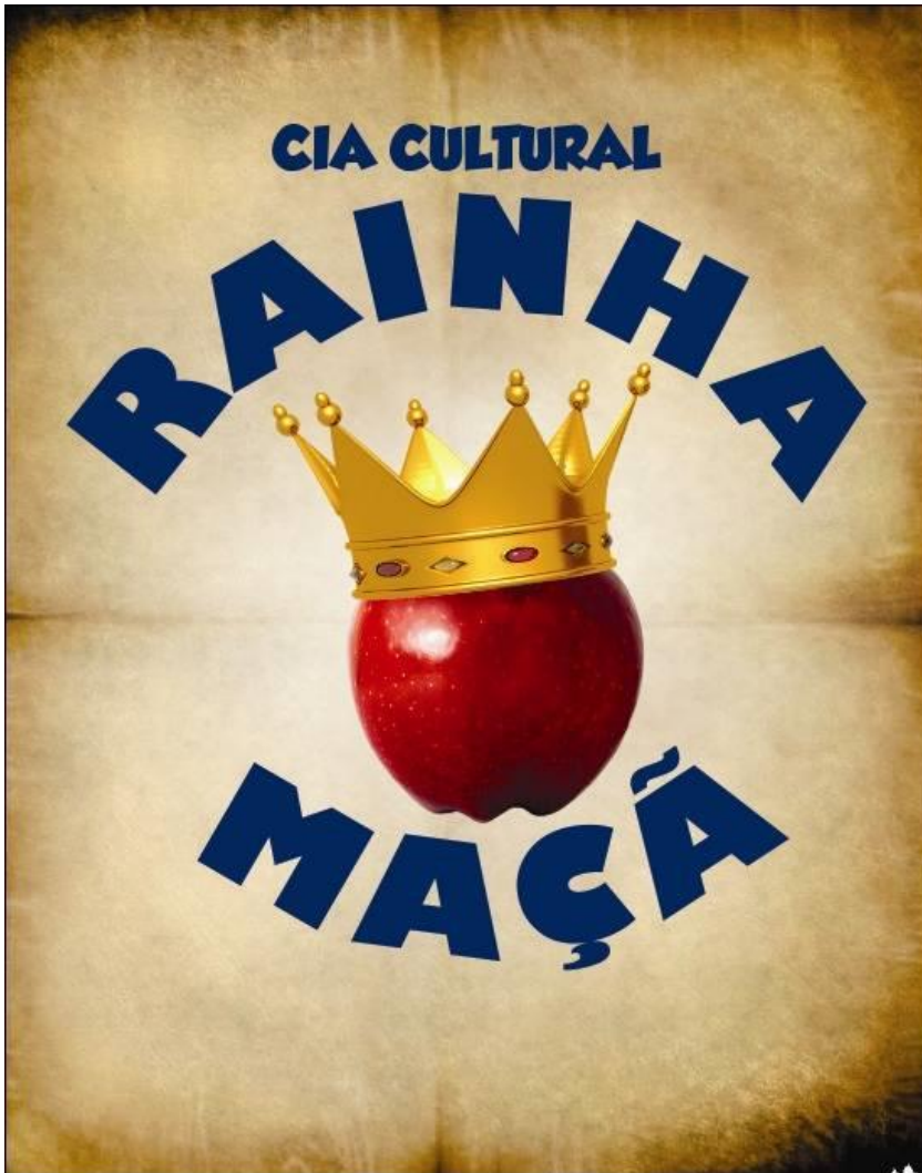
FIGURA 31 – Logo da Cia Cultural Rainha Maçã