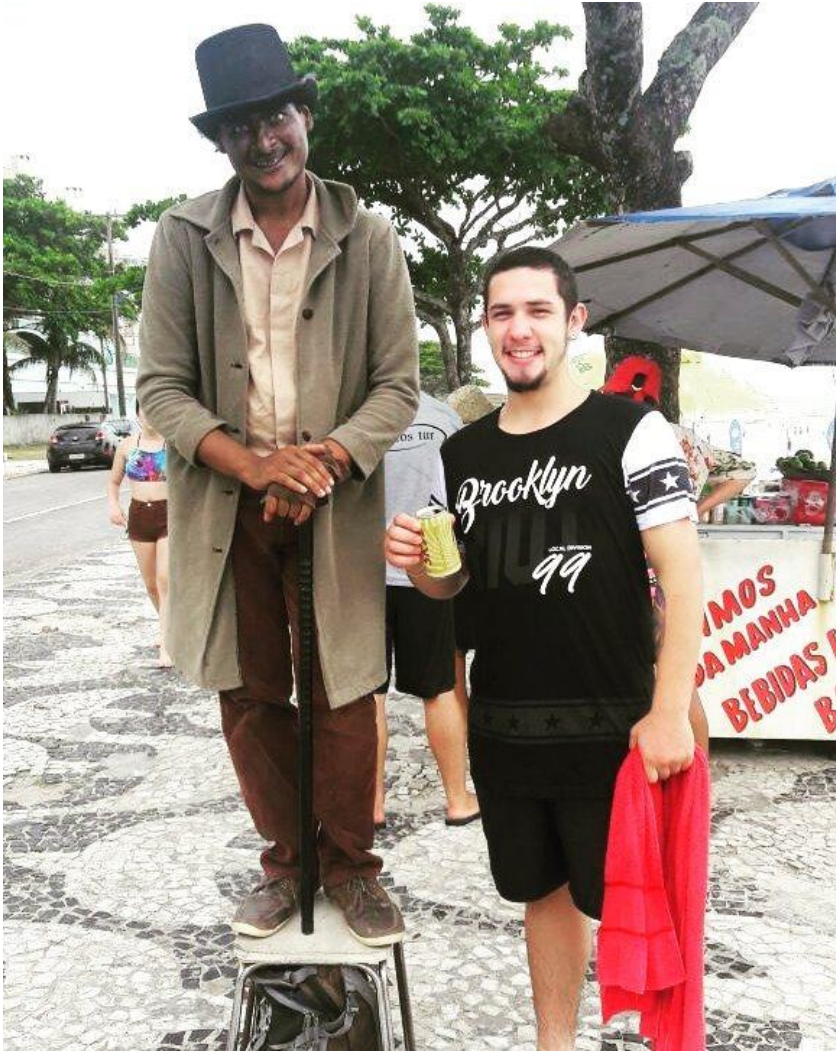
FIGURA 86 – Estátua viva no Calçadão da Praia Brava em Matinhos – Carnaval 2017