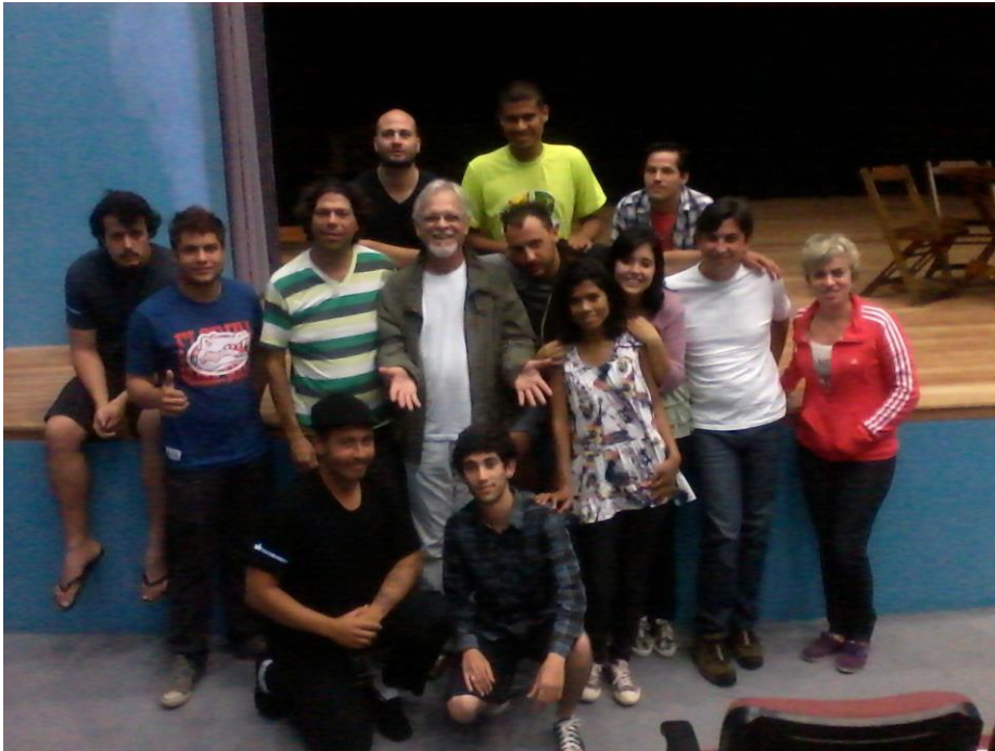
FIGURA 34 – Workshop de Produção Cultural realizado pela Ieger Produções - 2013