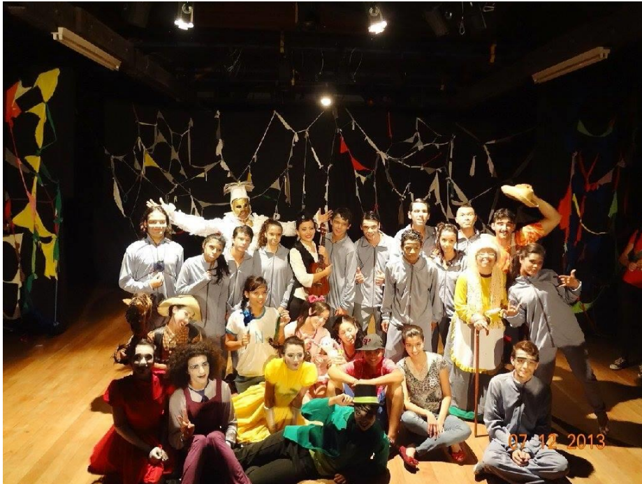
FIGURA 35 – Peça “No país dos Prequetés” Cia de teatro Juvenil da UFPR Litoral - 2013