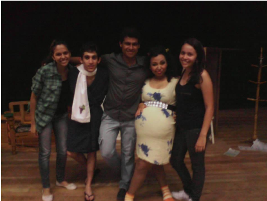
FIGURA 54 – Equipe da peça “O Padre e o Bêbado” - 2014