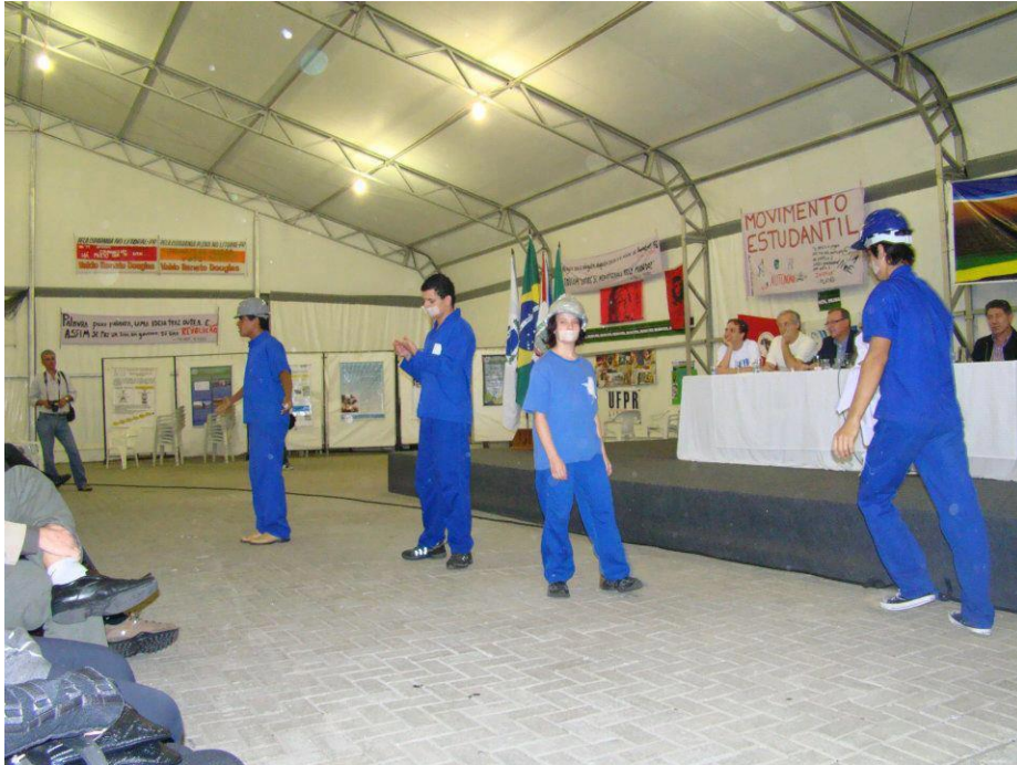
FIGURA 11 – Performance com o poema “Quem faz a história” de Berthold Brecht - 2012