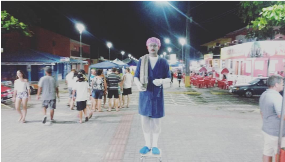
FIGURA 83 – Estátua viva nas feiras do litoral – Personagem “Homem Banho” - 2017