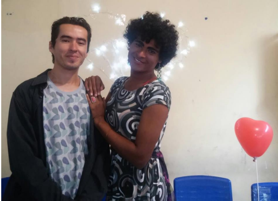
FIGURA 74 – Pós apresentação do monólogo "Mães Históricas e filhos bem-sucedidos"