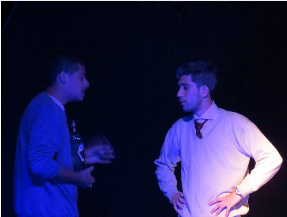
FIGURA 53 – Peça “Trapo” Retalhos Cia Artística 2014