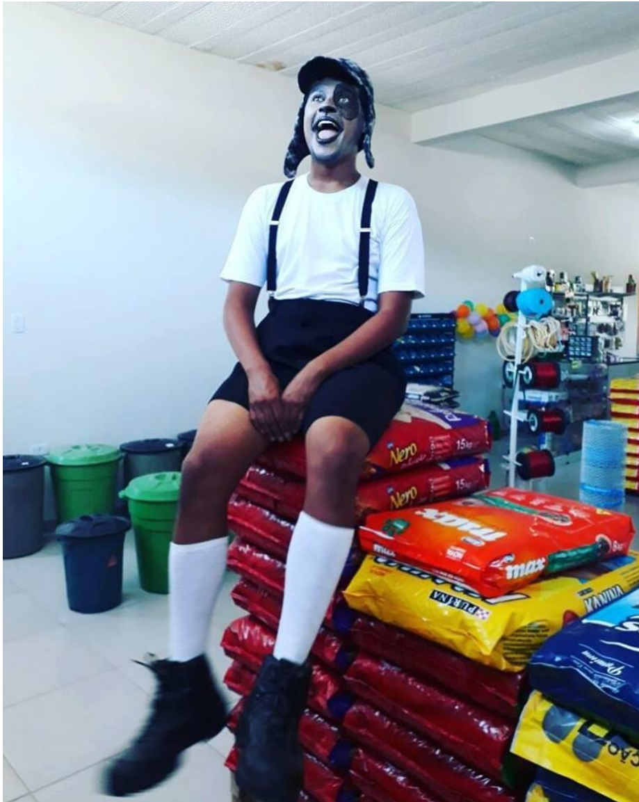
FIGURA 82 – Personagem Chipps – animação de inauguração de comércio em Matinhos - 2017