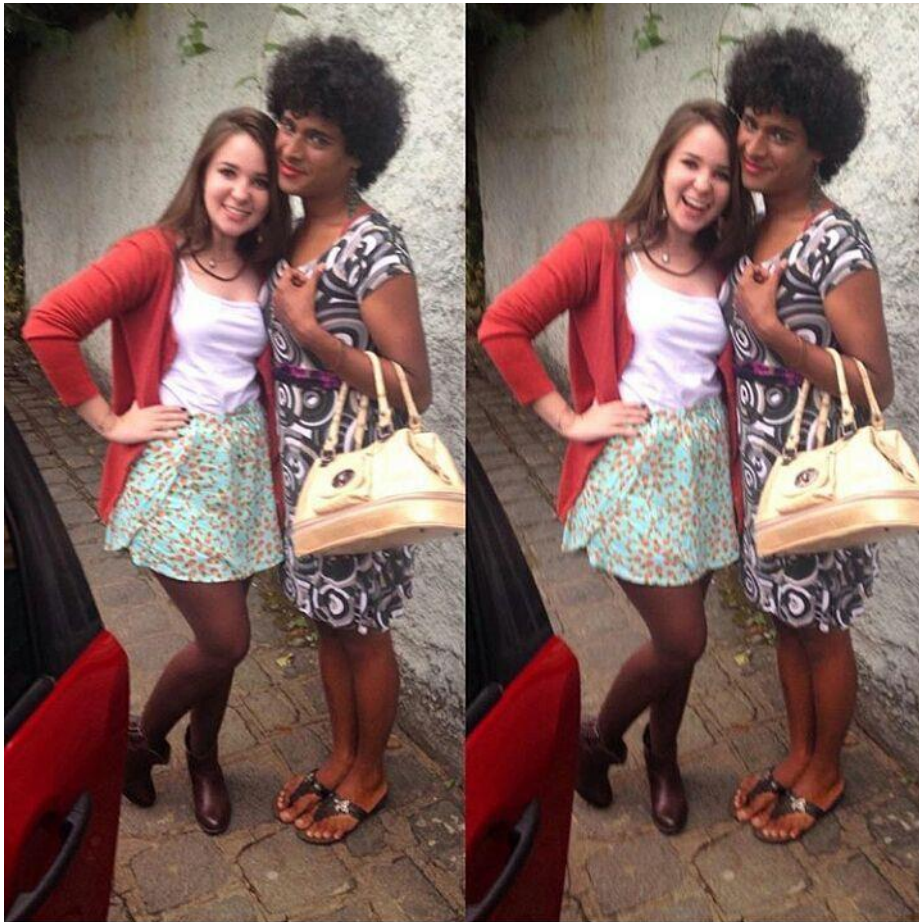
FIGURA 75 – Intervenção de rua com a personagem “Linda” da peça “Mães Históricas e filhos bem-sucedidos” - Dia das Mães 2016 – Morretes-PR