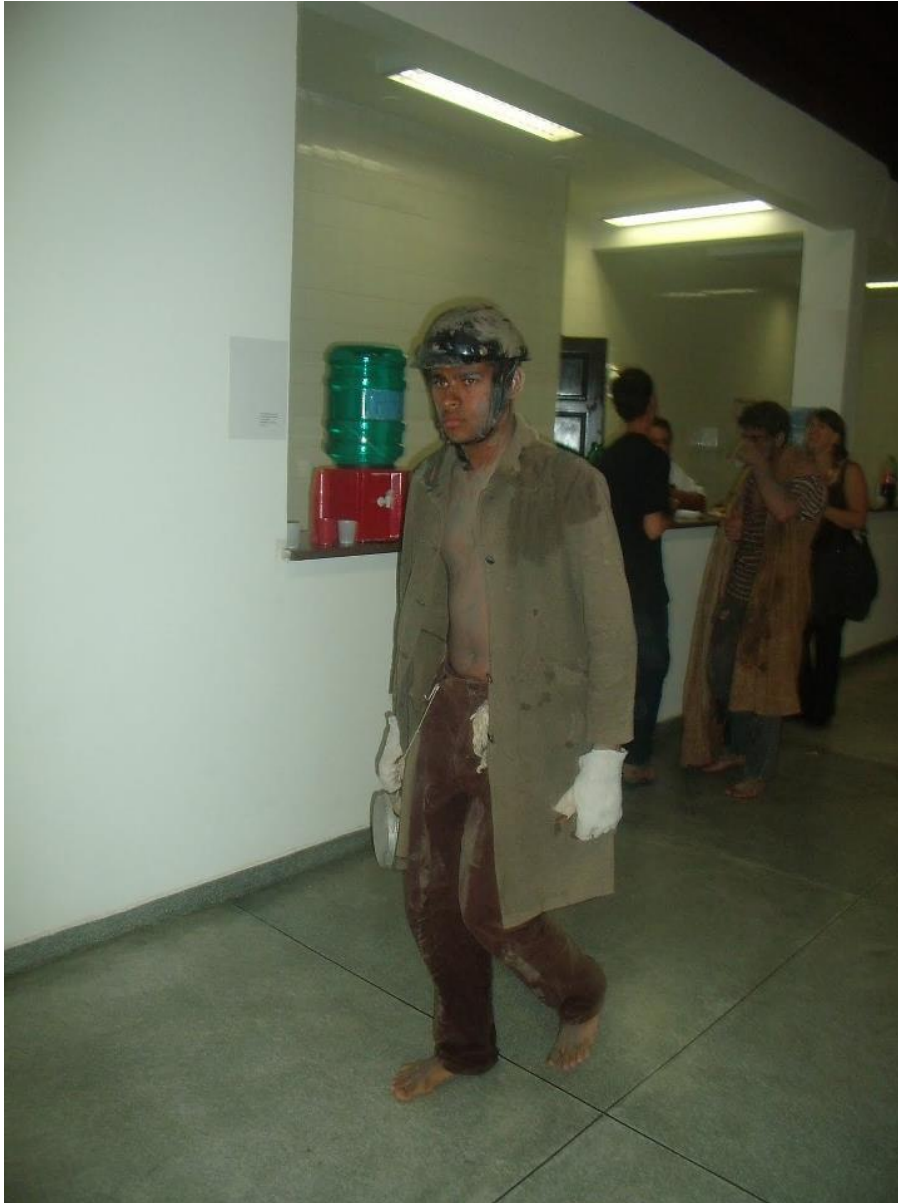
FIGURA 9 – Performance “Os Retirantes” (2011) Exposição da turma de Licenciatura em Artes 2008