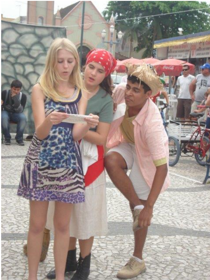
FIGURA 1 – Estréia da peça “O Santo e a Porca”