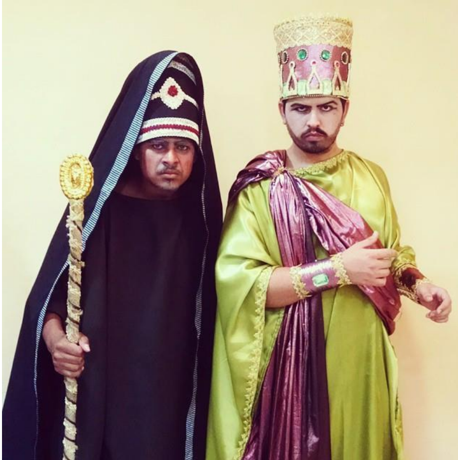
FIGURA 59 – Encenação da “Paixão de Cristo” - Paranaguá 2015