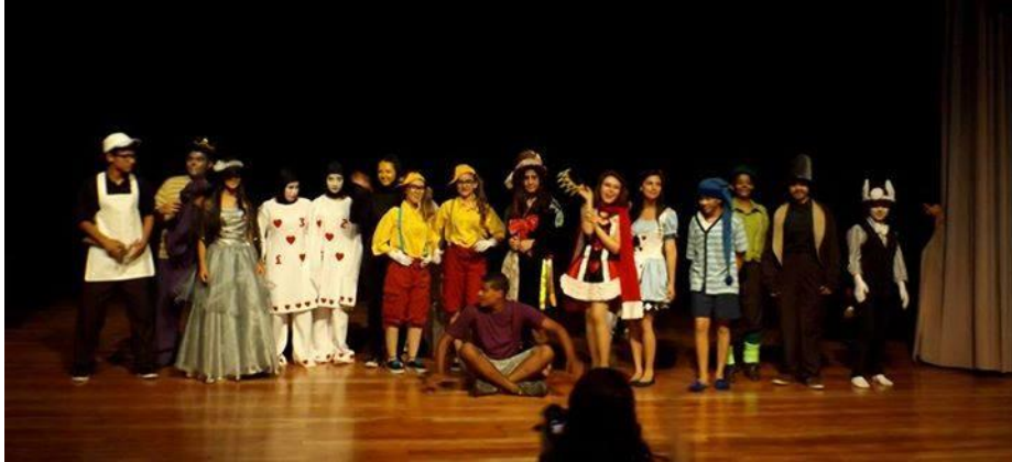
FIGURA 51 – Peça “Alice no País das Maravilhas” Projeto de Extensão da Cia de Teatro da UFPR Litoral – Juvenil (Paranaguá-PR 2014)