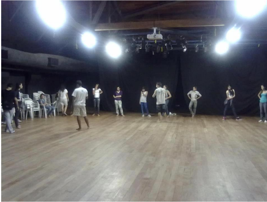
FIGURA 17 – Oficina de Teatro Projeto de Extensão PIBID Ciências e Cia de Teatro da UFPR Litoral