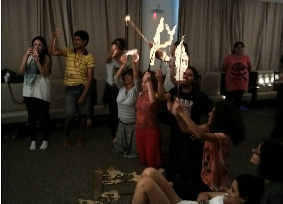
FIGURA 60 – Oficina de Teatro de Sombras no SESC Caiobá - 2015