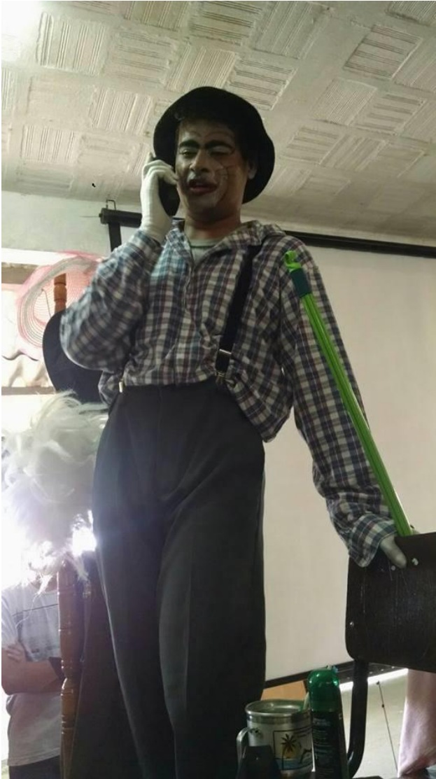
FIGURA 57 – Peça “Somente o Necessário para uma Viagem” - 2014