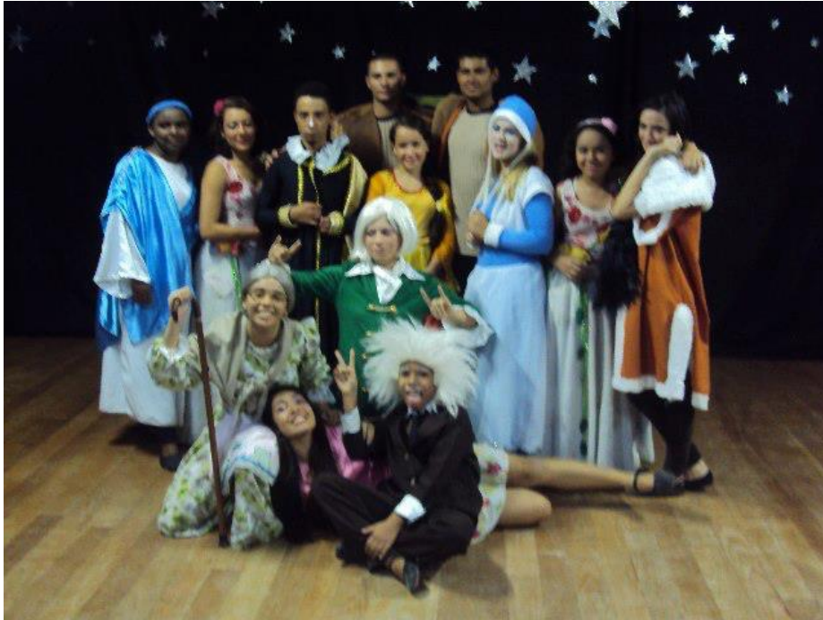
FIGURA 13 – PEÇA “Uma Viagem pelos Céus” Cia Juvenil de Teatro da UFPR Litoral - 2012