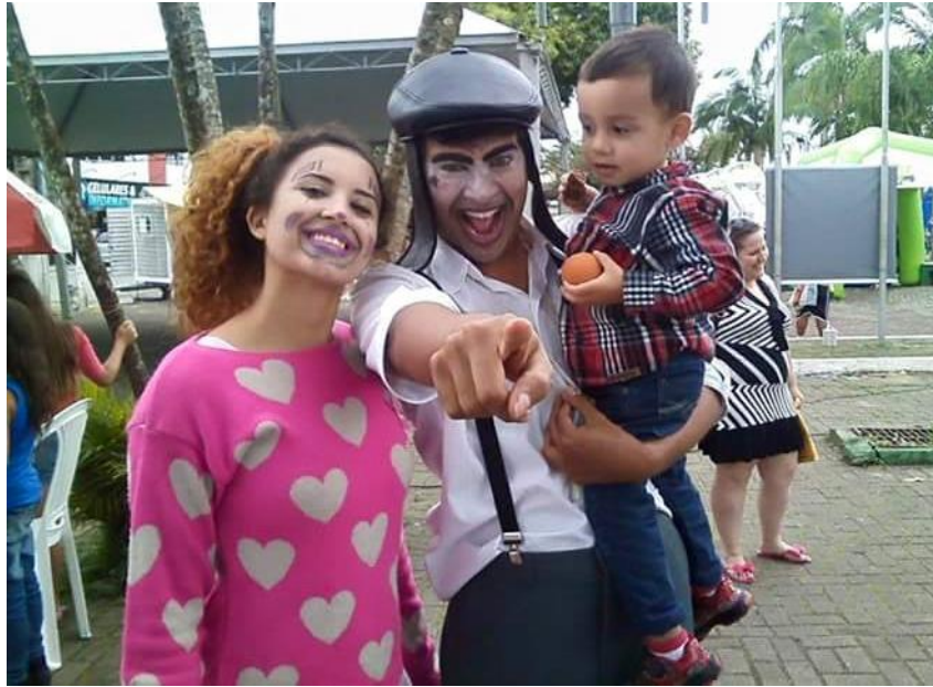
FIGUR A 63 – Animaç ão do Dia das Criança s – SESC Caiobá - 2015