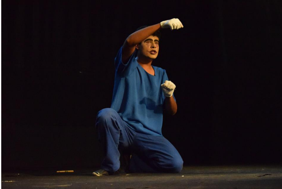
FIGURA 69 - "Arauto conta: A História de todas as Histórias" - 2016