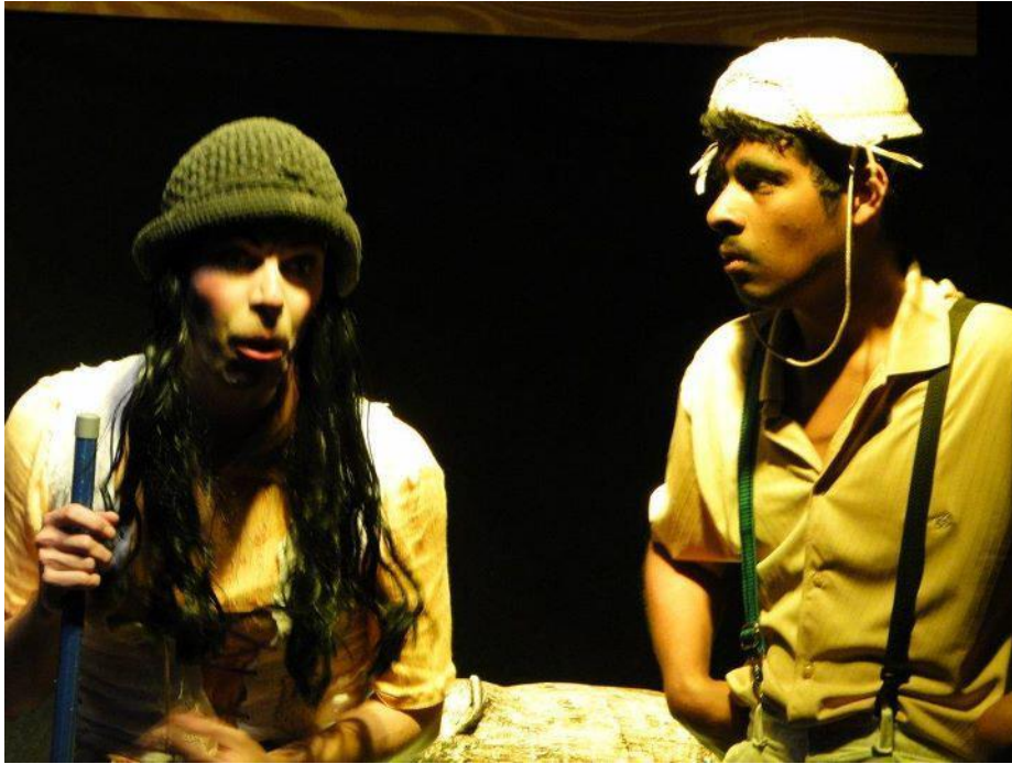
FIGURA 5 – O Santo e a Porca – apresentação no FESTPAR II - 2011