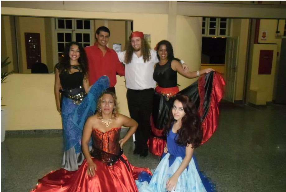
FIGURA 28 – Grupo Luna Plata de Dança Cigana