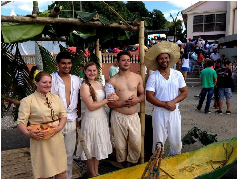
FIGURA 56 - "Auto de Nossa Senhora do Rocio" Paranaguá-PR - 2014