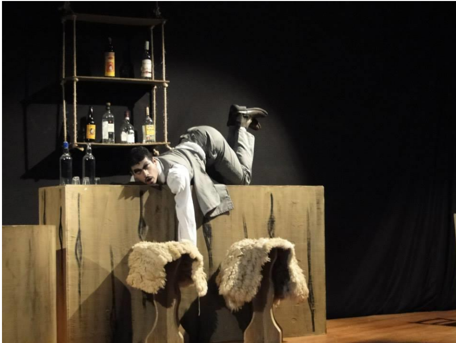
FIGURA 22 – Tribobó Litoral City, personagem Barman