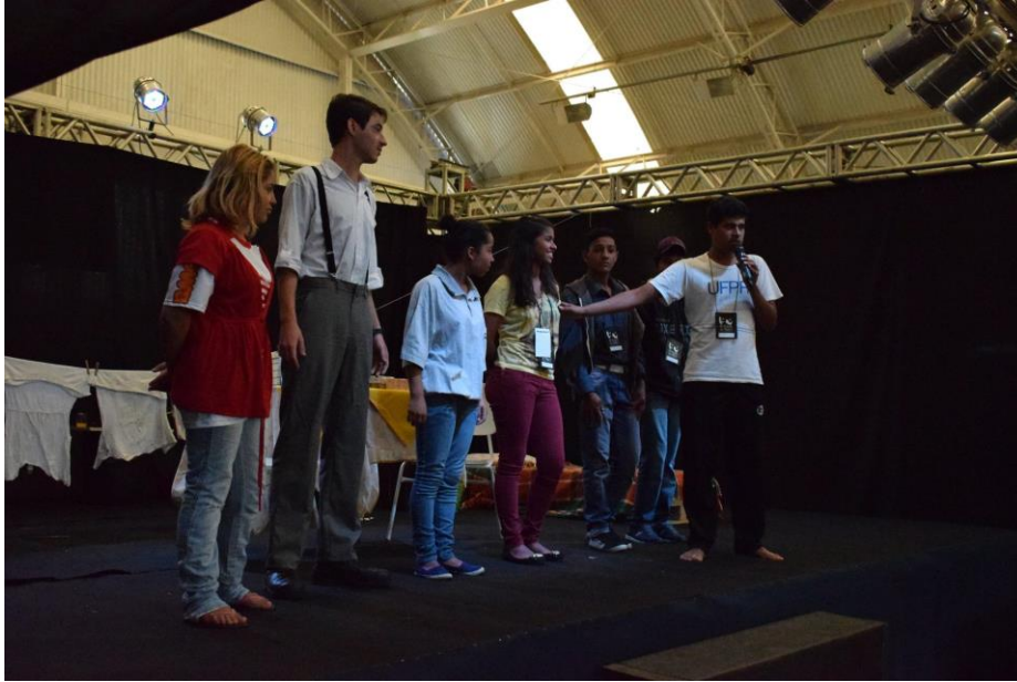
FIGURA 79 – Pós Apresentação da peça “Não me Julgue...” - 2016