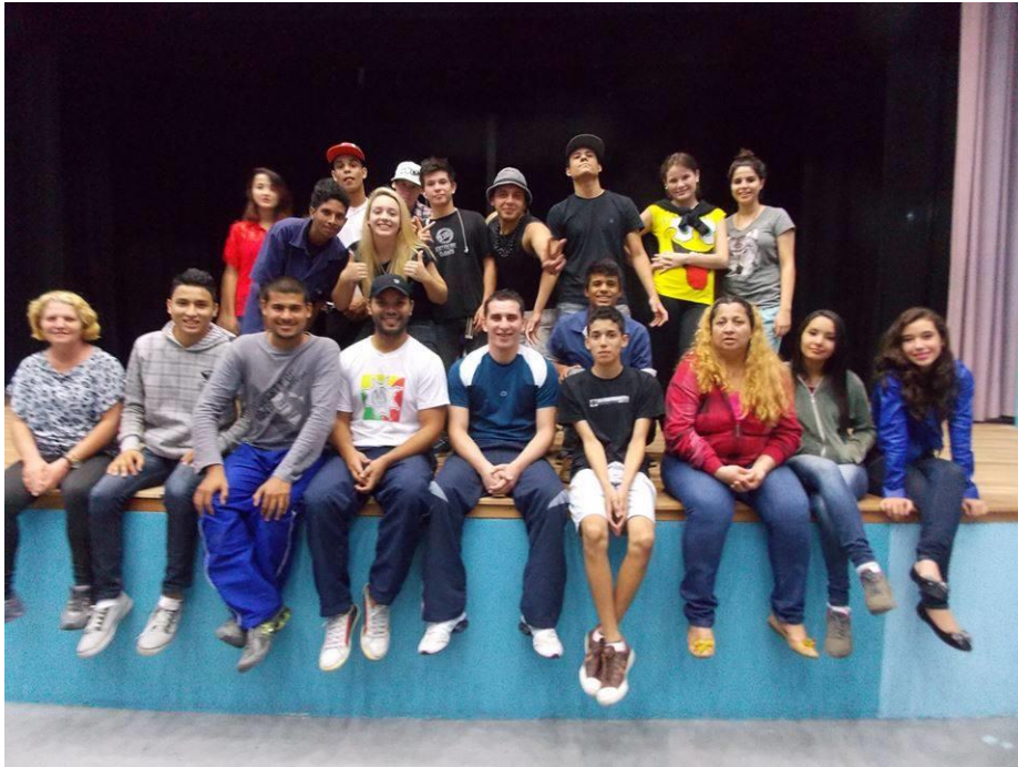
FIGURA 48 – Oficina de Teatro adulto - Projeto de Extensão da Cia de Teatro da UFPR Litoral (Paranaguá PR 2014)