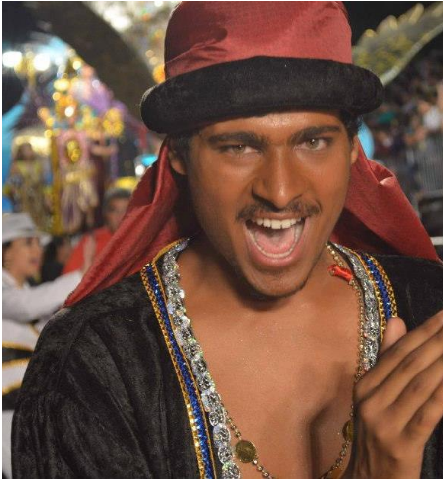
FIGURA 24 – Carnaval de Paranaguá, desfile das escolas de samba 2013