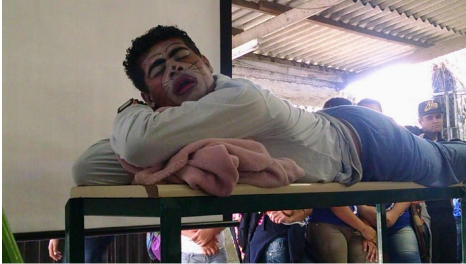
FIGURA 58 – Peça “Somente o Necessário para uma Viagem” - 2014