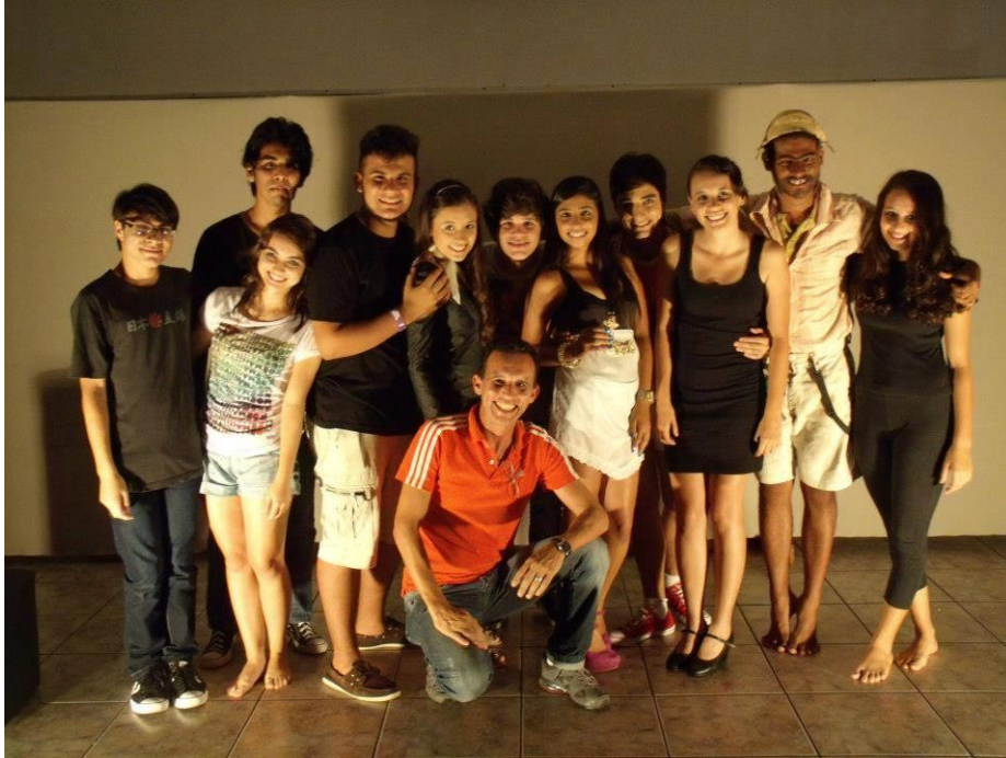
FIGURA 29 – “Show de Esquetes” Cia de Teatro Municipal de Matinhos - 2013