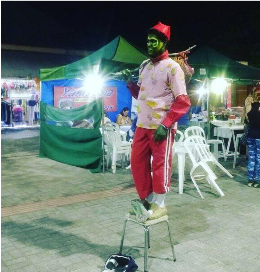
FIGURA 85 – Estátua viva nas feiras do Litoral – Personagem “Zero do baralho de Tarot” - 2017