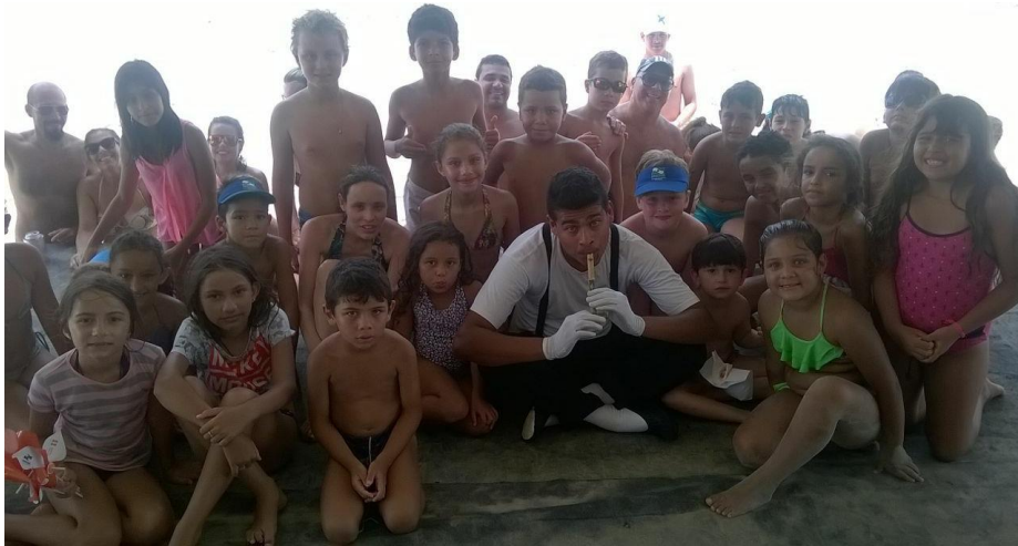
FIGURA 81 – Contação de Histórias Projeto Mais Verão e Arena RPC – 2016/2017