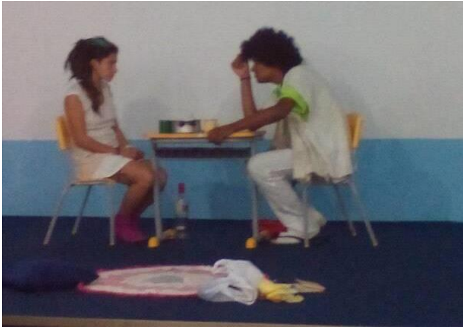
FIGURA 73 – Peça “Bailando com o Inimigo” Cia Cultural Rainha Maçã - 2016