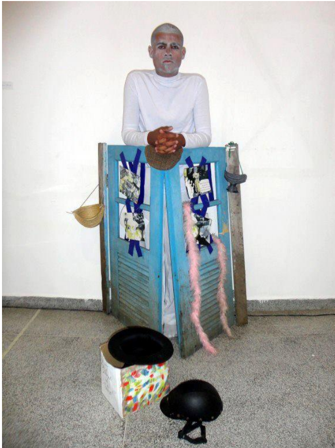
FIGURA 14 – Personagem Neutro, performance de improviso; Exposição da Turma de Licenciatura em Artes 2011; ano 2012