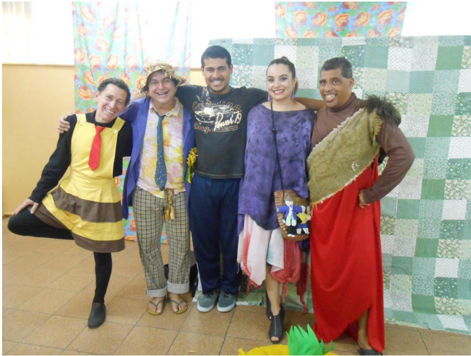
FIGURA 55 – Zito o Espantalho – Produção 2014