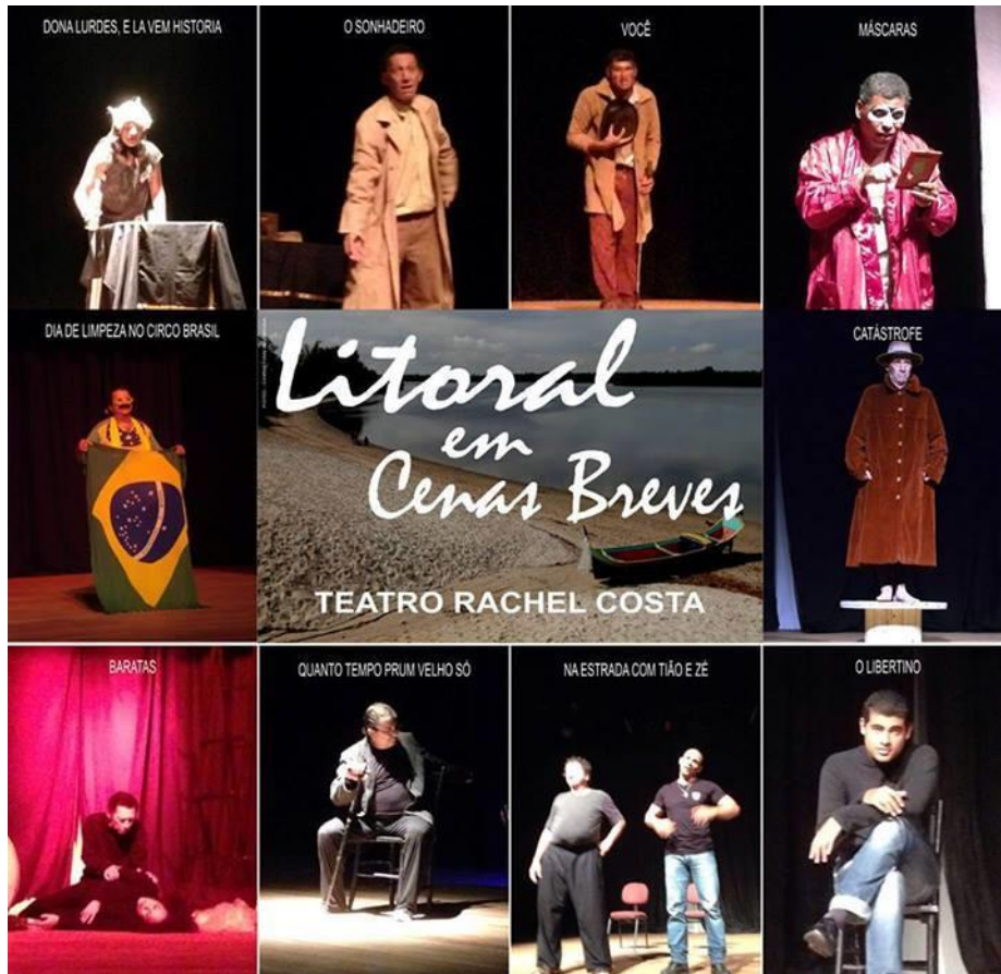
FIGURA 47 – Litoral em Cenas Breves – Cartaz 4 – 2014

FONTE: Arte Christian Barbosa/Acervo pessoal do Acadêmico