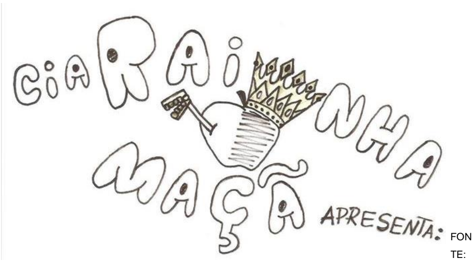
FIGURA 30 – Primeira Logo da Cia Cultural rainha Maçã (lápiz 6B no Sulfite)