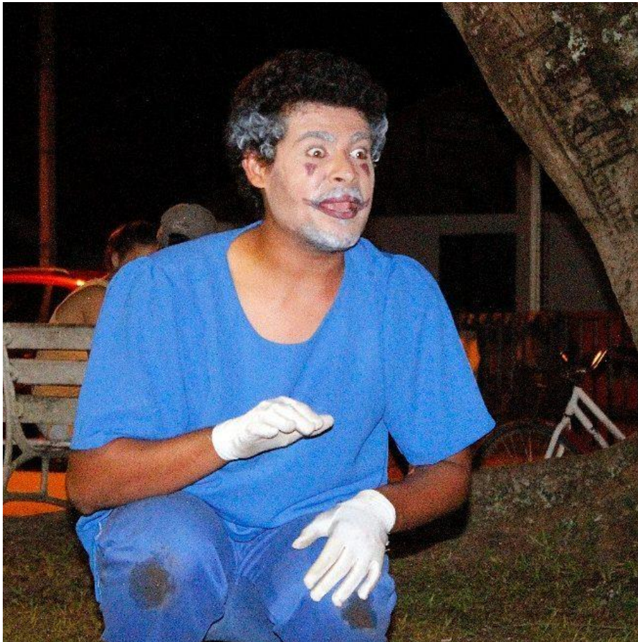
FIGURA 88 – Arauto conta: A História de Todas as Histórias; Projeto Cultura na Estação de Alexandra/Paranaguá-PR - 2017