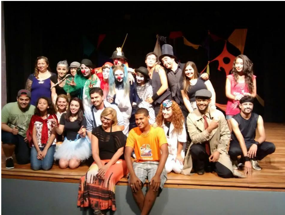
FIGURA 49 – Peça “Quem matou o Leão” Projeto de Extensão da Cia de Teatro da UFPR Litoral 2014 (Paranaguá PR 2014)