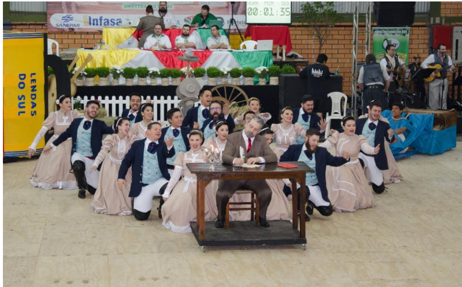
FEPART 2016