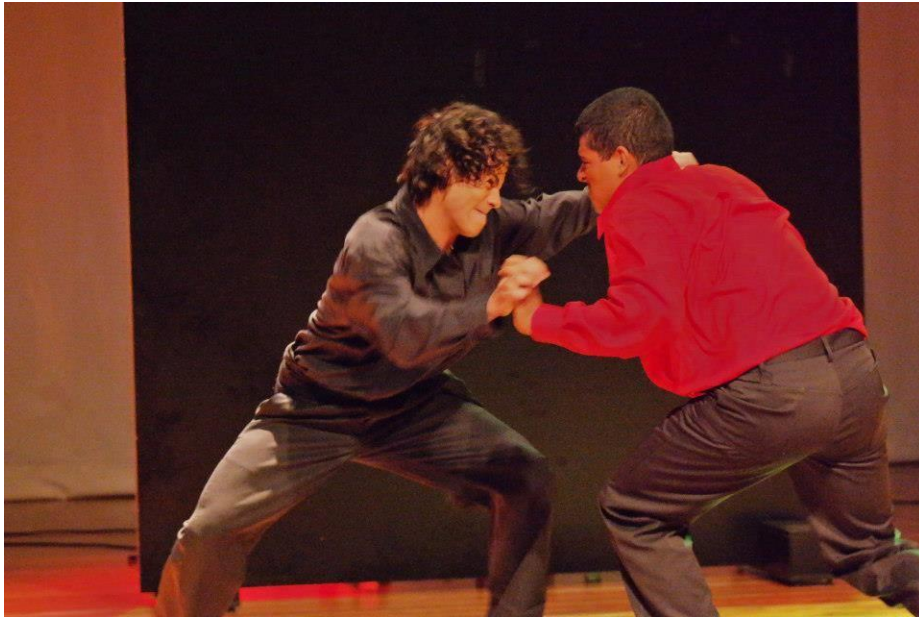
FIGURA 27 – Grupo Luna Plata de Dança Cigana