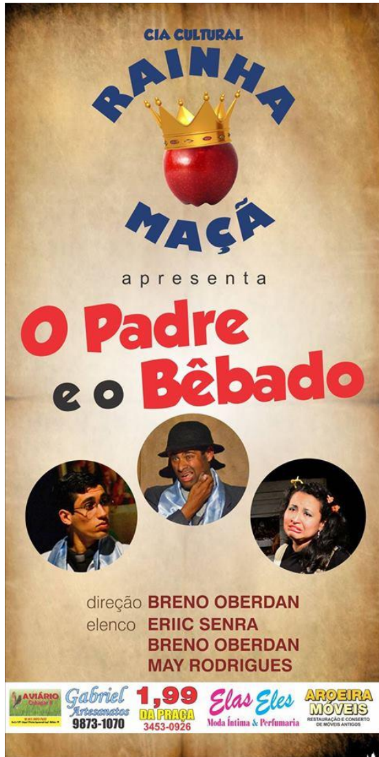
FIGURA 32 - Banner de divulgação