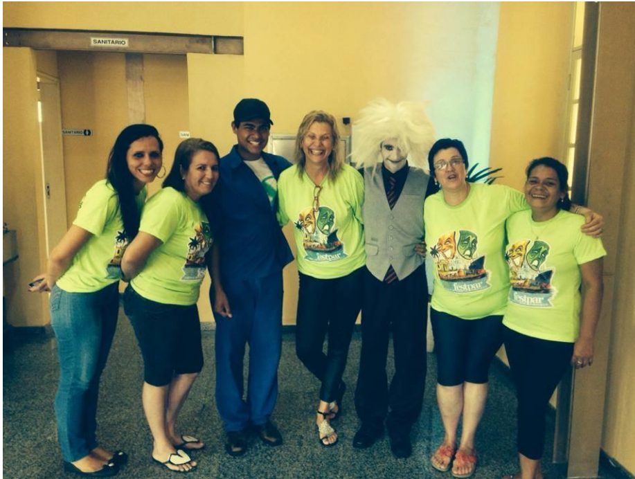
FIGURA 25 – BRECHT & SHAKESPEARE da Cia Cultural Rainha Maçã