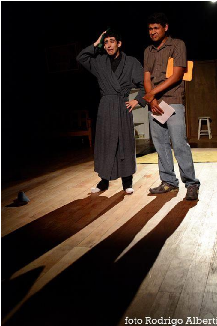
FIGURA 33 – Estreia da peça “O Padre e o Bêbado” 2013 – Centro Cultural da UFPR Setor Litoral