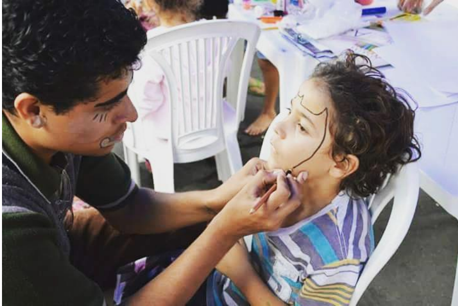
FIGURA 62 – Animação do Dia dos Pais – SESC Caiobá - 2015