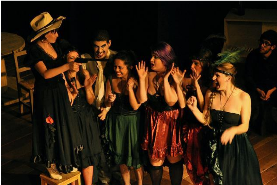
FIGURA 21 – Peça "Tribobó Litoral City" no FESTPAR IV – 2013