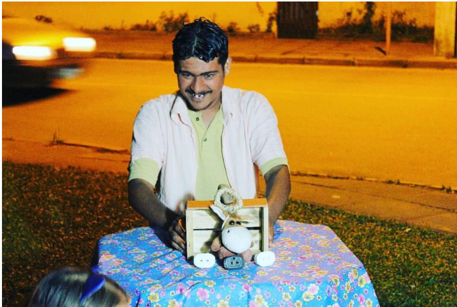
FIGURA 89 – Os Três Porquinhos, Teatro com manipulação de objetos; Projeto Cultura na Estação - 2017