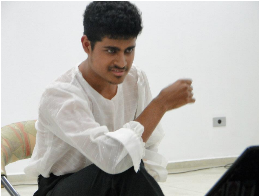
FIGURA 2 - Banca Profissionalizante SINATED 2011 – Drama – O Libertino