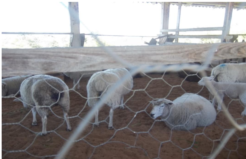
Figura 2 “Adorei o passeio com a turma “Visita no Colégio Agrícola - Criação de carneiros.” Paulo (10) anos.