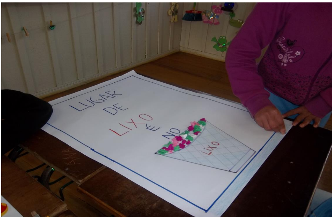
Figura 6 "Esta escola é bem legal, cada turma realiza um trabalho diferente" João Pedro (9 anos).