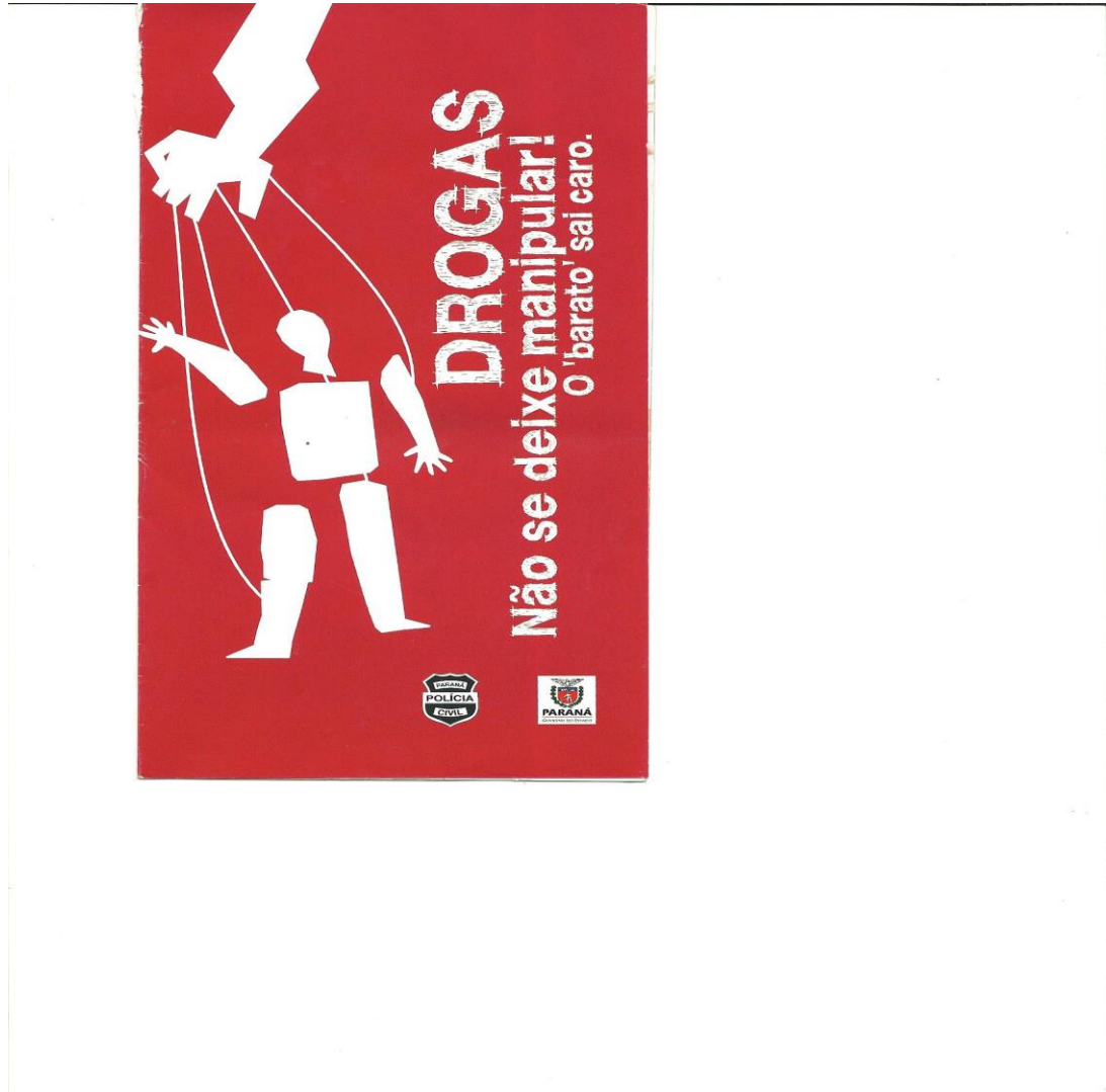
FOTO 10 – CARTILHA CEDIDA A CADA ALUNO DURANTE A VISITA, PELO CENTRO ANTITÓXICOS DE PREVENÇÃO E EDUCAÇÃO – CAPE