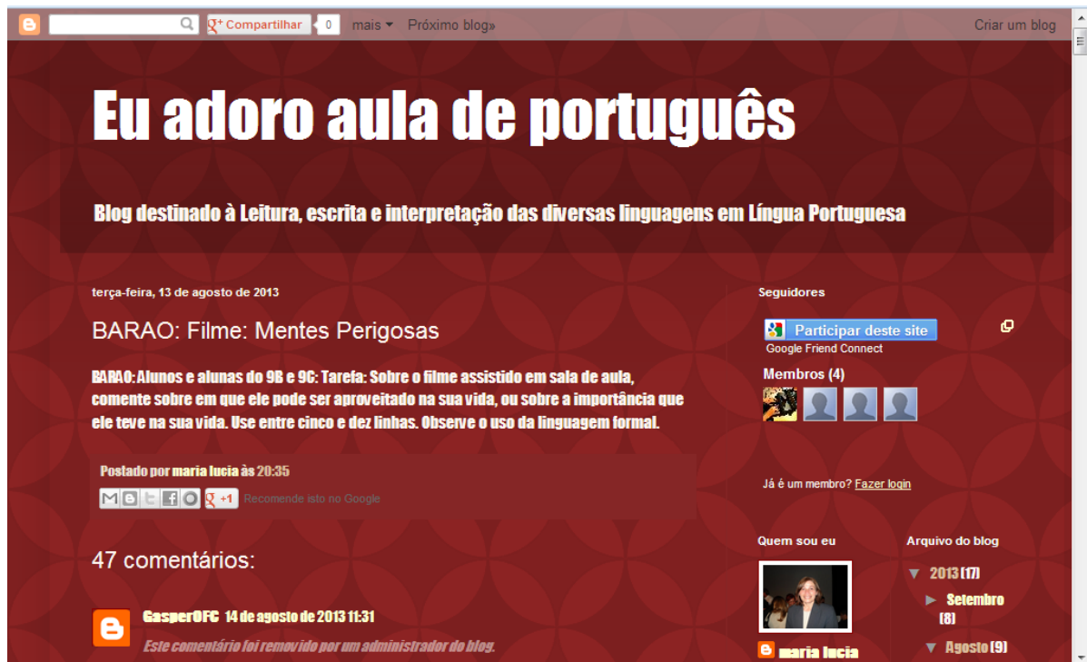
FOTO 7 – ESPAÇO CRIADO NA REDE SOCIAL BLOG PARA INTERATIVIDADE PROFESSORA/ALUNOS