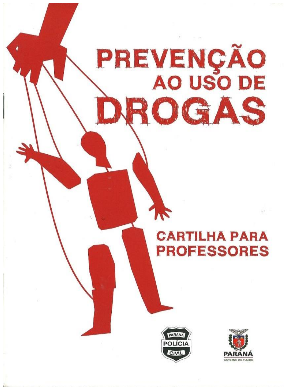
FOTO 9 – CARTILHA CEDIDA À PROFESSORA PELO CENTRO ANTITÓXICOS DE PREVENÇÃO E EDUCAÇÃO - CAPE