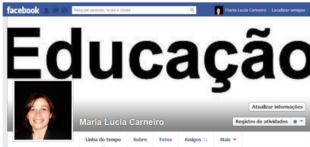
FOTO 6 – ESPAÇO CRIADO NA REDE SOCIAL FACEBOOK PARA INTERATIVIDADE PROFESSORA/ALUNOS