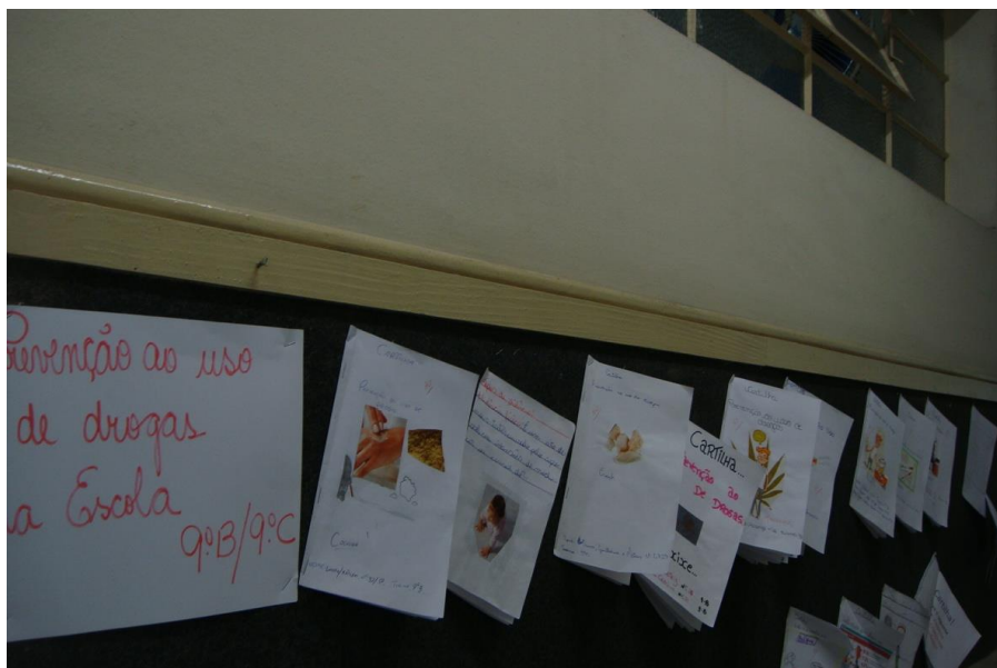
FOTO8 – EXPOSIÇÃO DE CARTILHAS PRODUZIDAS PELOS ALUNOS