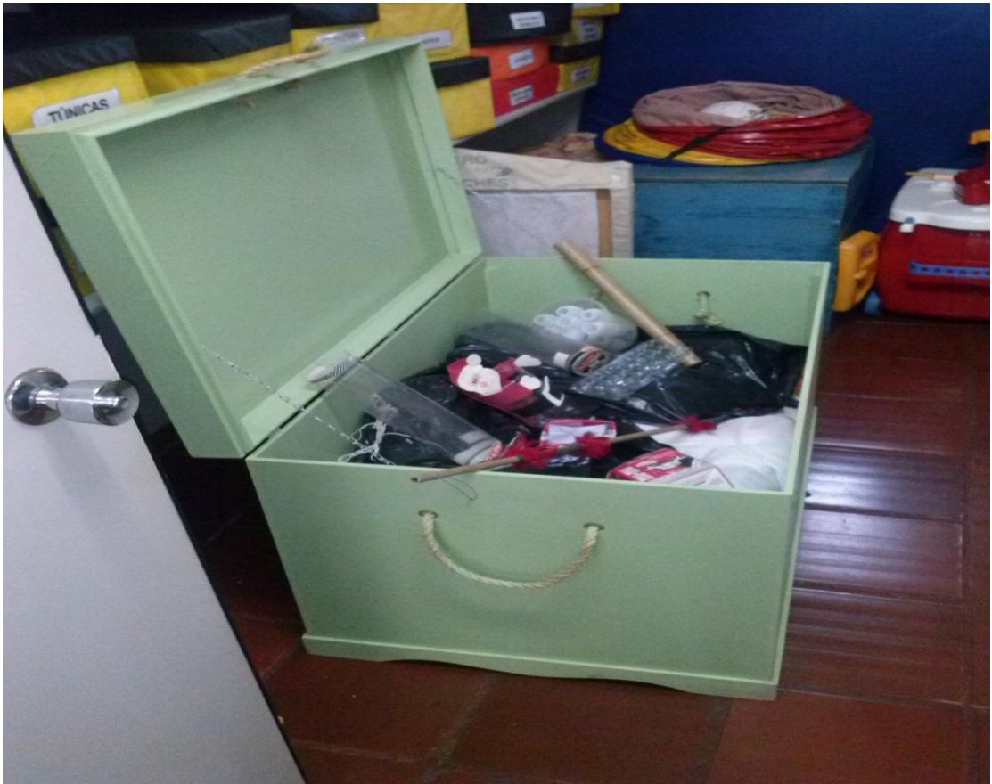
ANEXO 08 – Baú com brinquedos feitos de sucatas confeccionados em casa com os pais