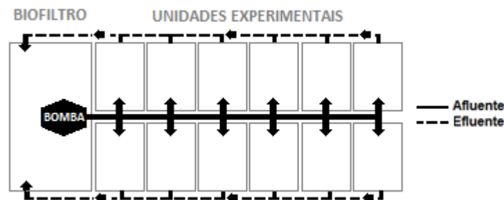
Figura 1. Desenho esquemático do sistema de recirculação

O sistema de recirculação foi composto por doze caixas de polietileno (dimensões: 31 x 36 x 30 cm e vazão: 24 L h -1 ) ligadas a um biofiltro (0.12 m 3 ) receptor dos efluentes (Figura 1). O volume do biofiltro foi composto por 20% de bioballs (Hi-density bio sphere com 43 mm de diâmetro), 40% de conchas de ostra e 40% de argila expandida. Cada caixa foi revestida na sua base por um fundo falso recoberto com manta bedim e uma camada de cinco centímetros de areia possibilitando o fluxo de água descendente nos tanques de cultivo. Foi mantida em todas as unidades experimentais uma coluna de água de cinco centímetros. No total foram realizados três experimentos independentes no sistema de recirculação, com duração de 60 dias cada um. O tempo dos experimentos foi baseado em trabalhos que contemplaram a biologia reprodutiva da espécie, principalmente na fase de maturação (Klesh, 1970; Mazurkiewicz, 1975). No “Experimento 1” foi testada a intensidade luminosa, no “Experimento 2” a densidade de reprodutores e no “Experimento 3” a dieta alimentar.