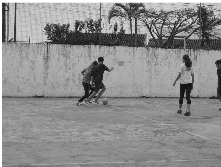
Figura 2: Quadra de Futsal (arquivo pessoal)

Material básico fornecido: bola de vôlei e camiseta para monitor (arquivo pessoal).