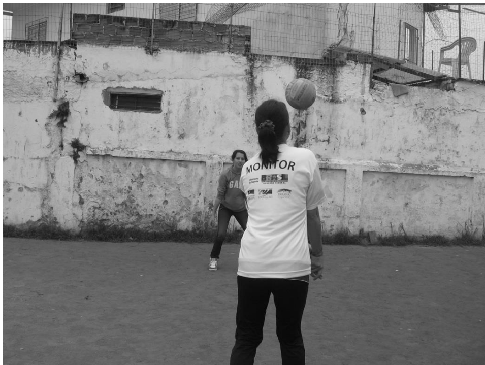
Figura 1: quadra de vôlei.

muitas vezes o início de um jogo que quando se gritava, “próxima!” da quadra de futsal, as crianças saíam no meio da partida para mudar de modalidade.