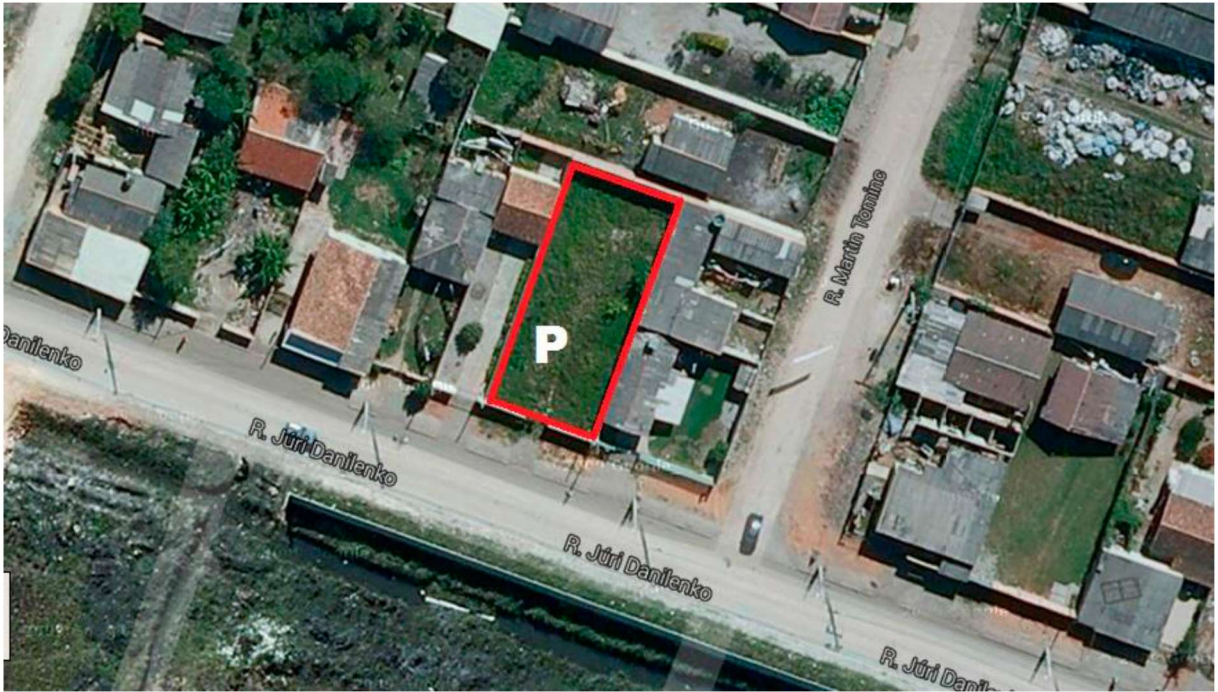
VISTA AÉREA DO IMÓVEL A SER INSTALADO O EMPREENDIMENTO