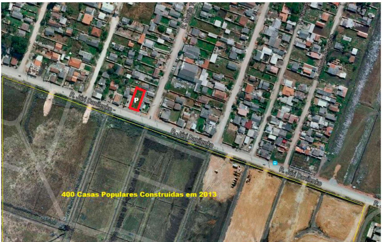
VISTA AÉREA DA LOCALIZAÇÃO IMÓVEL A SER INSTALADO O EMPREENDIMENTO