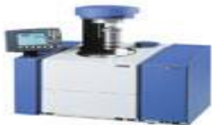
Figura 3- Bomba Calorimétrica

Para a determinação do Poder Calorífico Superior (PCS) foram utilizadas as amostras moídas, visando à obtenção de um material mais fino e homogêneo. As avaliações foram realizadas no Laboratório de Energia de Biomassa Florestal do Departamento de Engenharia e Tecnologia Florestal da Universidade Federal do Paraná (UFPR), utilizando a bomba calorimétrica digital modelo C5000 Cooling System, IKA Werck, com princípio de funcionamento adiabático, de acordo com a norma técnica NBR 8633 (ABNT, 1984).