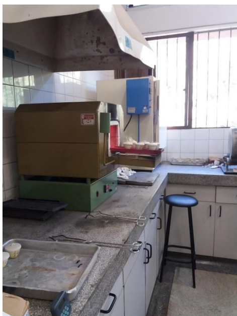
Figura 4- Mufla

Para a realização da Análise Química Imediata (AQI) as amostras também foram preparadas a fim de obter um material mais homogêneo. As análises foram realizadas no Laboratório de Energia de Biomassa Florestal do Departamento de Engenharia e Tecnologia Florestal da Universidade Federal do Paraná (UFPR), de acordo com a norma técnica ASTM D1762 – 84, de 2013.