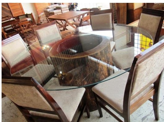
Figura 8- Mesa para Sala de Jantar de Fabricação Própria