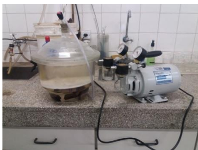
Figura 5- Densidade básica.