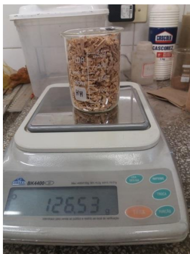
Figura 1- Serragem das Espécies