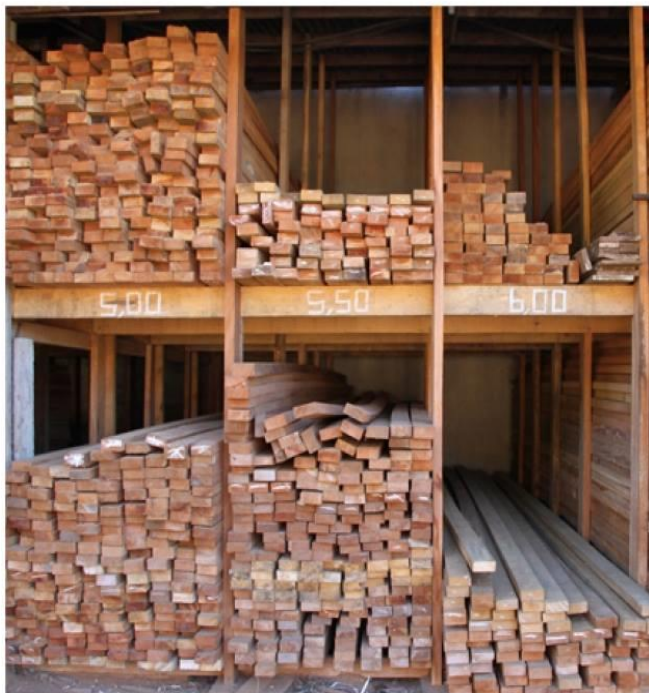
Figura 7- Estoques em Gavetas

As Figuras de 7 a 9 apresentam os produtos industrializados a venda como: madeira serrada, móveis tipo mesa para sala de jantar e para área externa.