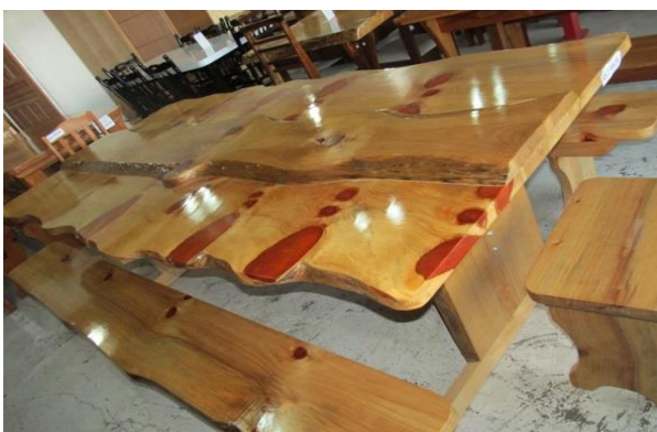
Figura 9- Mesa Maciça para Churrasqueira

A Tabela 1 representa a reposição de estoque do período de Janeiro a Abril de 2016; na Tabela 2 apresenta os produtos industriais e sua produção do mesmo período; a Tabela 3 é referente ao resíduo produzido pela empresa neste mesmo período.