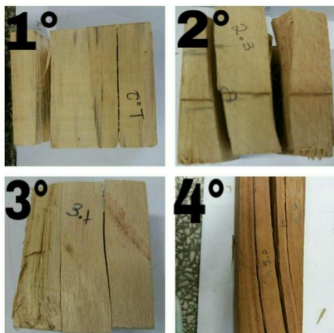
Figura 2- Amostra das Espécies: 1- Pinus; 2-Cambará; 3- Ipê; 4- Cedrinho.