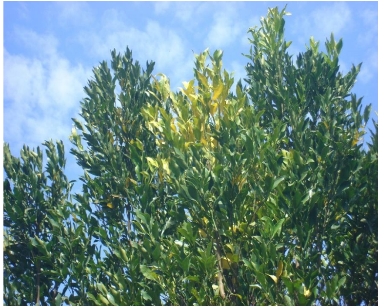
FIGURA 3. SINTOMAS EM PLANTA DE CITROS CONTAMINADA COM GREENING.