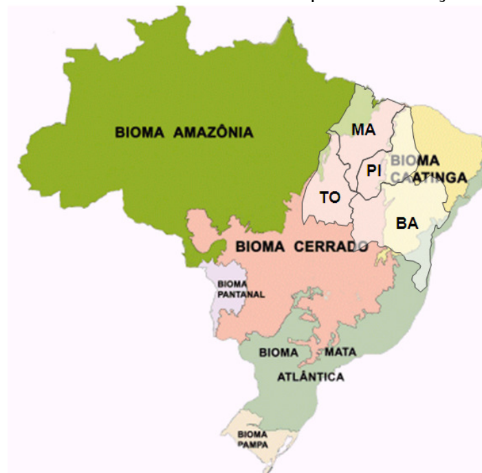
Figura 1. Mapa dos biomas brasileiros com destaque a localização do MATOPIBA.

A área do Cerrado apresenta aproximadamente 1,5 milhões de km 2 . Agregando as áreas periféricas, encravadas em outros domínios vizinhos e nas faixas de transição com os biomas Amazônia, Mata Atlântica e Caatinga, essa área pode ultrapassar 1,8 milhão de km 2 , conforme assinala Coutinho (2004).