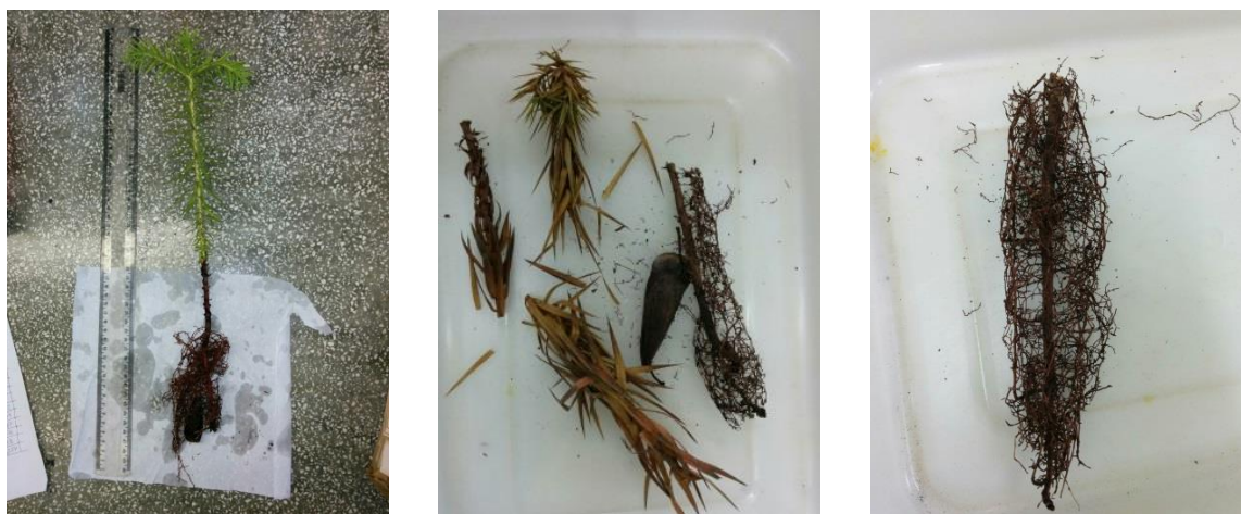
Figura 9: Muda de araucária em que foi realizada a separação entre a raiz e a parte aérea para posterior medição dos parâmetros.

Posteriormente foram realizadas análises morfológica destrutivas de 5 plantas por repetição, retiradas aleatoriamente para avaliar o Peso Verde da Parte Aérea (PVPA), Peso Verde da Raiz (PVR), Peso Seco da Parte Aérea (PSPA) e Peso Seco da Raiz (PSR). As Figuras 9 e 10, ilustram esse processo com mudas de araucária e de juçara, respectivamente.