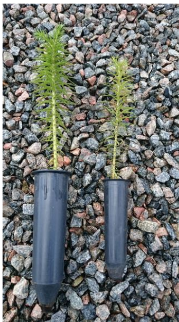
Figura 8: Tubetes utilizados no experimento para Araucaria angustifolia , com 280 e 90 cm 3 respectivamente.

As sementes foram coletadas e plantadas em julho de 2014, sendo a avaliação do experimento realizada em julho de 2015. É importante ressaltar que a medida que o volume do tubete aumenta, aumenta-se a quantidade de substrato e de nutrientes NPK presentes como aditivo no mesmo, assim como também aumenta-se a quantidade de corretores de acidez e vermiculita. Assim os tubetes de 55 cm 3 continham 2,75 cm 3 de adubo NPK (5% do total de substrato), os tubetes de 90 cm 3 continham 4,5 cm 3 e os de 280 continham 14 cm 3 de NPK. Isso é um fator que influenciará positivamente no crescimento das mudas.