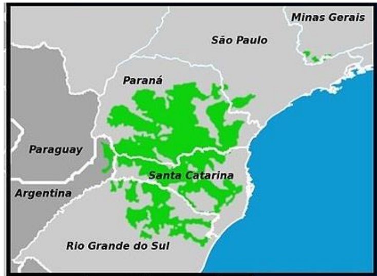
Figura 4: Mapa de ocorrência da araucária.

A polinização é anemocórica, sendo que esta efetua-se entre agosto e outubro, e dois anos após a polinização as pinhas ficam maduras, sendo os pinhões encontrados entre abril e junho. Os pinheiros iniciam a produção de pinhões quando atingem a idade mínima de 10 anos, porém alguns só iniciam a partir dos 20 anos. Um pinheiro produz em média 40 pinhas por safra, ao longo de toda sua vida que leva em média 200 anos, sendo a produção apresentada em ciclos, ou seja, não produz todos os anos. As sementes (pinhões) são espalhadas pelo chão da floresta através de dispersão barocórica. Muitas vezes também zocórica, feita por aves e roedores que enterram a semente para comer posteriormente. É uma espécie secundária longeva, porém de temperamento pioneiro, e heliófita (necessitando de intensa luz) quando adulta, sendo colonizadora de campos abertos (CARVALHO, 2002). A Figura 5, ilustra a morfologia de um pinhão.