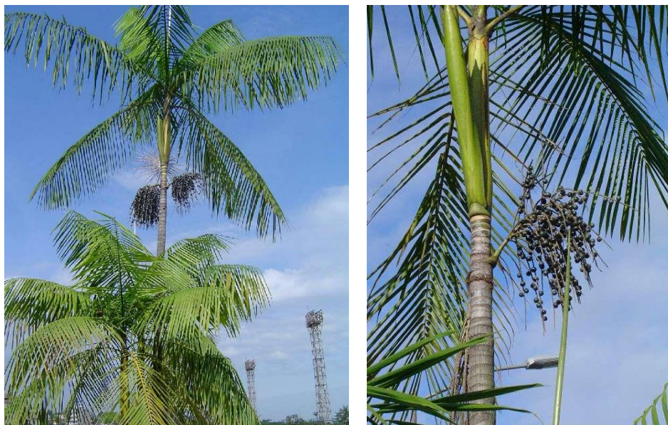
Figura 1: Fotos ilustrativas de Euterpe edulis , mostrando o estipe, os frutos, as bainhas que protegem o palmito, e suas respectivas folhas.

(ou albume, que é um tecido nutritivo usado pelo embrião para seu desenvolvimento), com alto teor de reservas, que protegem o embrião lateral, e o formato da semente é arredondado, de cor amarelada e envolta por uma cobertura fibrosa (SALDANHA, 2007). A Figura 1, ilustra a palmeira juçara.