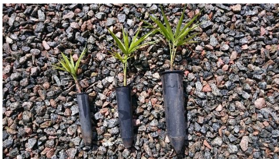
Figura 7: Tubetes utilizados no experimento para Euterpe edulis .

Os tratamentos foram distribuídos da seguinte forma: Tratamento 1: tubetes com a capacidade de 55 cm 3 (altura = 12 cm e diâmetro = 2,6 cm); Tratamento 2: tubetes com capacidade de 90 cm 3 (altura = 14 cm e diâmetro = 3,6 cm); e Tratamento 3: tubetes com capacidade de 280 cm 3 (altura = 19 cm e diâmetro = 5 cm). Todos os tubetes possuíam seção circular com 8 estrias internas. A Figura 7, ilustra os 3 diferentes tamanhos de tubetes.