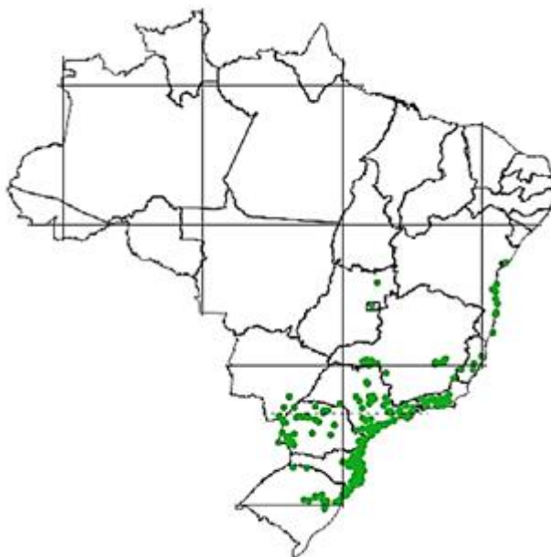
Figura 2: Áreas de ocorrência de Euterpe edulis .

A juçara começa a floração a partir do sexto ano de idade. A floração inicia-se em setembro e vai até dezembro. O fruto se desenvolve a partir das flores, levando até oito meses para lentamente atingir a maturação. Encontra-se frutos maduros de julho a dezembro. É uma planta que exige no mínimo 1500 mm anuais de chuva para crescer com exuberância. É uma espécie monóica, ou seja, encontram-se flores unissexuais, masculinas ou femininas, distribuídas na mesma planta. O cacho com frutos na verdade é a inflorescência da juçara (AGUIAR et al. , 2002).