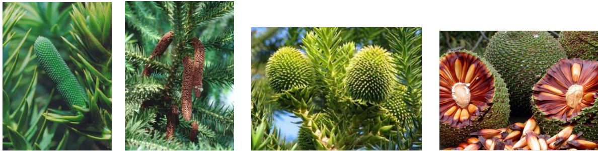
Figura 3: Estróbilos (“flores”) masculino (amentó) verde e maduro, e feminino (pinha) verde e maduro respectivamente.

escama da pinha produz um único óvulo, o tão conhecido pinhão, sendo o endosperma (que protege o embrião com os cotilédones) rico em reservas energéticas, principalmente amido e aminoácidos. A araucária precisa de uma precipitação média anual que varia de 1200 a 3000 mm (CARVALHO, 2002). A Figura 3, ilustra estróbilos masculinos e femininos verdes e maduros da araucária.