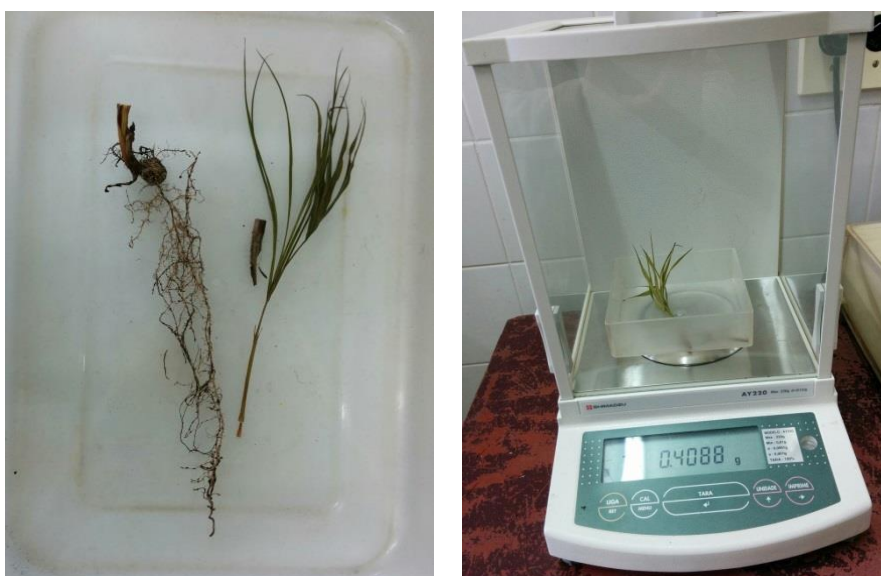
Figura 11: Muda de juçara em que foi separada a parte aérea da raiz, sendo ambas as partes posteriormente secas em estufa para medição do peso em balança de precisão.

muda avaliada foram lavadas em água corrente separadamente, utilizando peneiras para reter cada raiz, retirando todo o substrato e secadas com papel toalha para retirar o excesso de água e em seguida realizado a pesagem em balança de precisão, para posterior acondicionamento em sacola de papel identificada, para realizar a secagem e mensurar o seu respectivo peso seco. Após a pesagem, identificação e acondicionamento em sacola de papel estas amostras foram levadas para a secagem em estufa a 100° C por 48 h e então realizada a pesagem em balança de precisão. A Figura 11, ilustra esse processo.