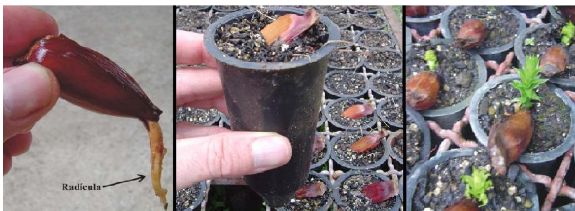
Figura 6: Emissão da radícula de um pinhão; pinhões plantados de forma inclinada; emissão da parte aérea.

Após a obtenção das sementes, estas devem ser colocadas para germinação o mais rápido possível, pois não toleram o armazenamento por muito tempo (são sementes do tipo recalcitrante). Antes disso, é interessante colocar em um recipiente com água, para verificação da viabilidade, sendo que as que afundarem estão viáveis, e as que boiarem estão estragadas. Para acelerar e uniformizar a germinação das sementes é recomendável deixá-las na água em temperatura ambiente por um período de 24 horas. Com relação aos tubetes o recomendável é com no mínimo 110 cm 3 de volume. Diferentes substratos e adubações podem ser utilizados. Entre 20 e 40 dias antes de serem levadas para campo, o processo de rustificação faz-se necessário, podendo-se para isso diminuir a quantidade disponível de água para a planta, deixando-a em pleno sol. Deve-se colocar uma semente por tubete, de maneira inclinada, com a parte mais fina para baixo. Apesar da araucária mostrar boa germinação em pleno sol, é recomendável 50% de sombra durante a germinação. 20 a 40 dias após a semeadura inicia-se a germinação, na qual se é emitido primeiro a raiz e depois a parte aérea (WENDLING; DELGADO, 2008). A Figura 6, mostra a emissão da radícula e da parte aérea de um pinhão, assim como a maneira mais adequada de se plantá-lo.